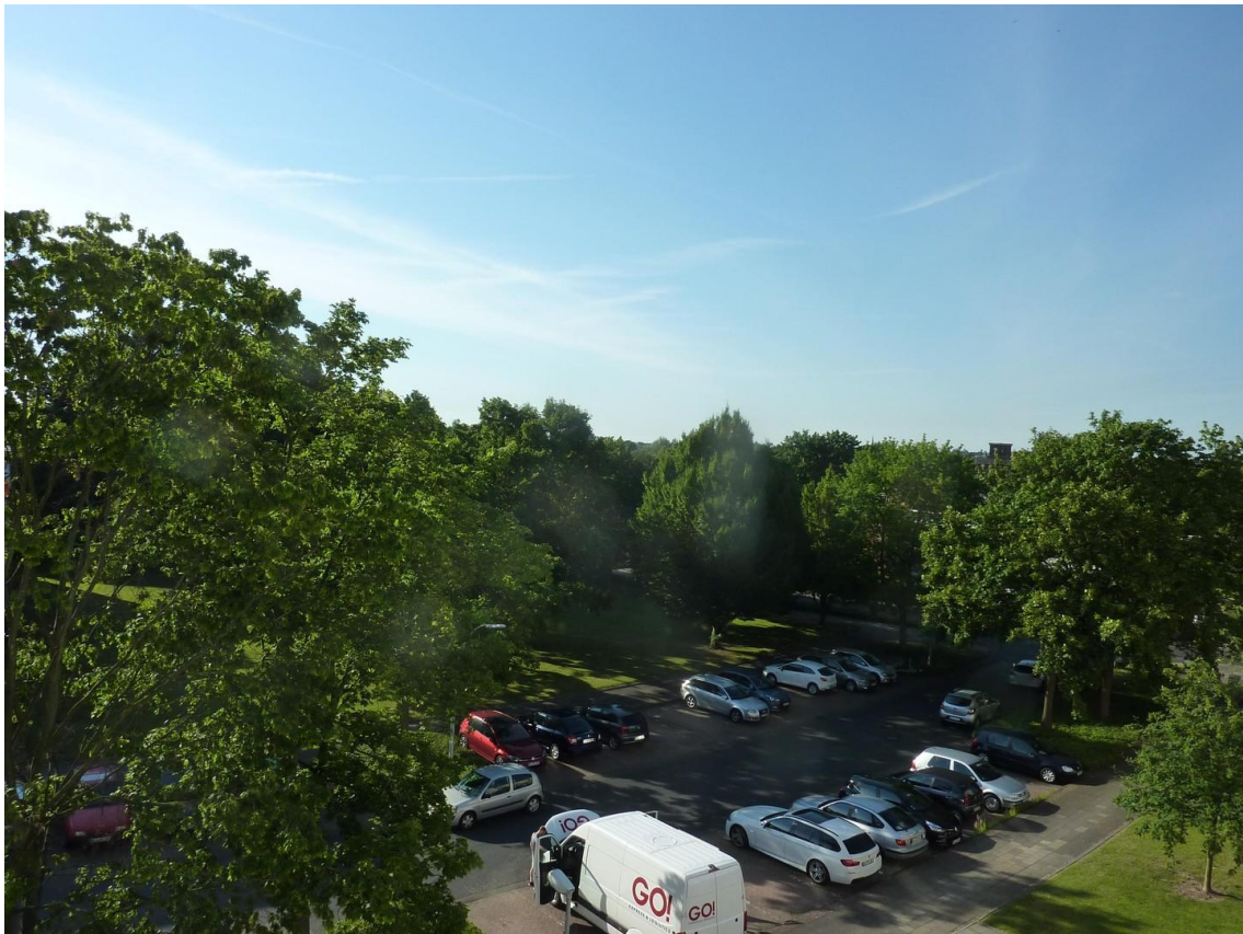
Sommerraussicht nach Osten