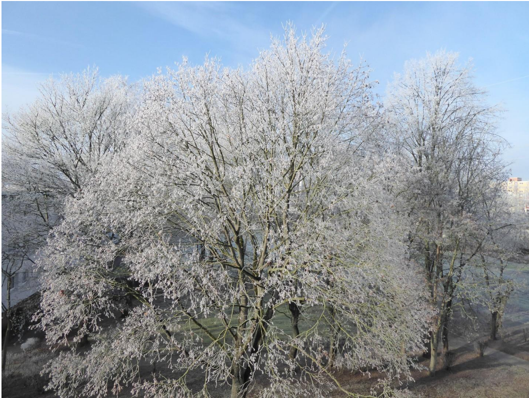
Winteraussicht nach Westen