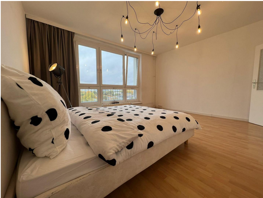
mittleres Zimmer/ abteilbar