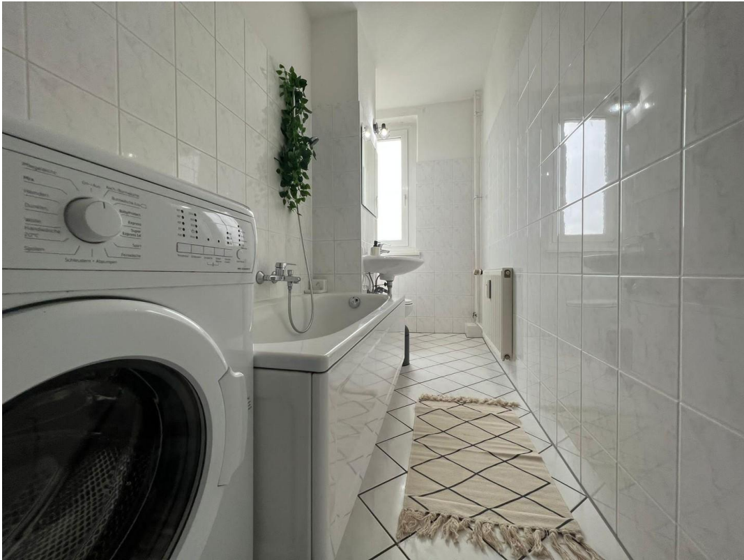
Ausblick zum Fernsehturm