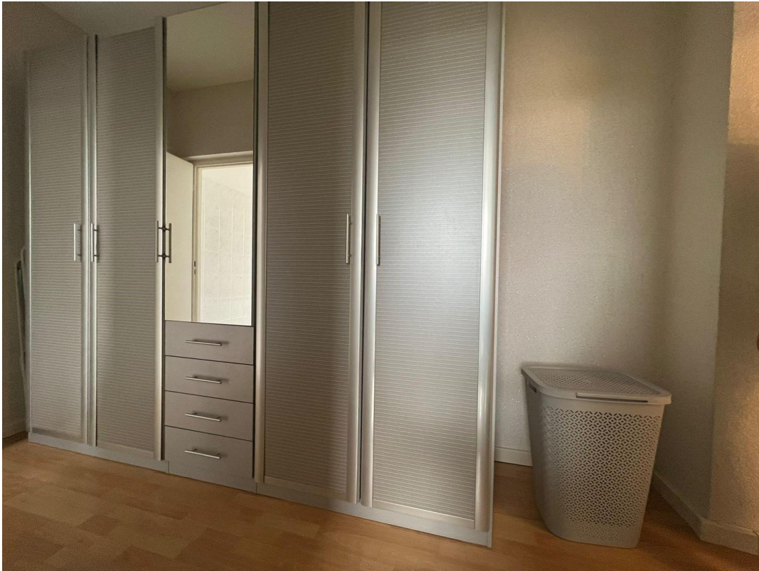
Vorzimmer vor Küche