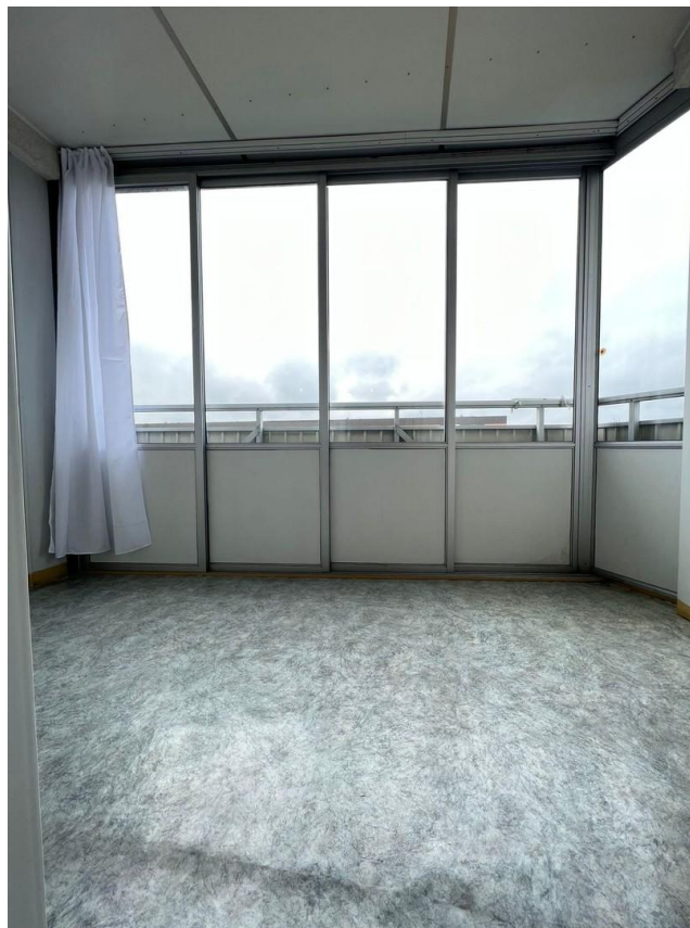
Loggia mit geschlossenen Türen