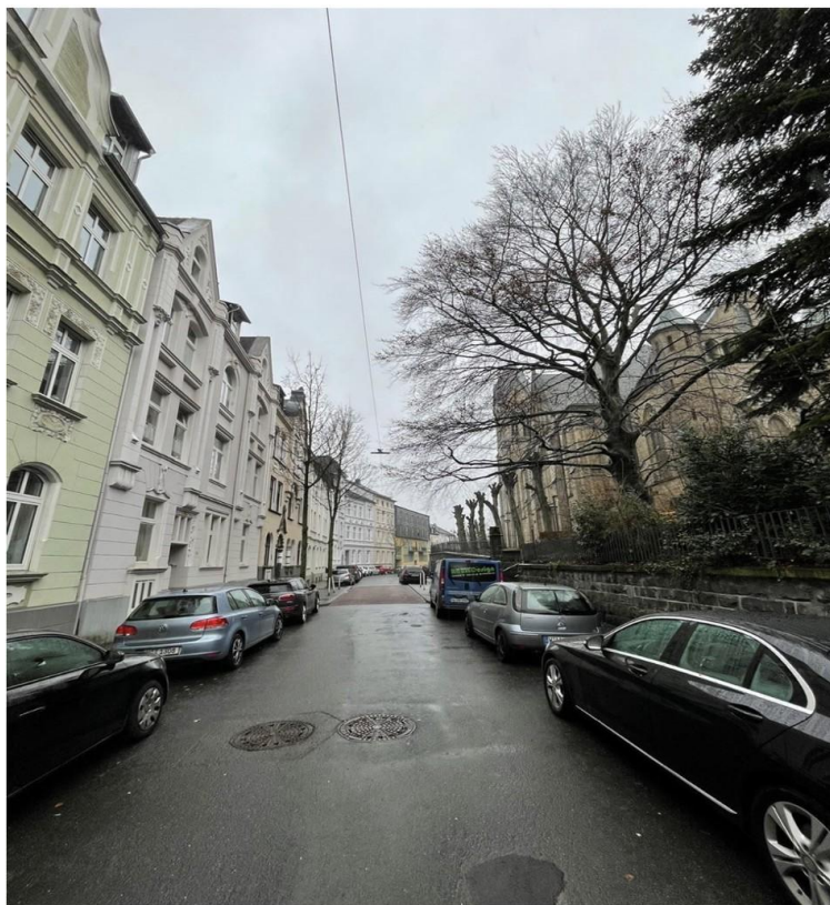
Blick in die Straße