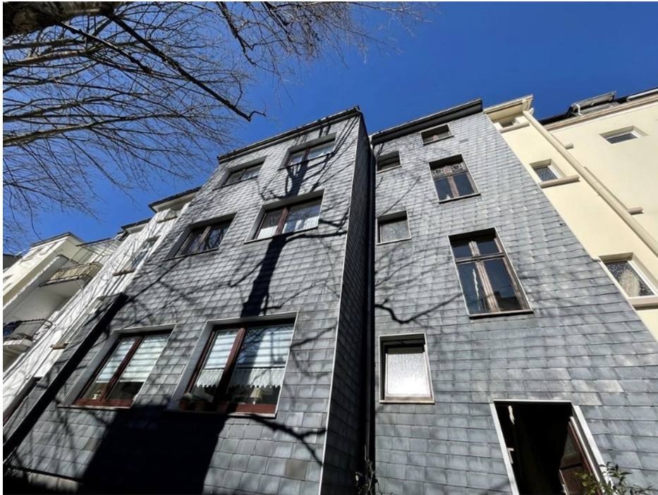
Hofansicht Rückseite des Hauses