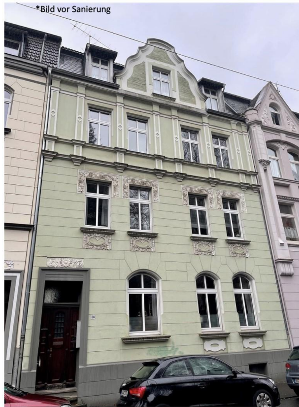
Normannenstraße 88, 42277 Wuppertal