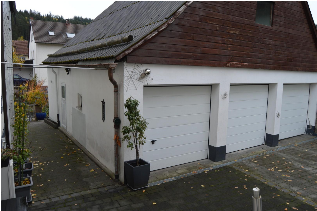
Garagen mit Sektionaltor