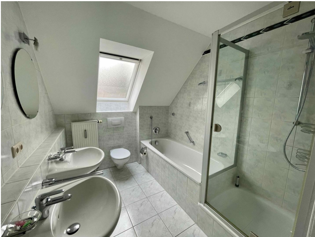
Bad 2. OG