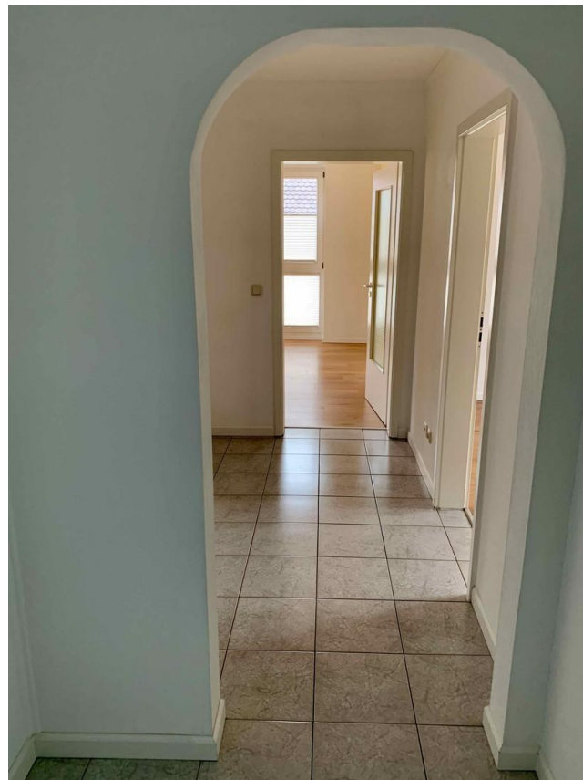
Flur 2. OG