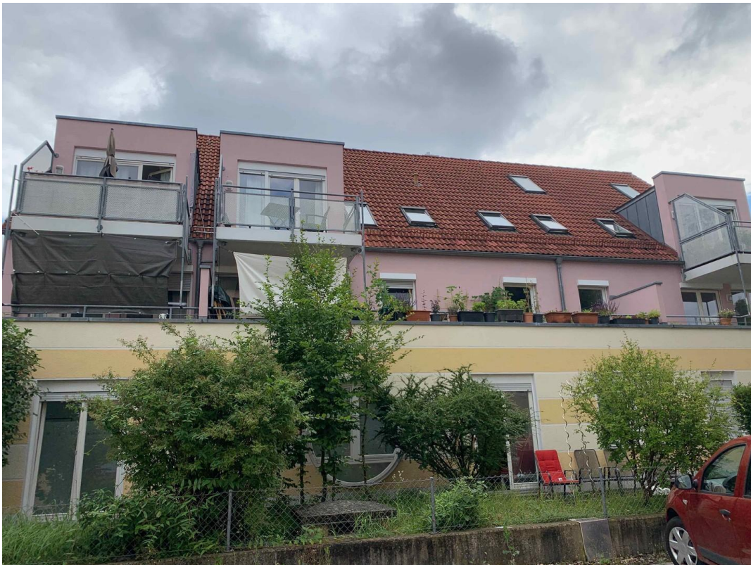
Hausansicht von Westen