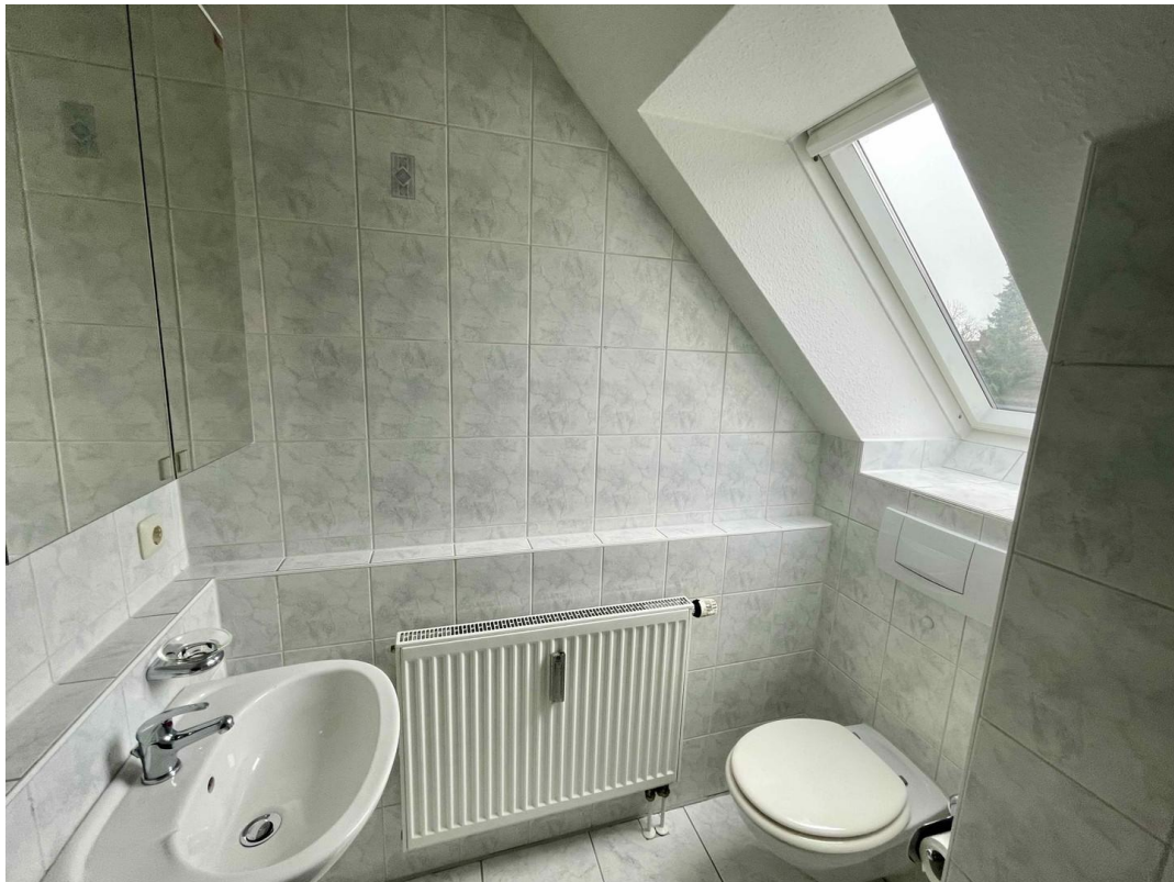
Bad 3. OG