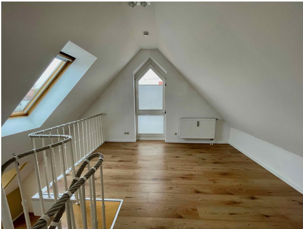
Galeriezimmer 3. OG