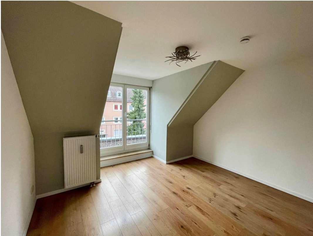
Schlafzimmer 2. OG