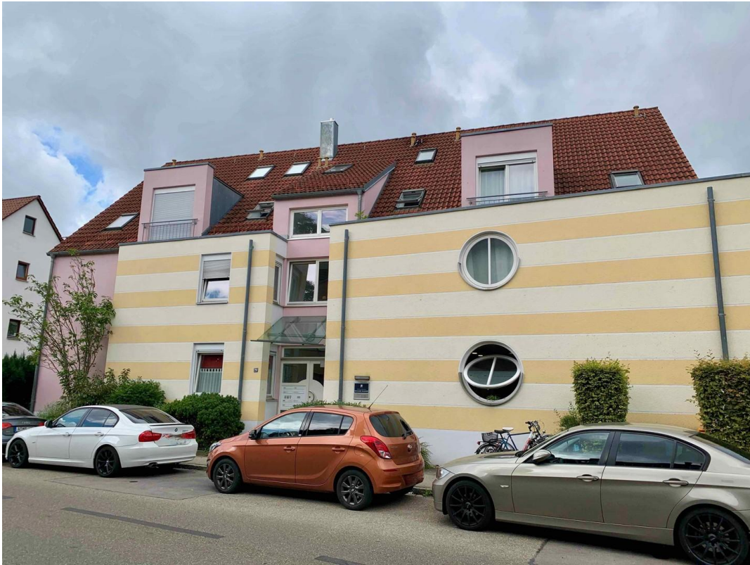
Hausansicht von Osten