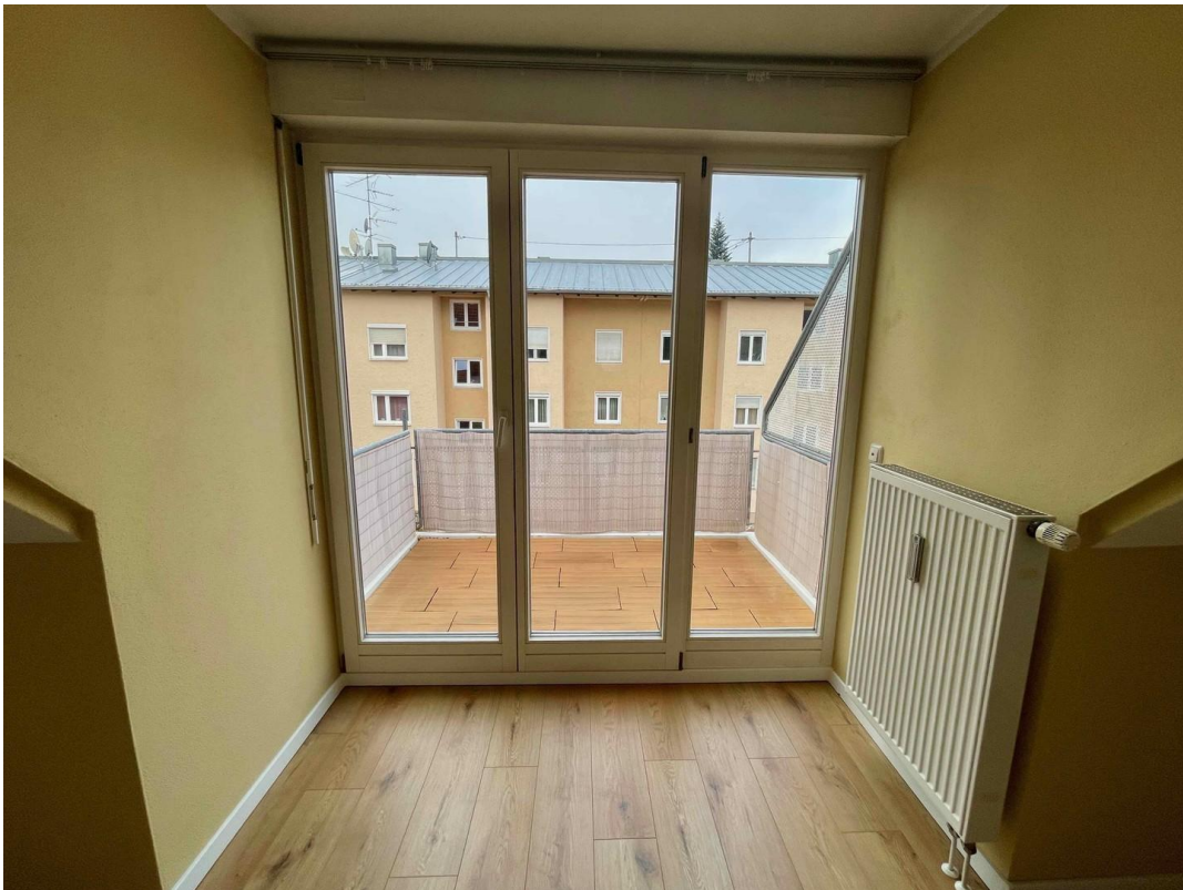
Blick auf Balkon