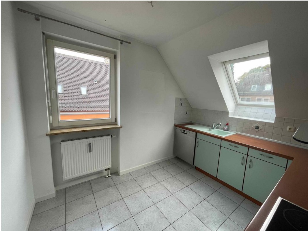
Küche mit Einbauküche