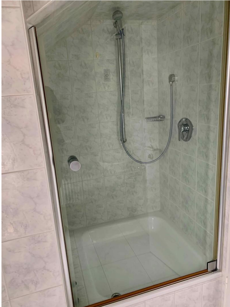
Bad 3. OG Dusche