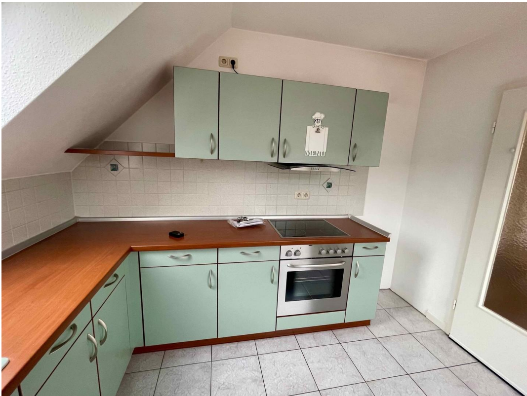
Küche mit Einbauküche