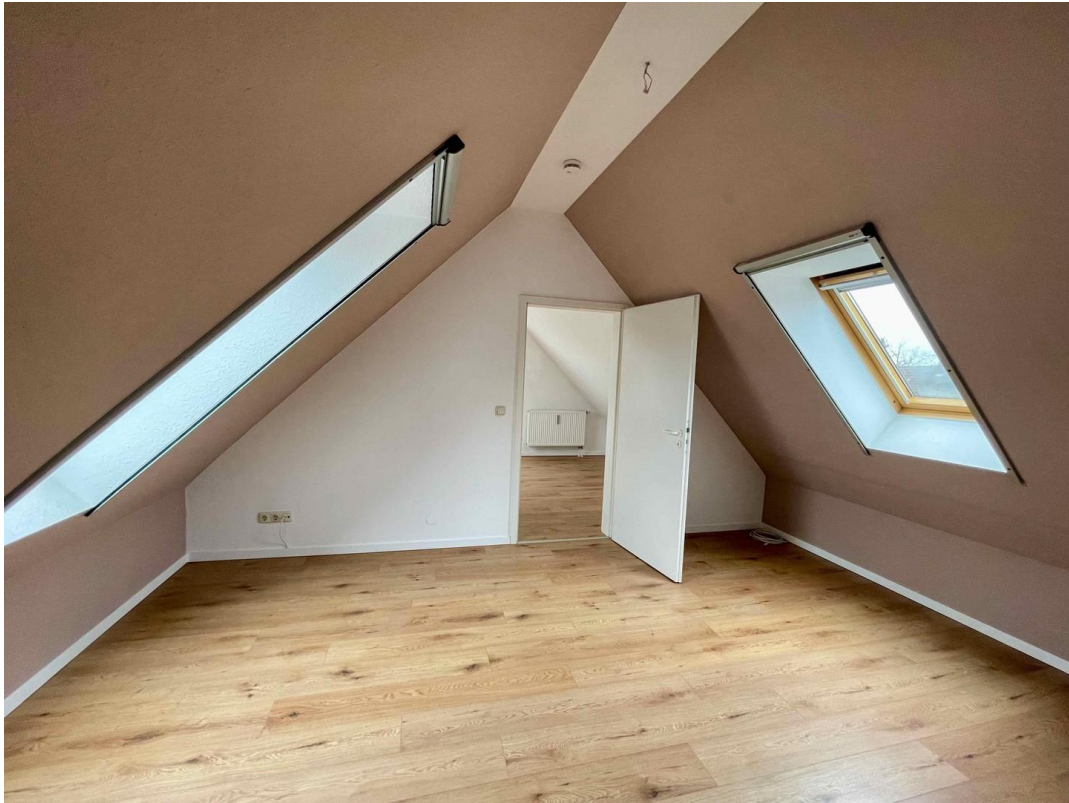
Schlafzimmer/Büro 3. OG