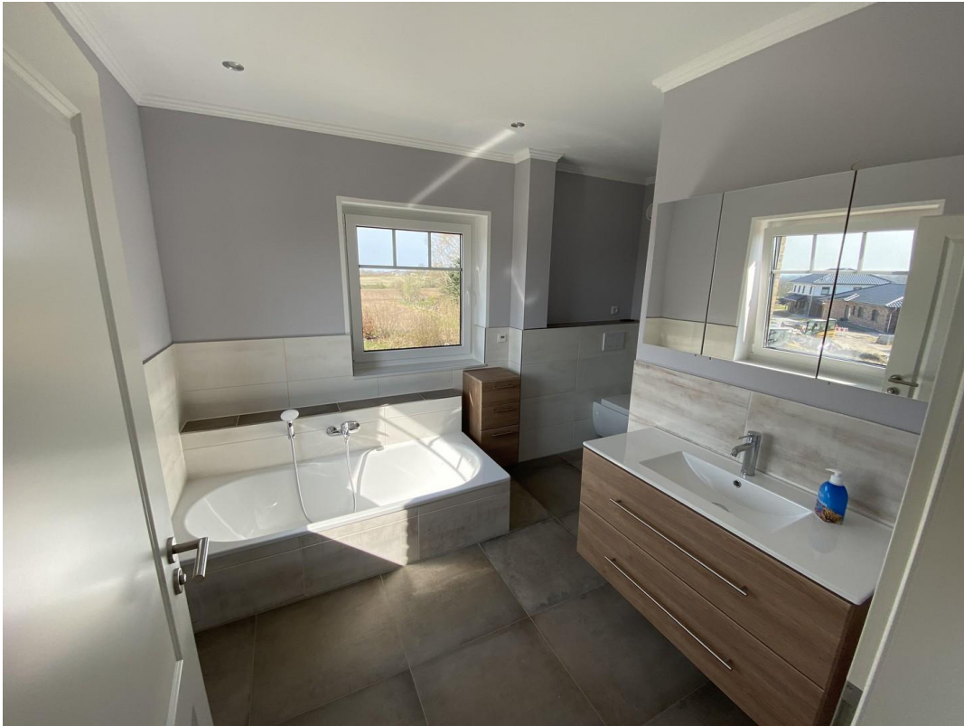
Bad 1. OG