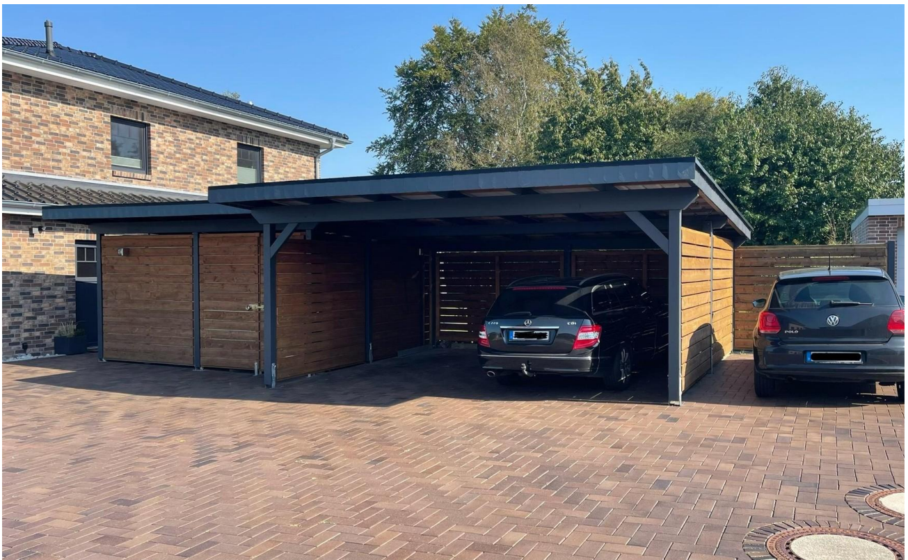
Doppelcarport mit Abstellraum