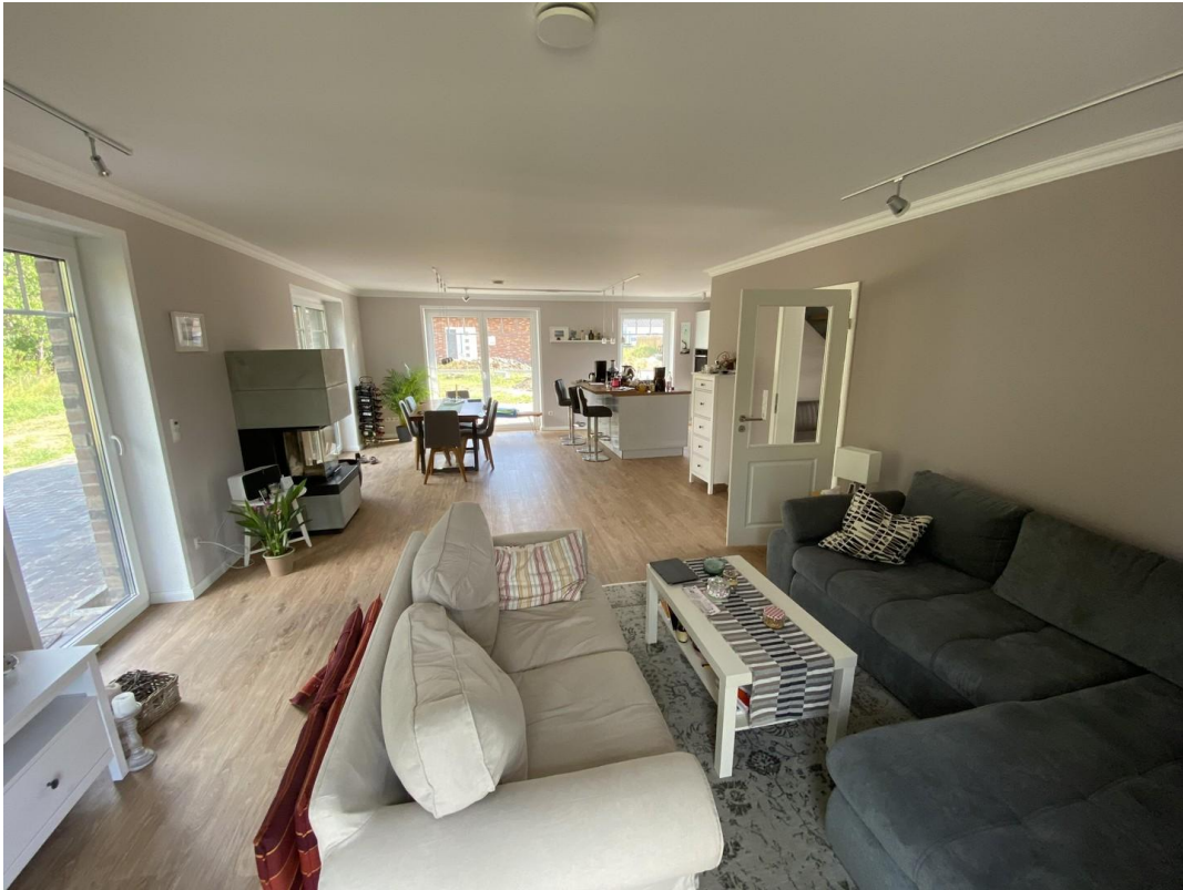
Wohnzimmer mit Essbereich