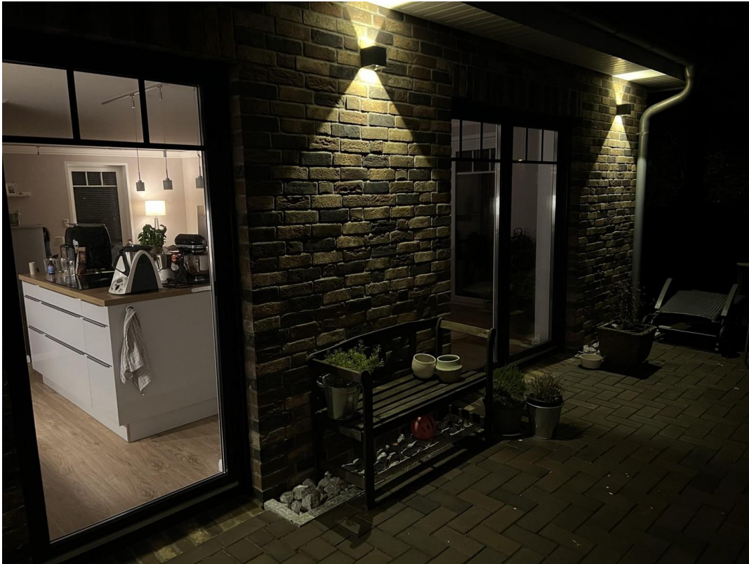
Küche von draußen