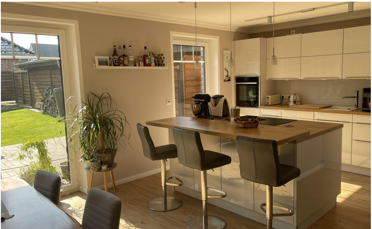
Küche mit Tresen