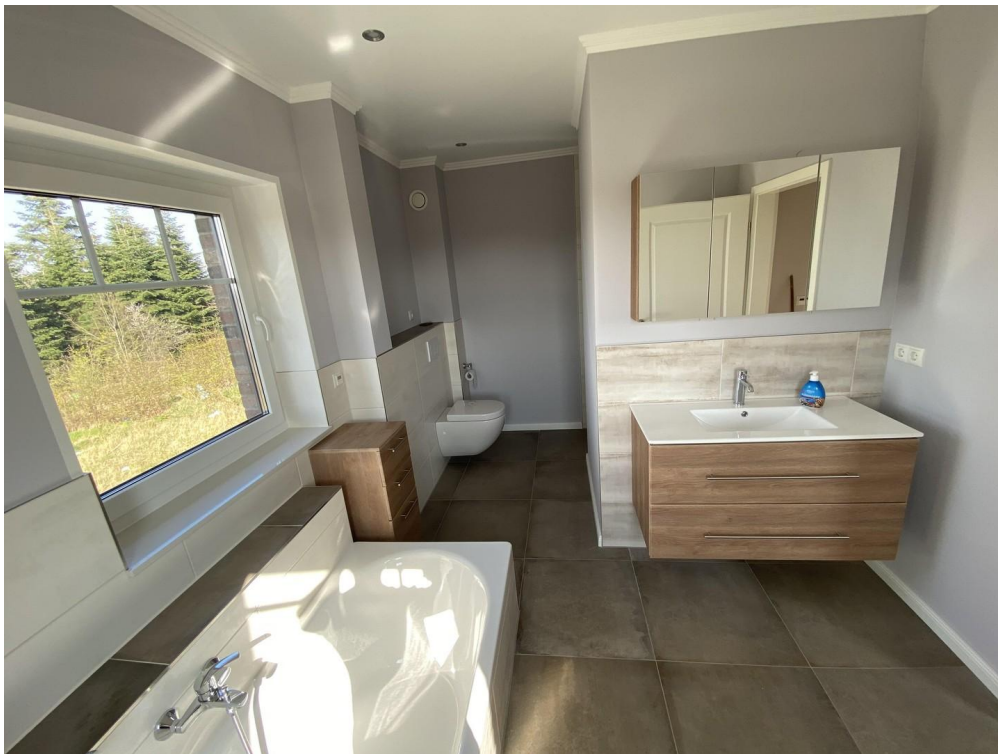
Bad 1. OG