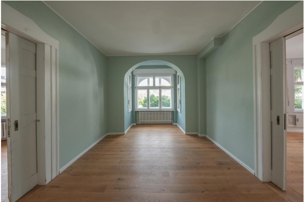
Zimmer im EG