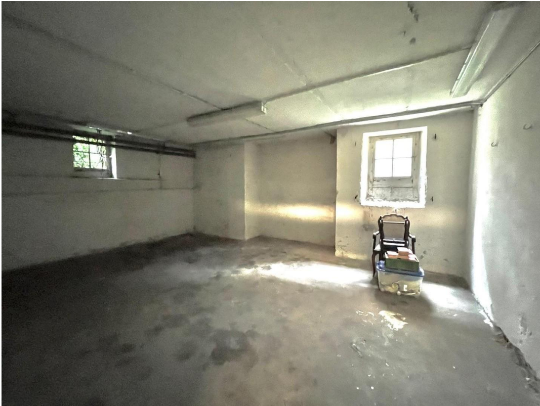
Keller mit hohen Räumen