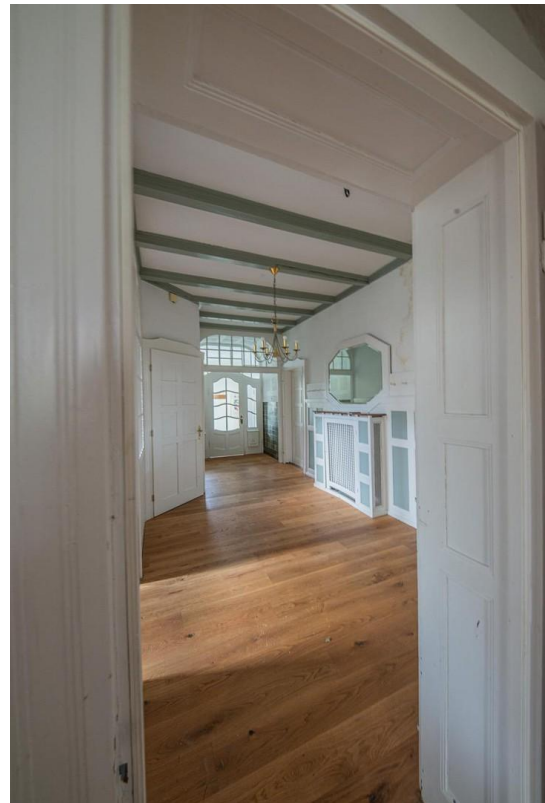
Blick ins Vestibül zur Windfan