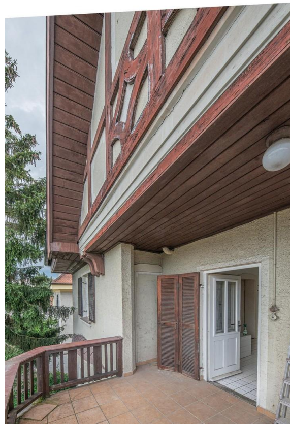
Terrasse im Obergeschoss