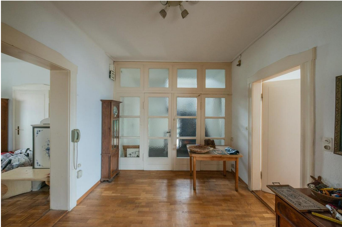
Halle im Obergeschoss