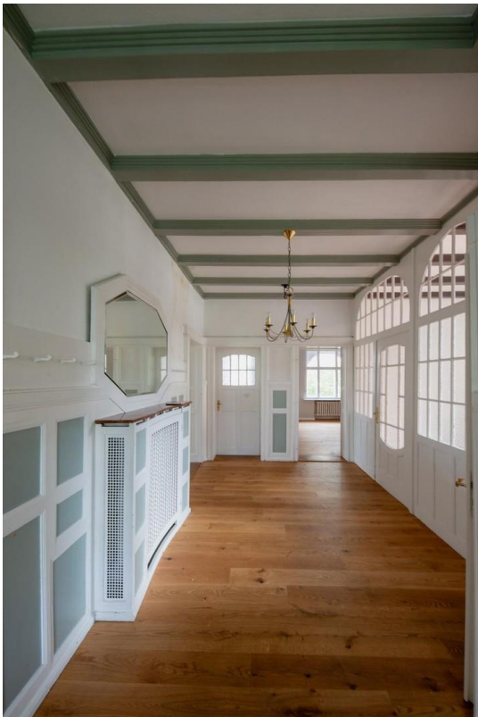
Vestibül im EG