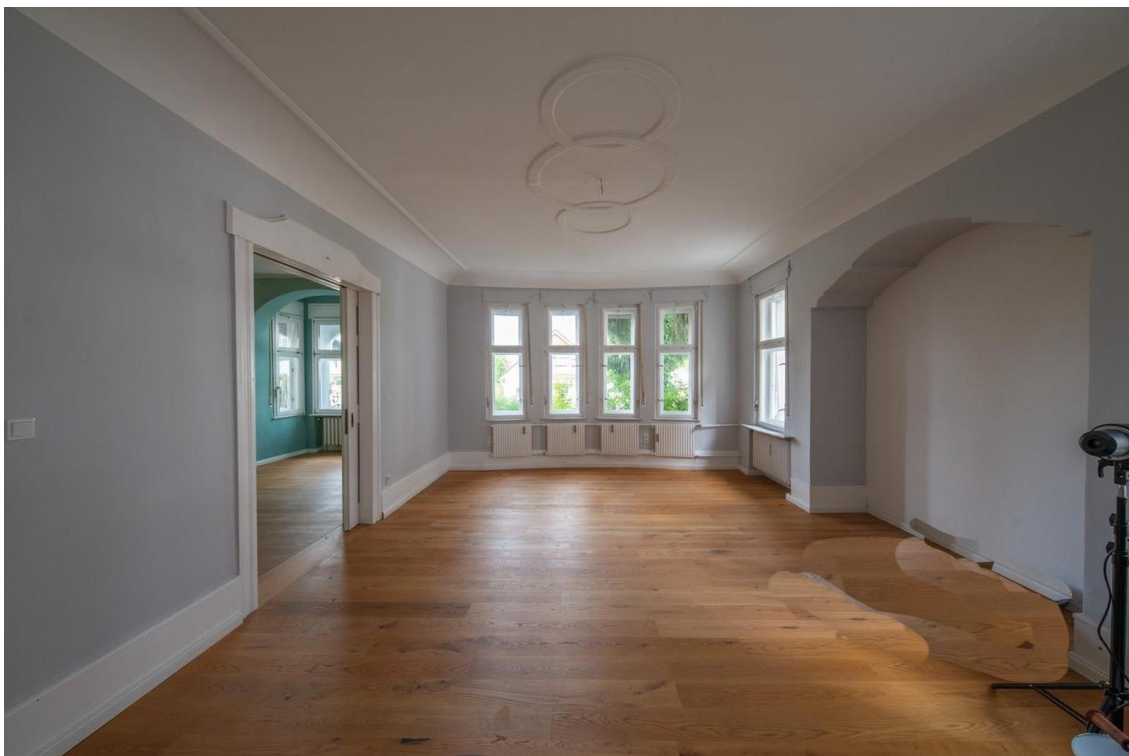
Zimmer im EG