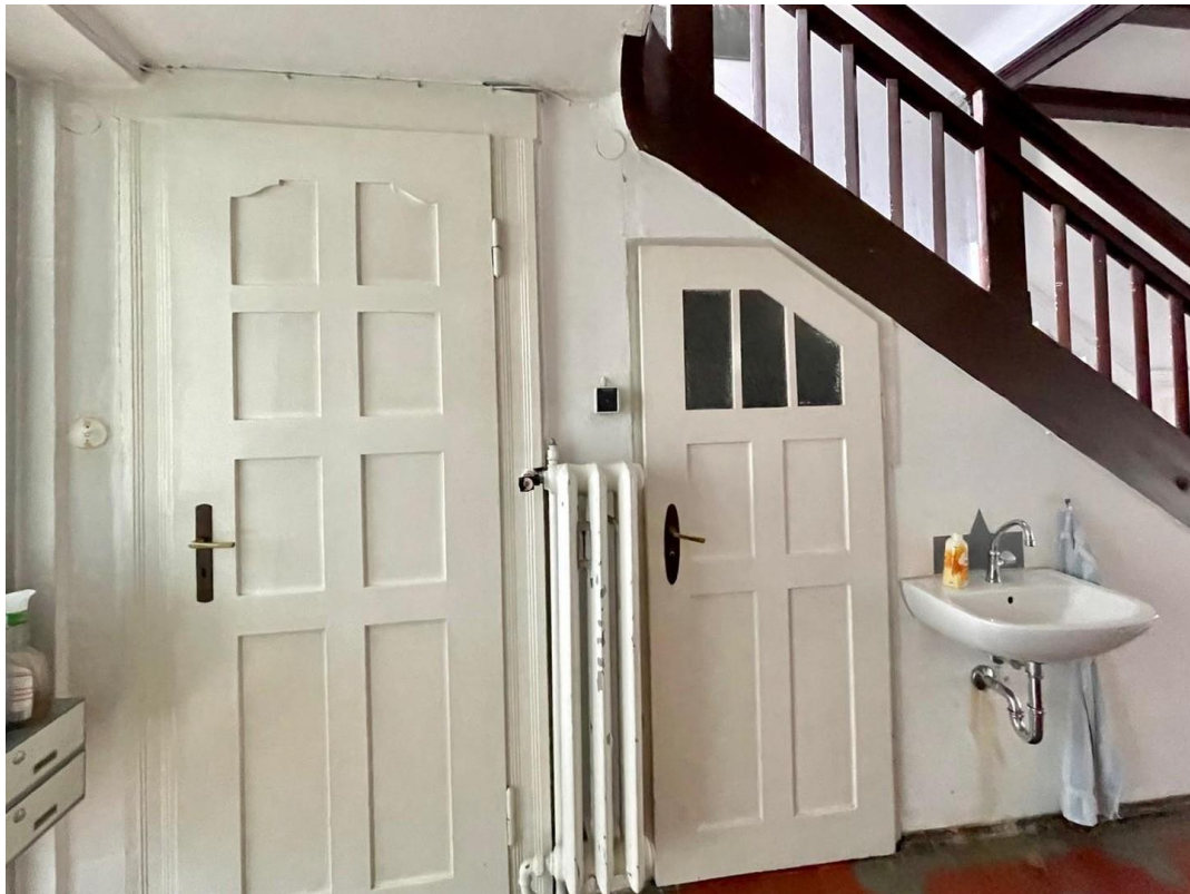
Kellerzugang mit Treppe