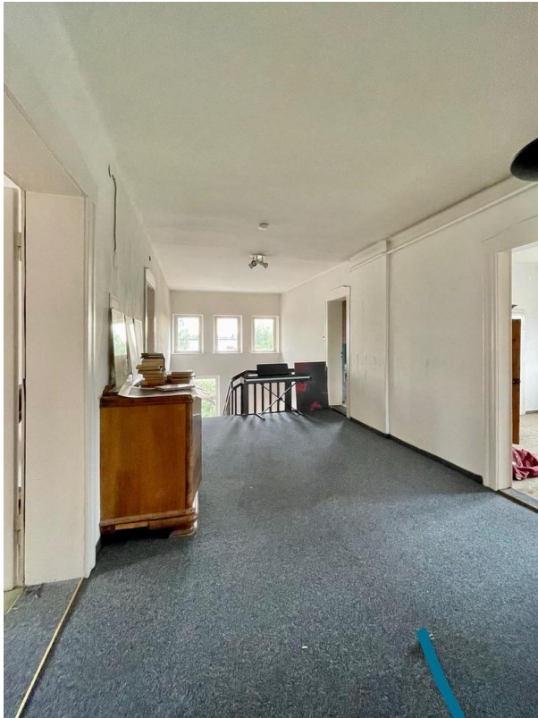
Flur mit Treppenhaus im DG