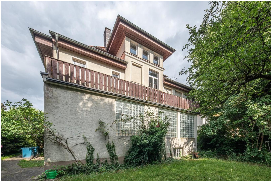
Blick vom Garten