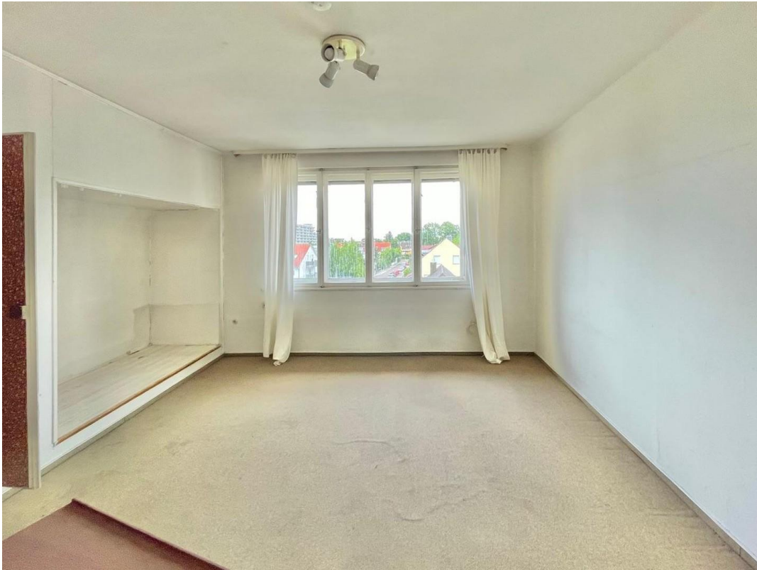
Zimmer im Dachgeschoss