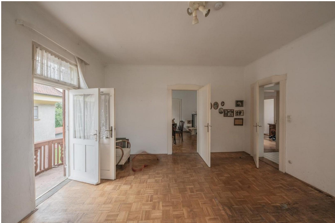
Zimmer im OG mit Balkon