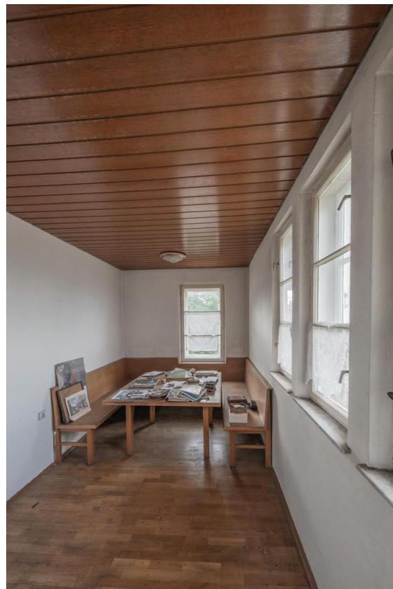
Schreibstube im Obergeschoss