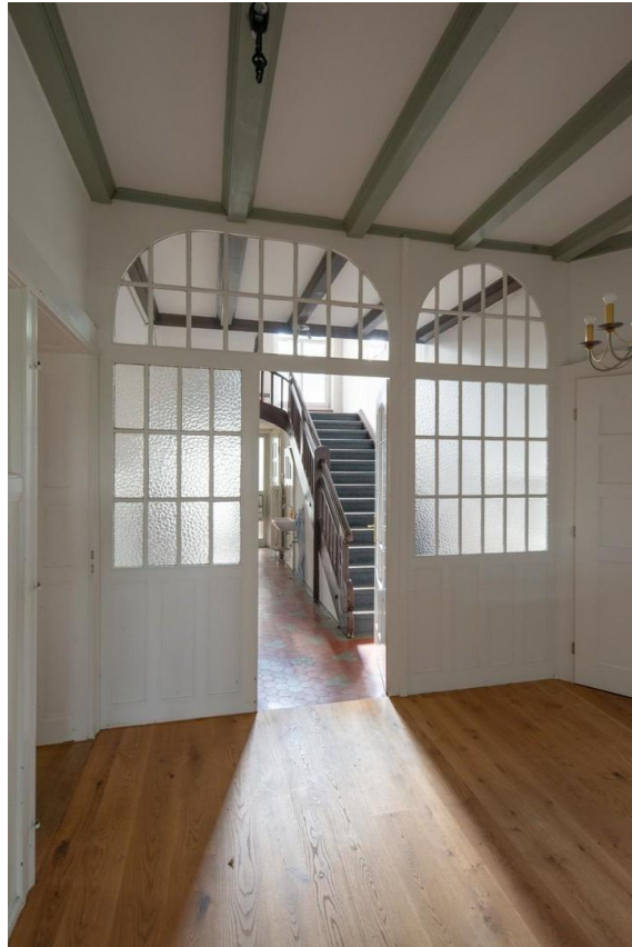
Blick zur Treppe