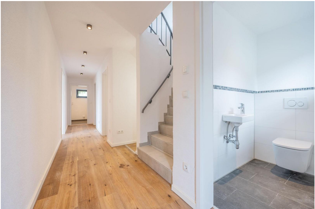
Flur EG mit Gäste-WC