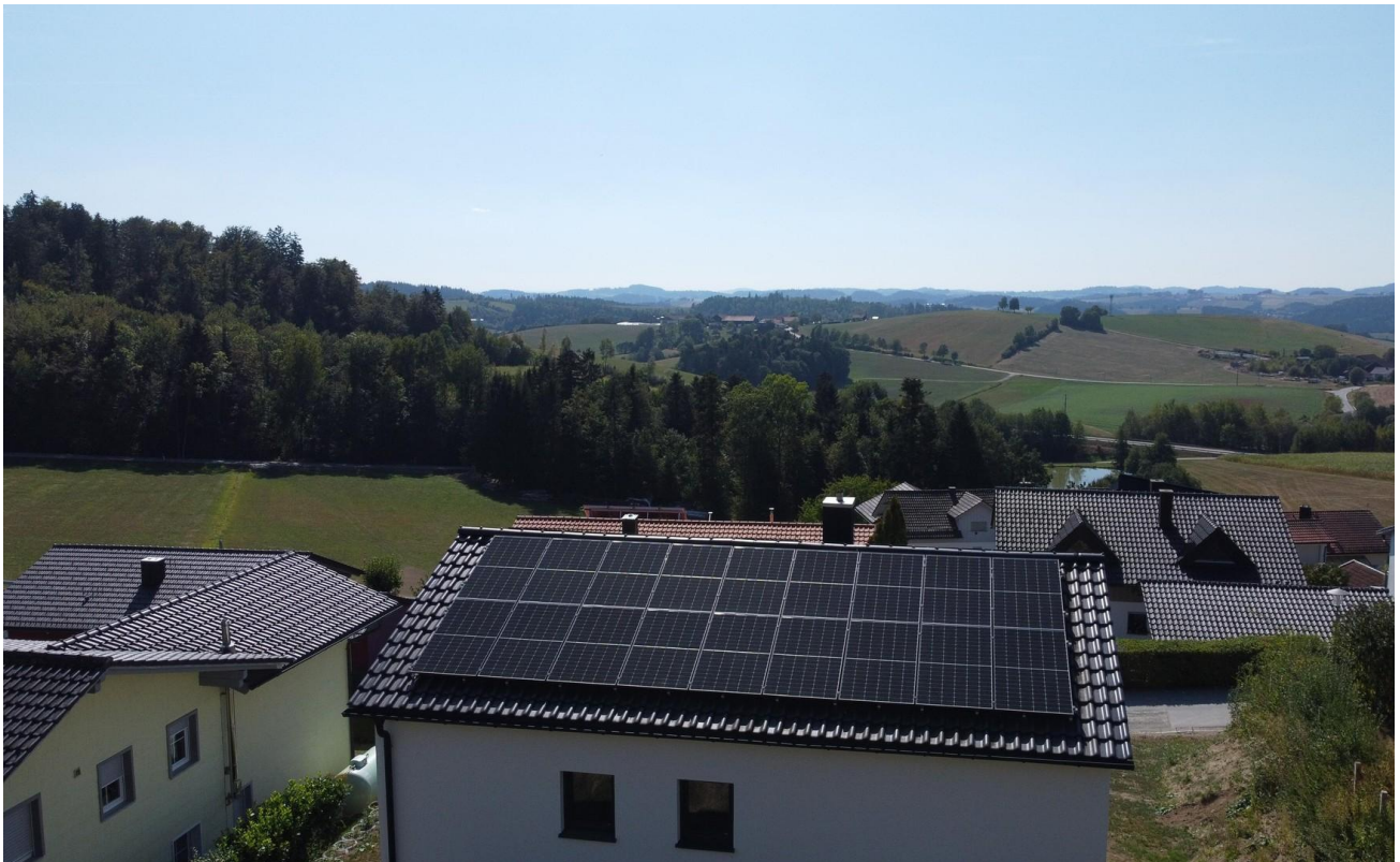
Blick nach Süd-West