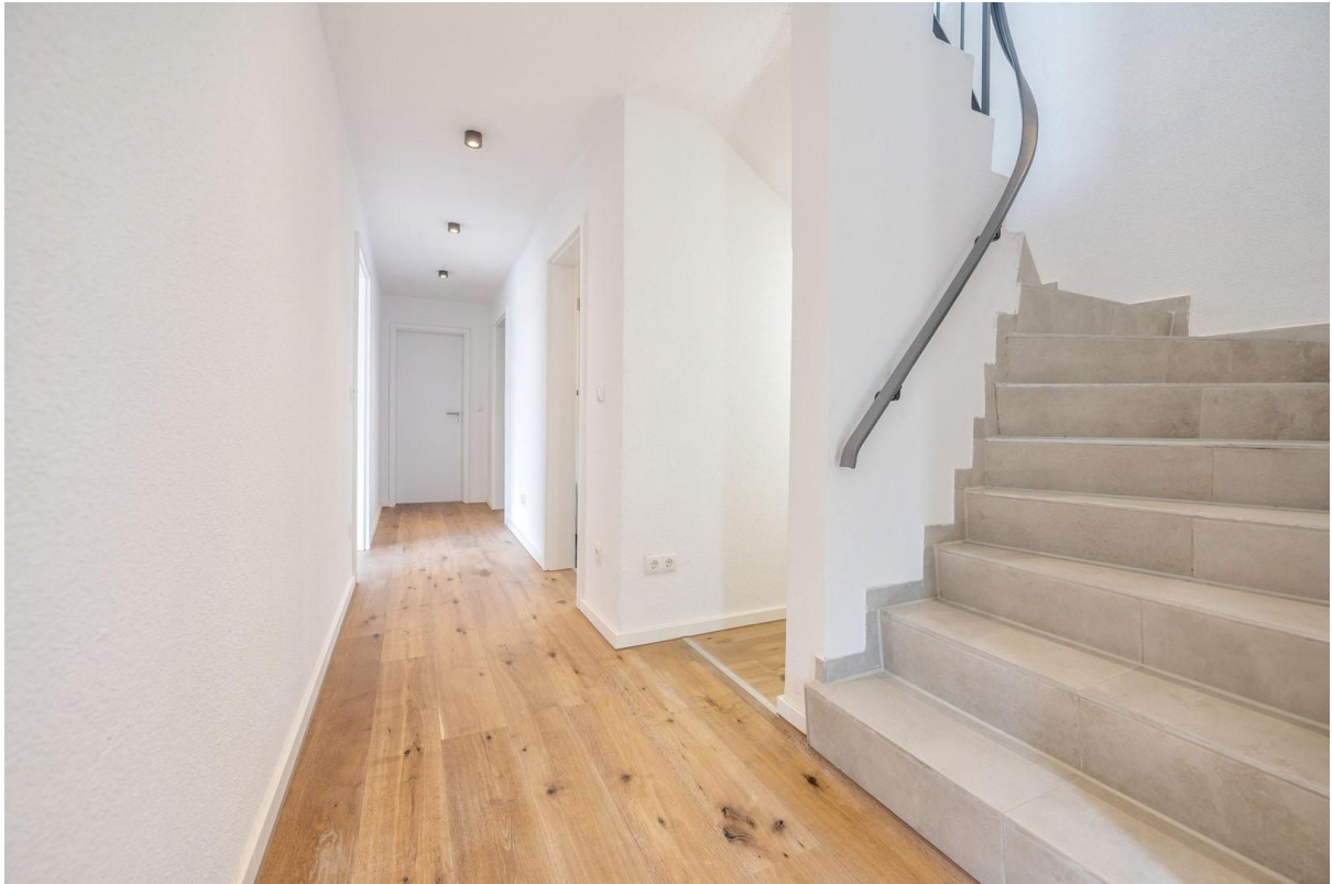
Flur EG / Treppenhaus