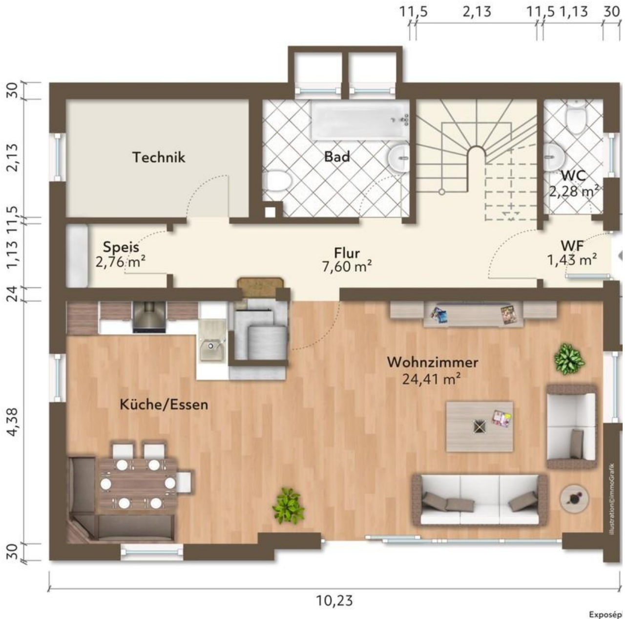
Grundriss - Erdgeschoss