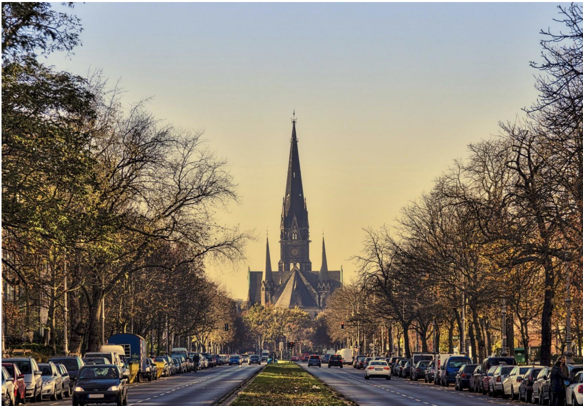
Kirche am Südsterne