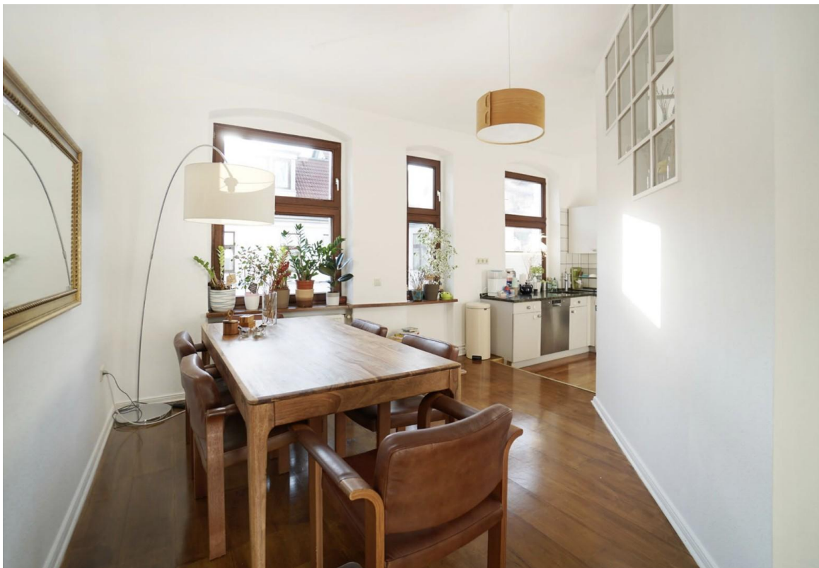
weitere Ansicht Wohn- und Essb