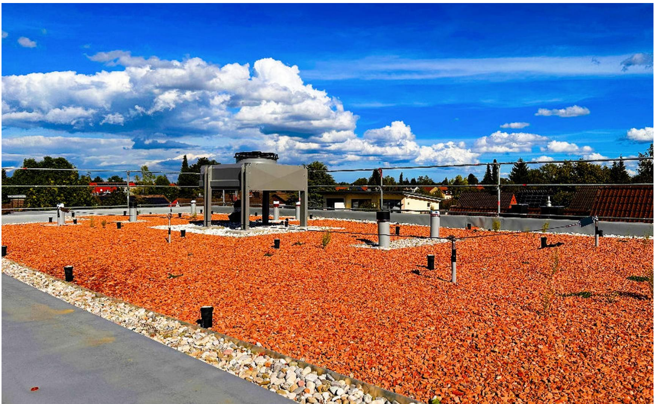
Wärmepumpe auf dem Dach