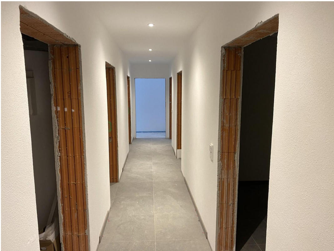
Alles andere als ein "Keller"