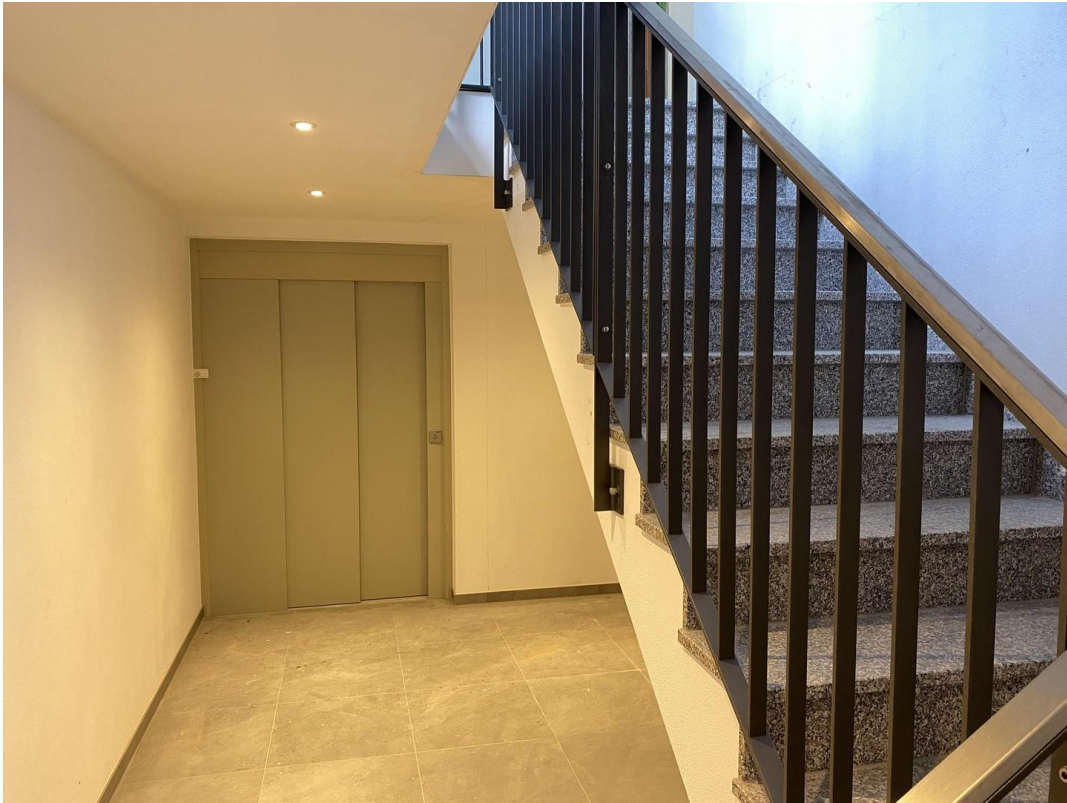
Treppenhaus mit Lift