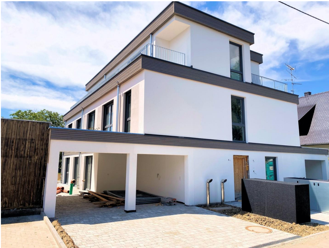
Ansicht Nord / Eingangsseite