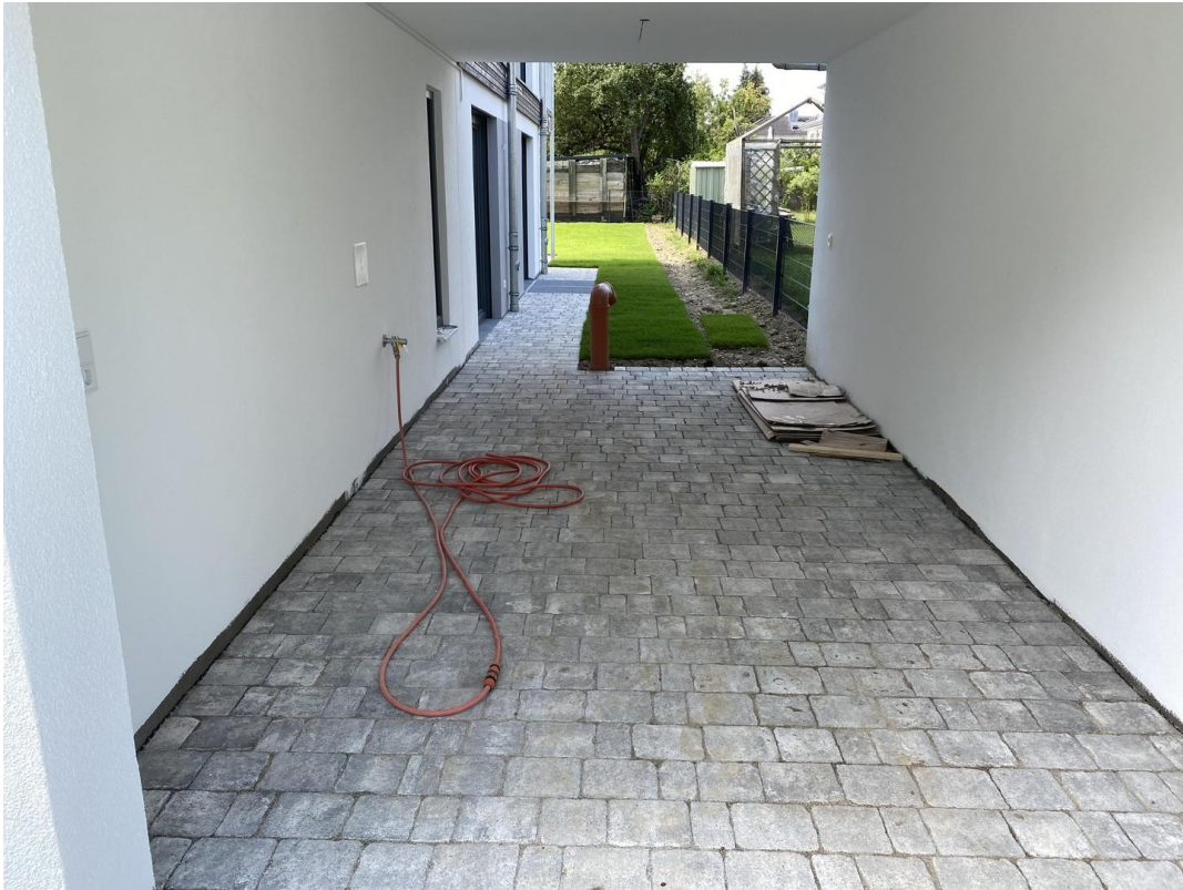
Einzelgarage mit Gartenzugang