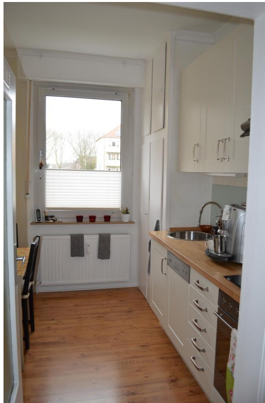
Küche beidseitig stellbar