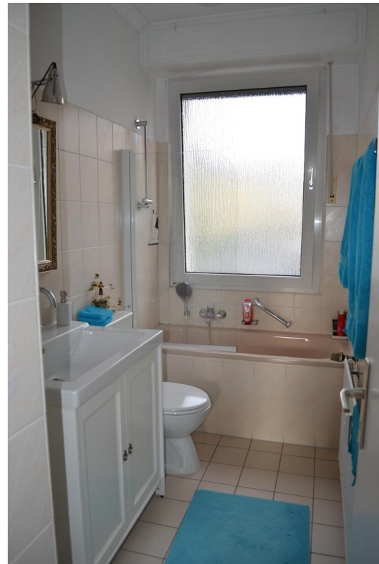
Badezimmer Wanne + Fenster