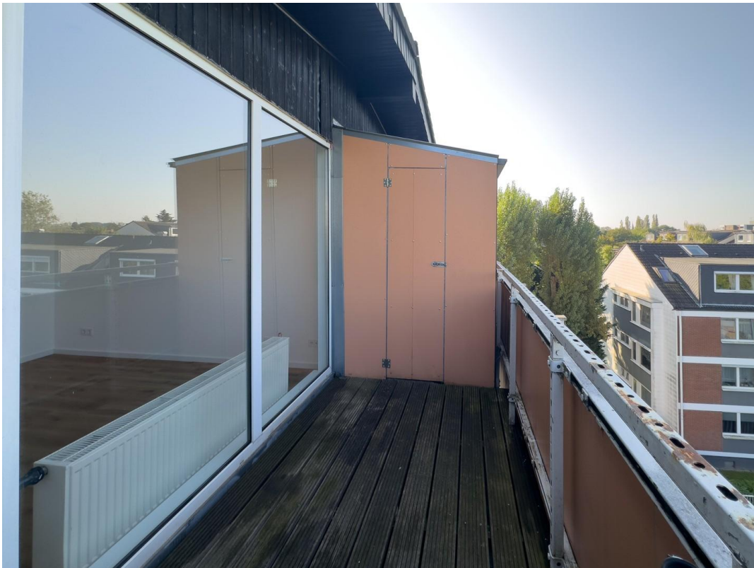
Balkon mit Stauraum