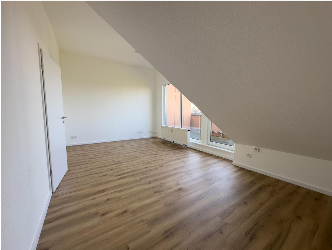
Viel Platz im Raum