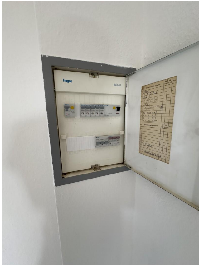
Neue Sicherungen und FI-Schalt