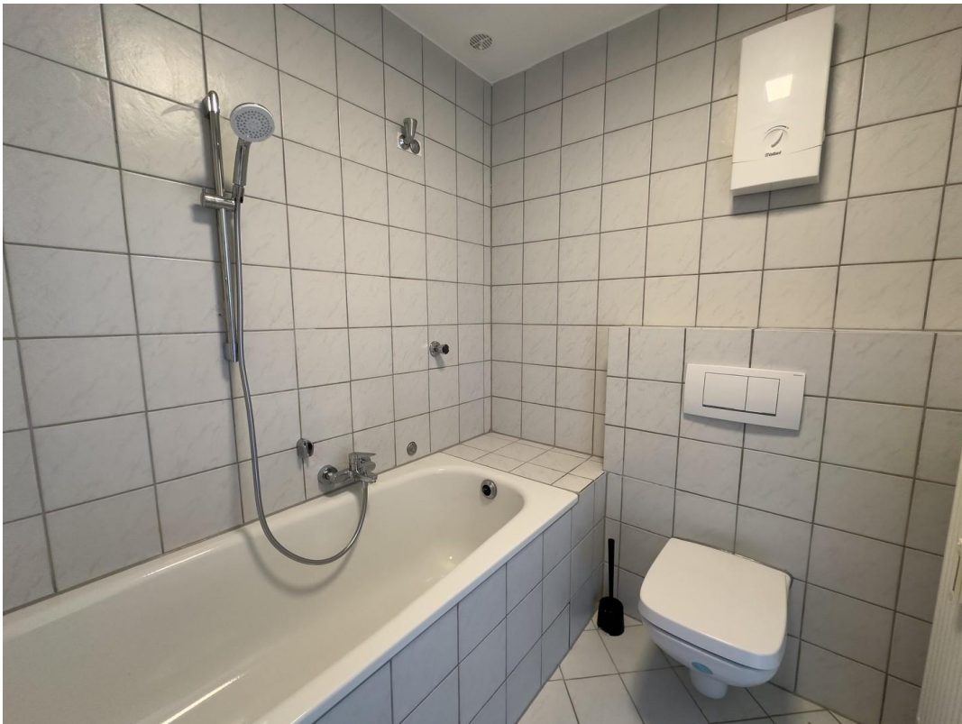
Neue Keramik im Bad