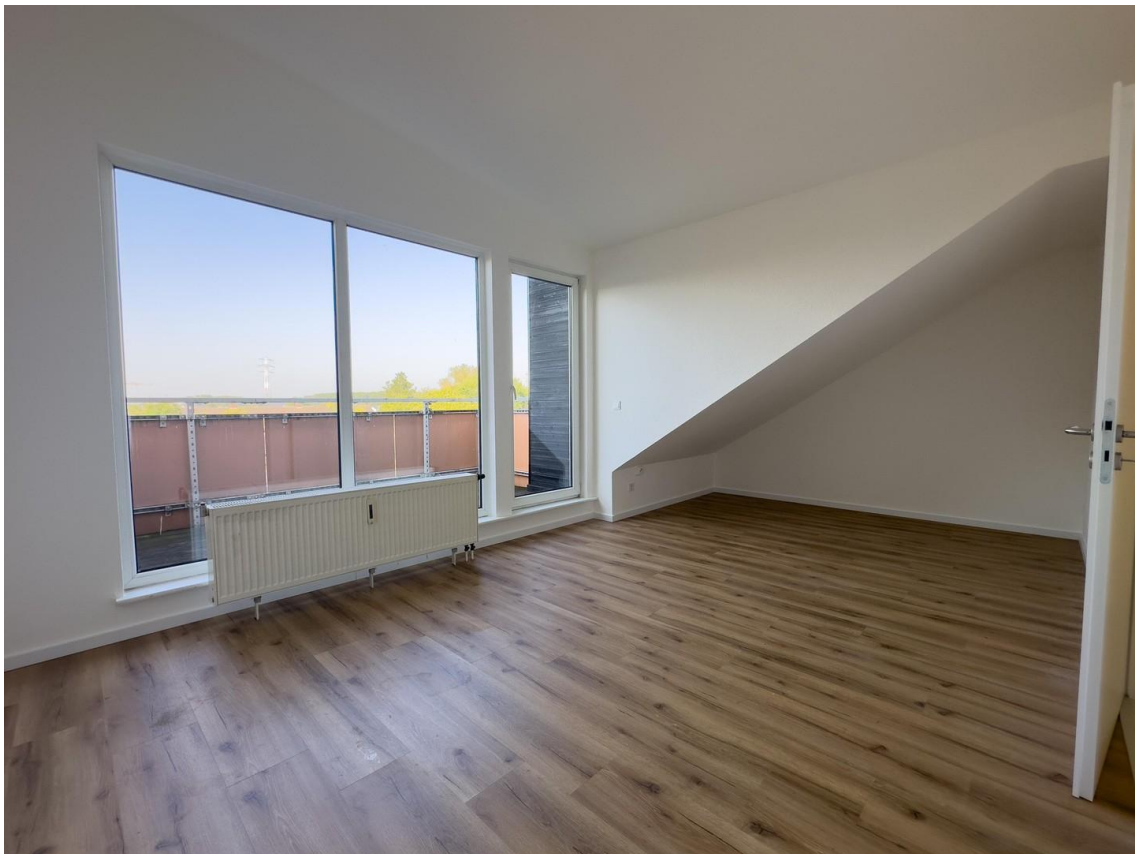
Wohnzimmer mit Weitblick