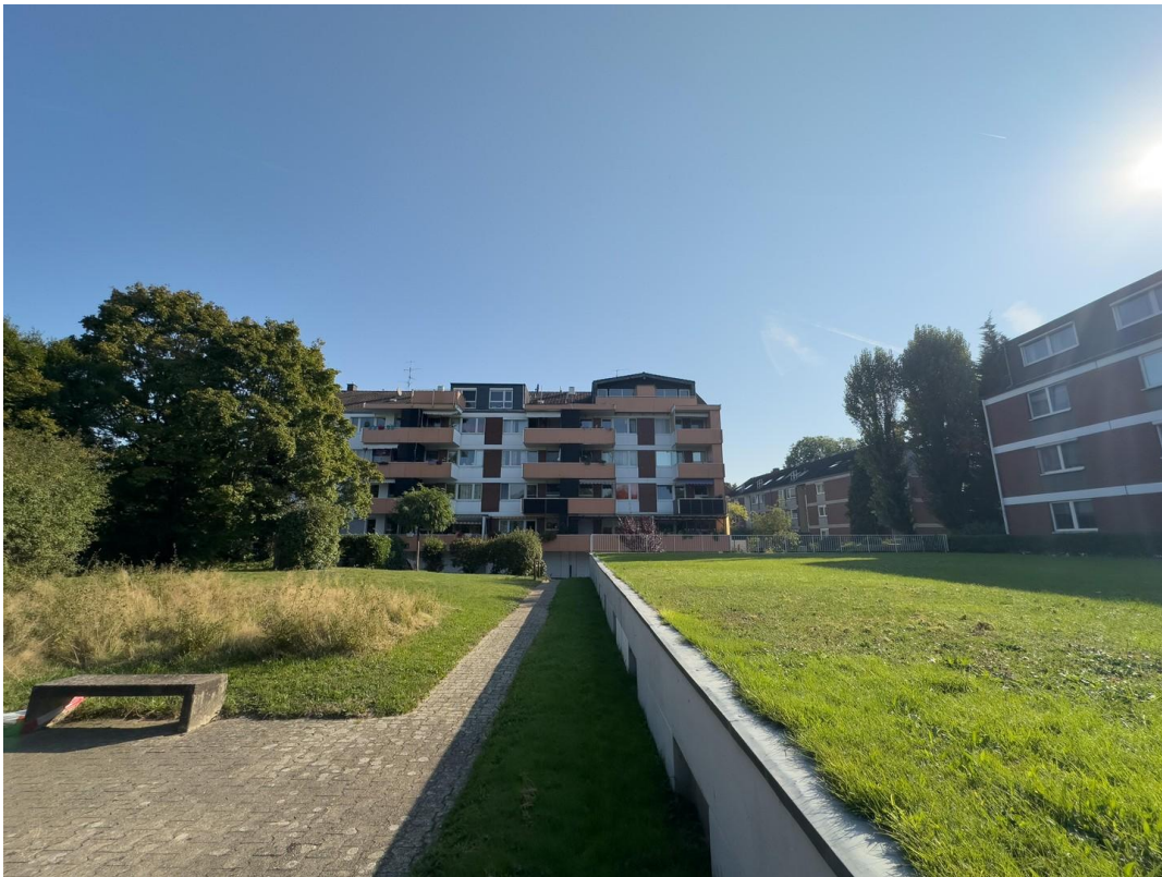
Haus auf großzügigem Grundstück