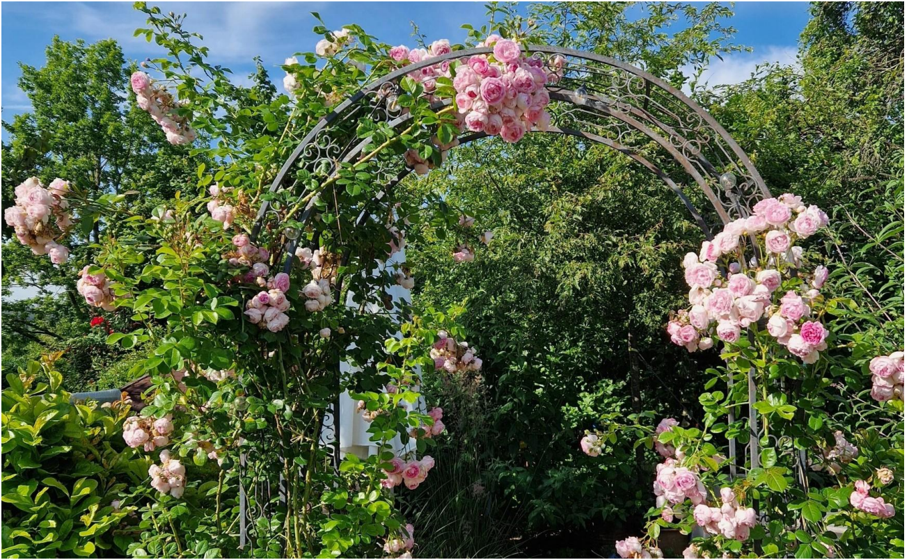
Rosenbogen bei Sitzplatz