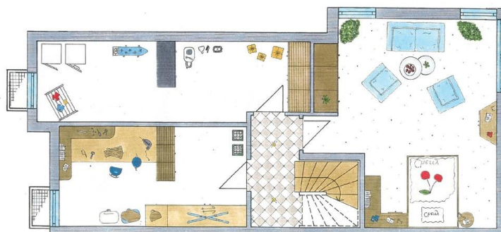
Untergeschoss / Keller