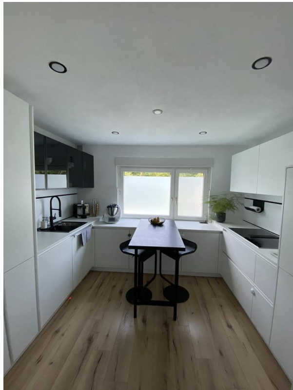
Moderne, zeitlose Küche