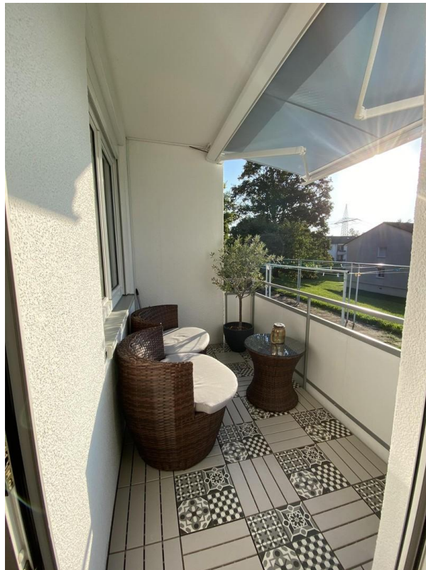
Balkon zur Südseite