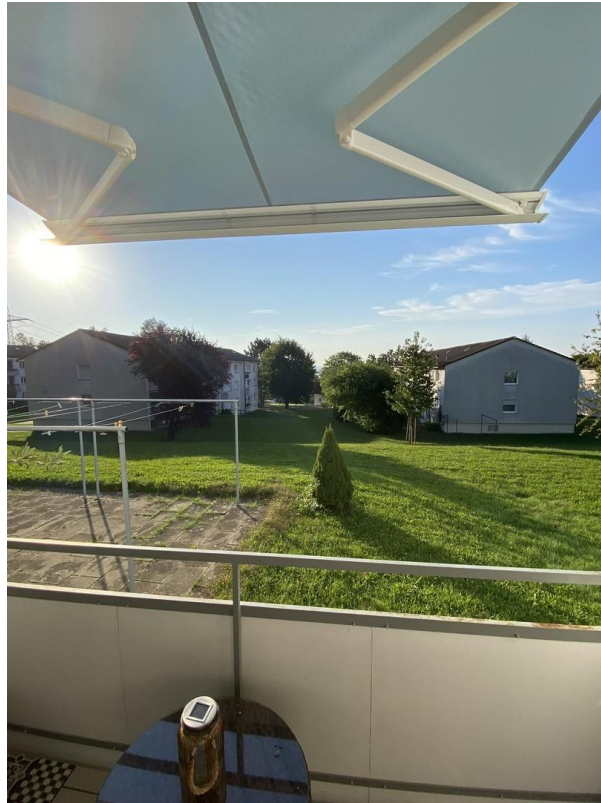
Aussicht vom Balkon