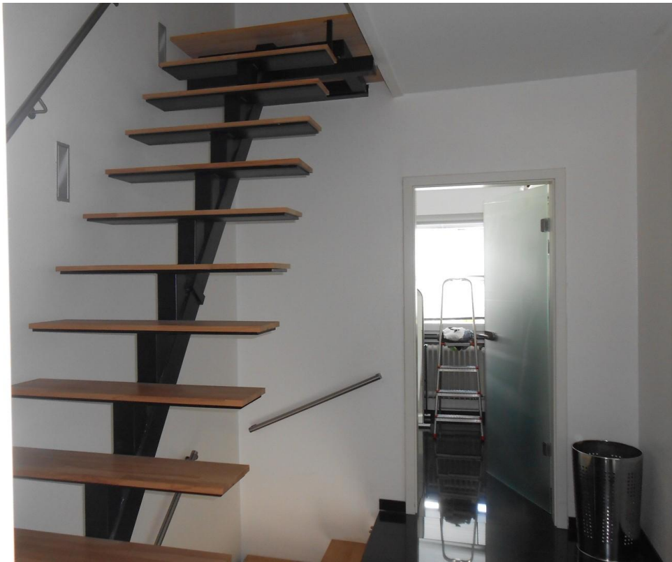
Treppe zum DG