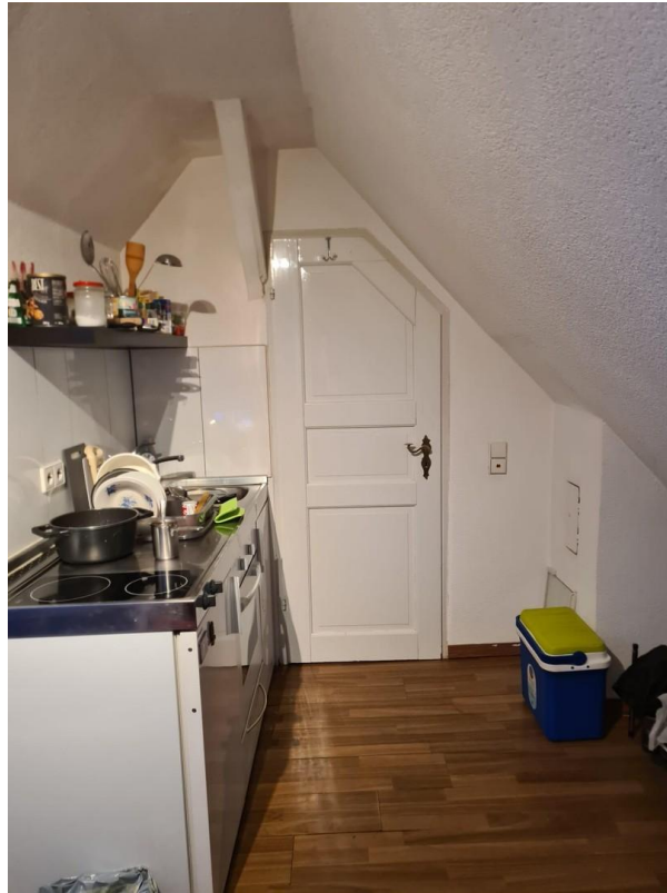
Türe zum Bad