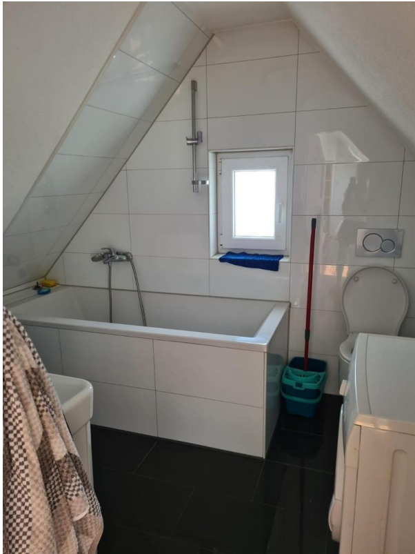
Bad mit Badewanne und WC