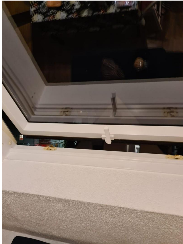
Zwei große Dachfenster