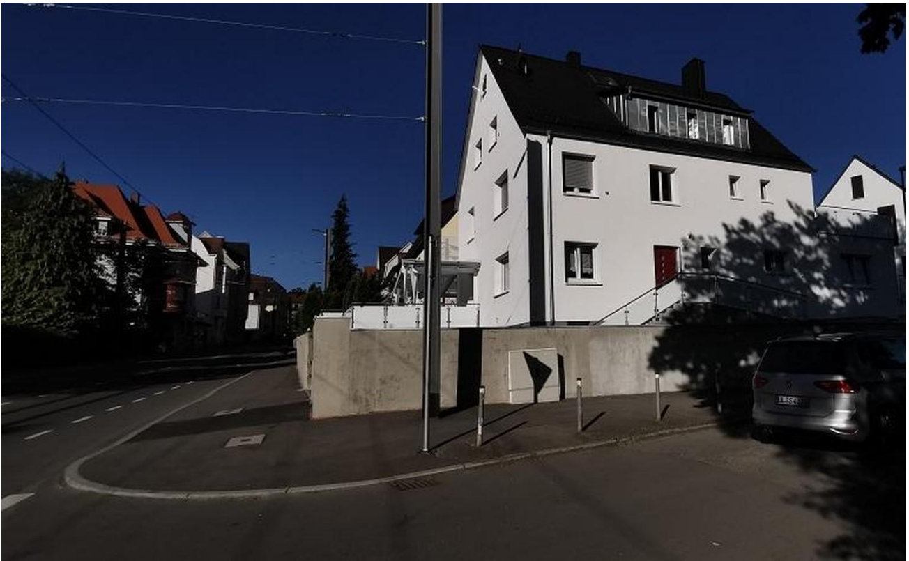
Hausansicht vom Weißenburgweg