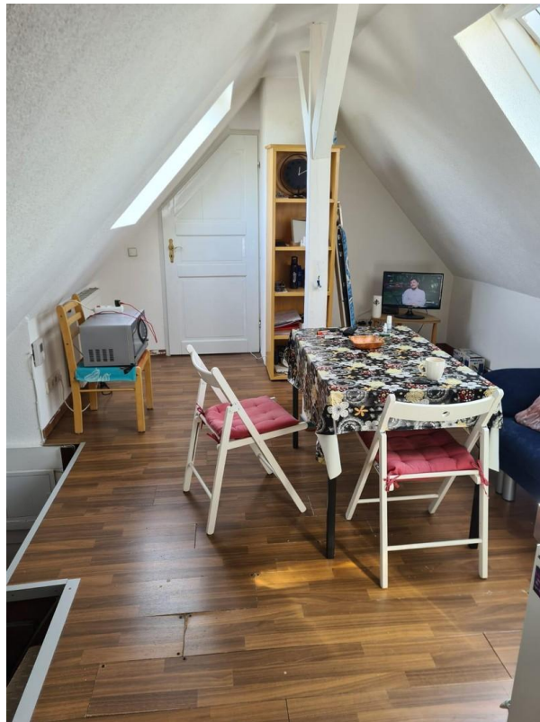
Küche wohn essbereich