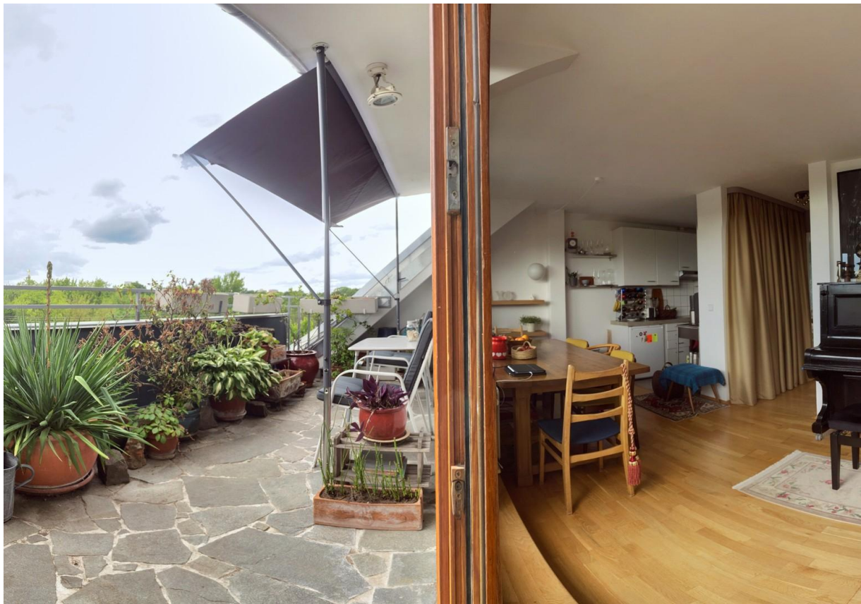
Innen+Außen / Inside+Outside