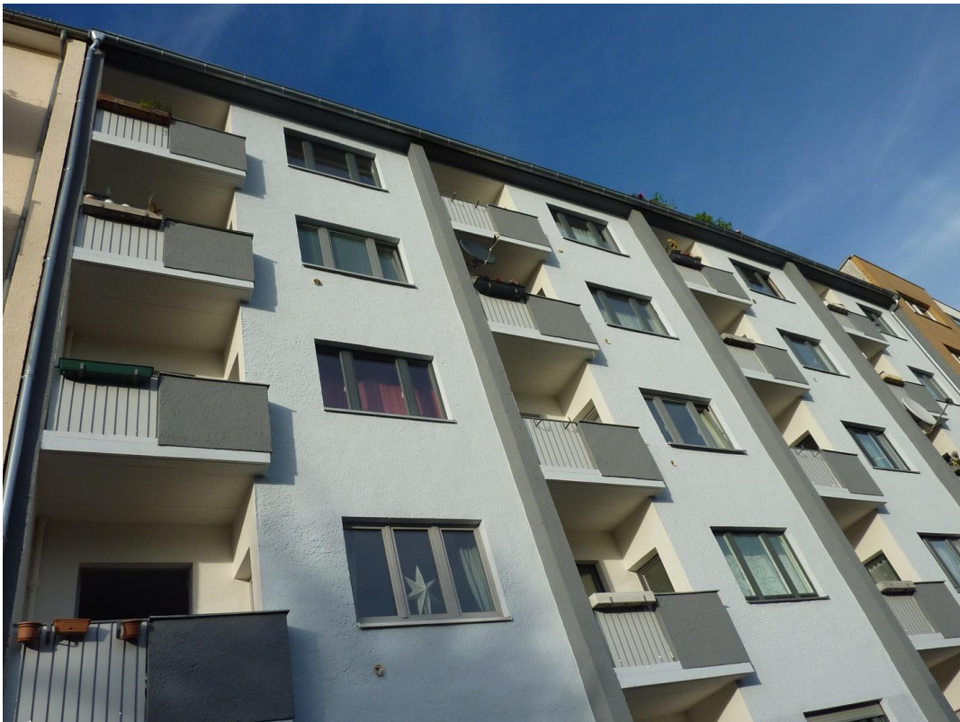
Hausfassade / Building Front