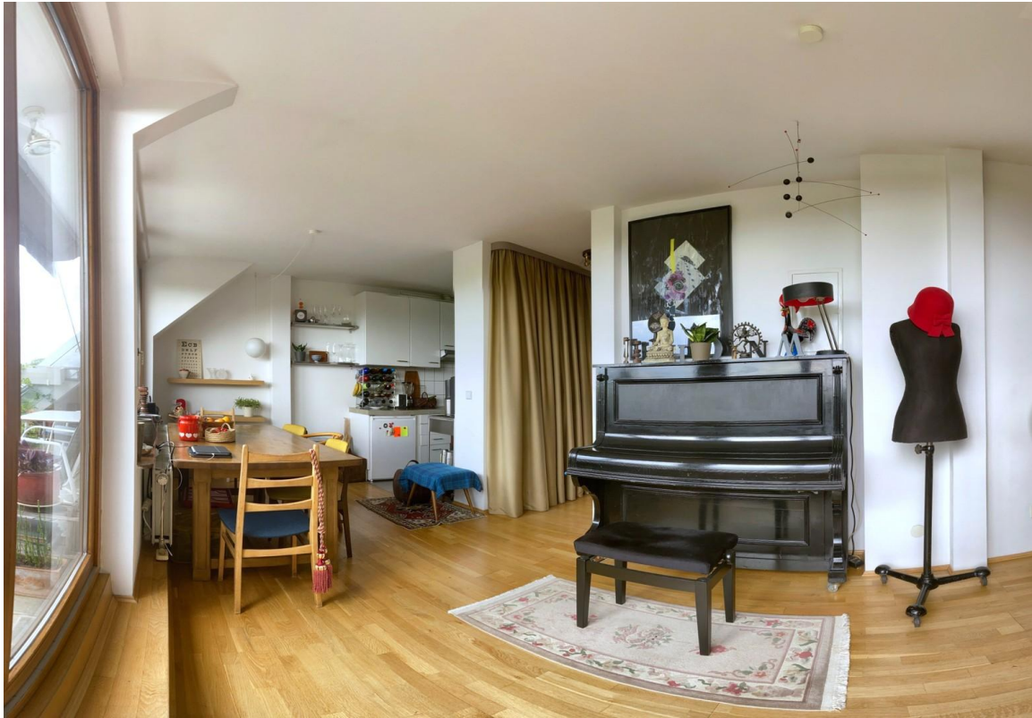
Klavier / Piano