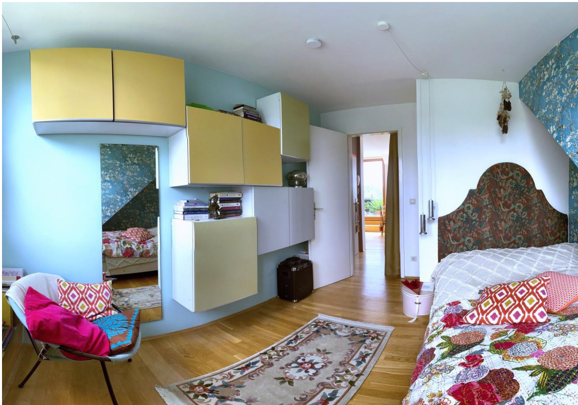
Schlafzimmer / Bedroom