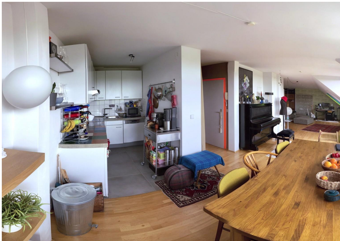
Küche / Kitchen