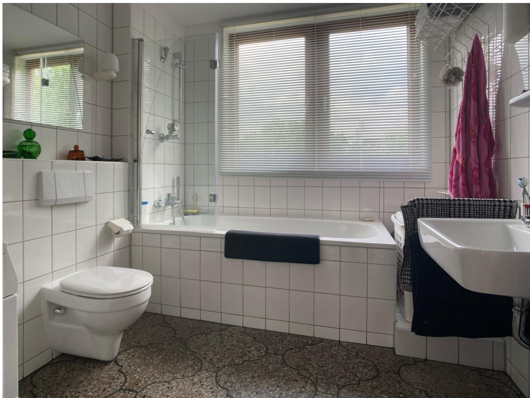
Bad / Bathroom