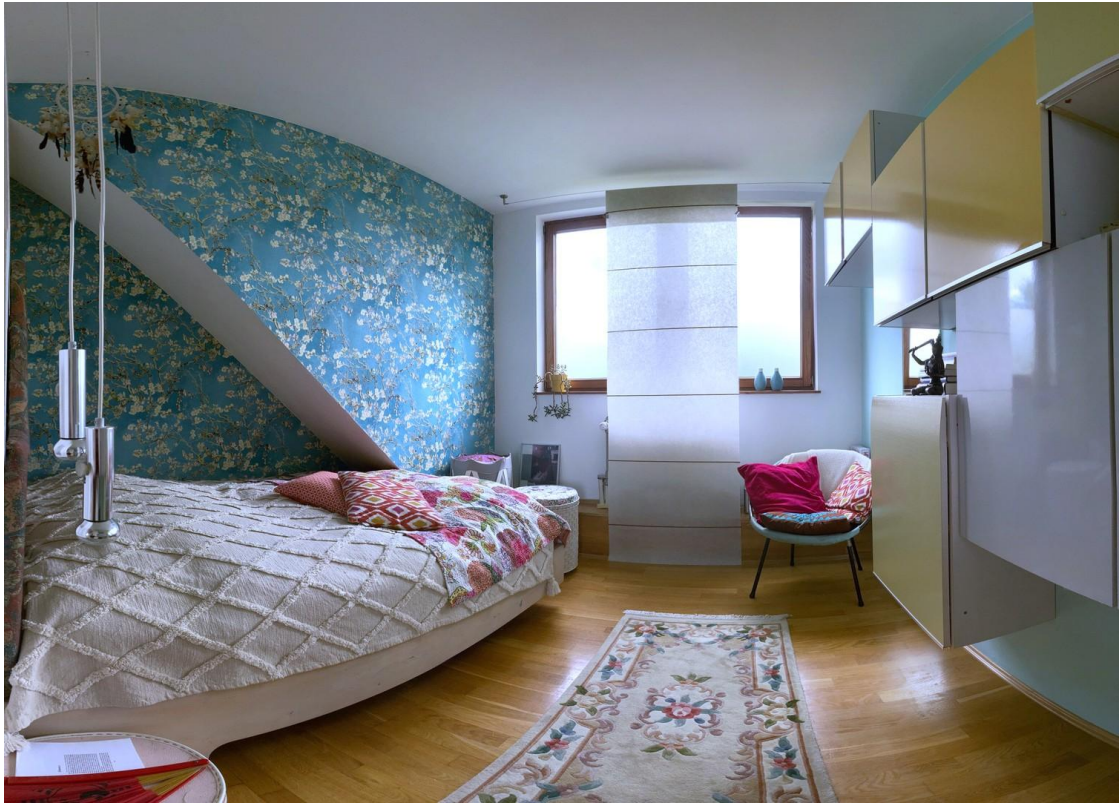
Schlafzimmer / Bedroom