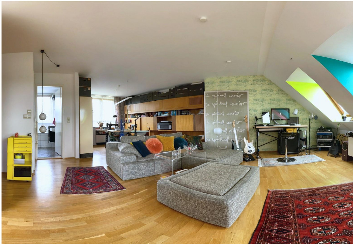
Wohnbereich / Living Area