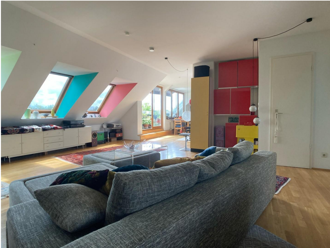
Wohnbereich / Living Area