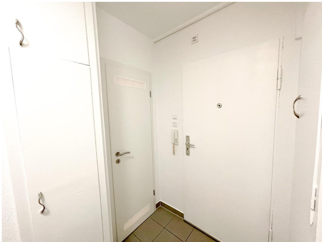
Flur, Haustür, Badtür