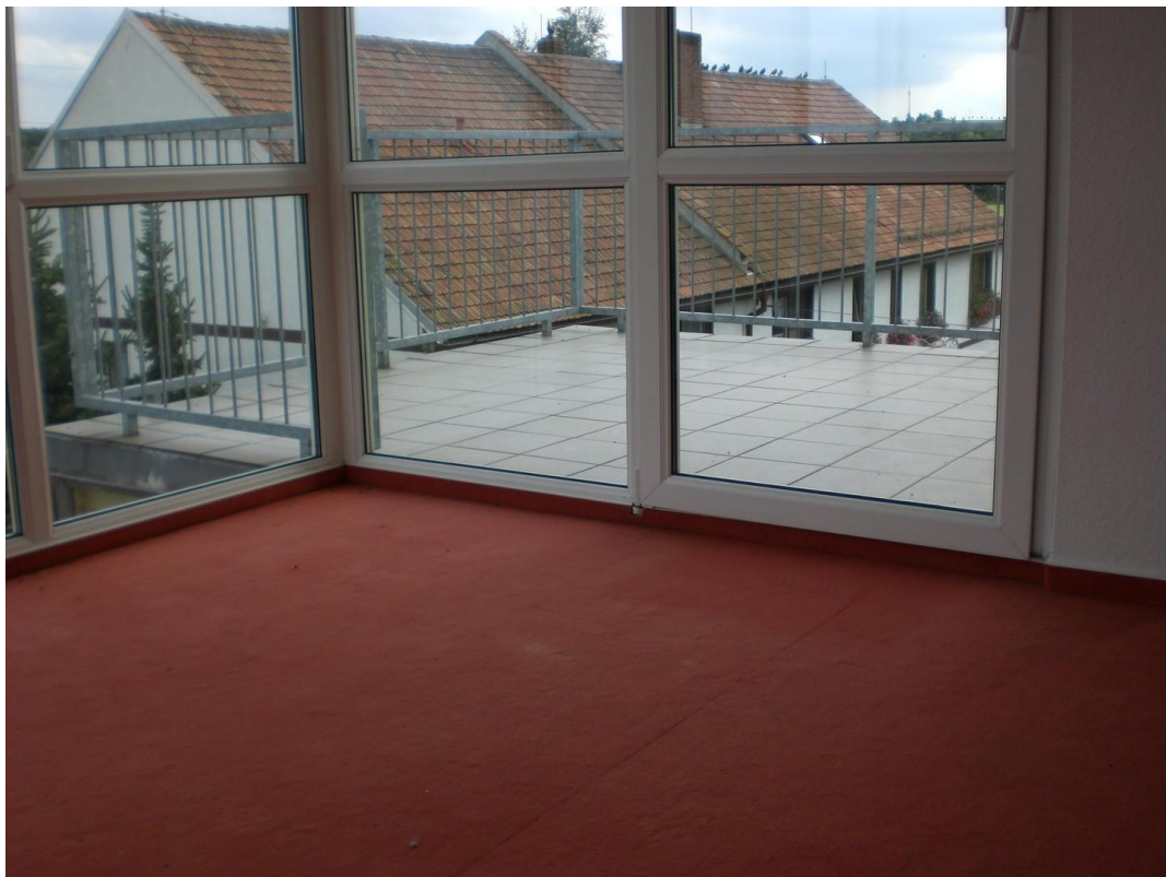
Wohnzimmer mit Blick raus