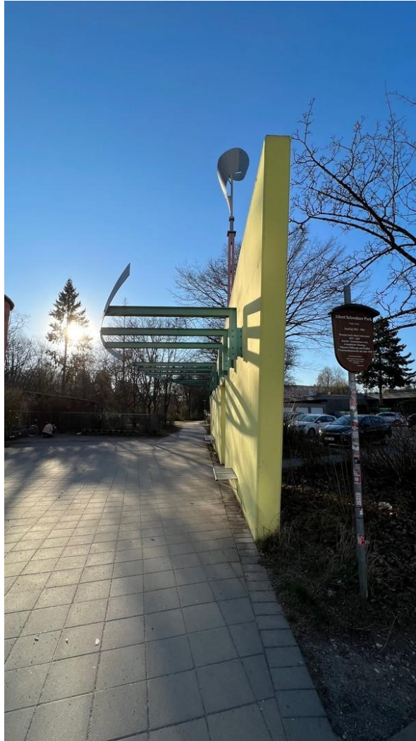
Albert Schweizer Park