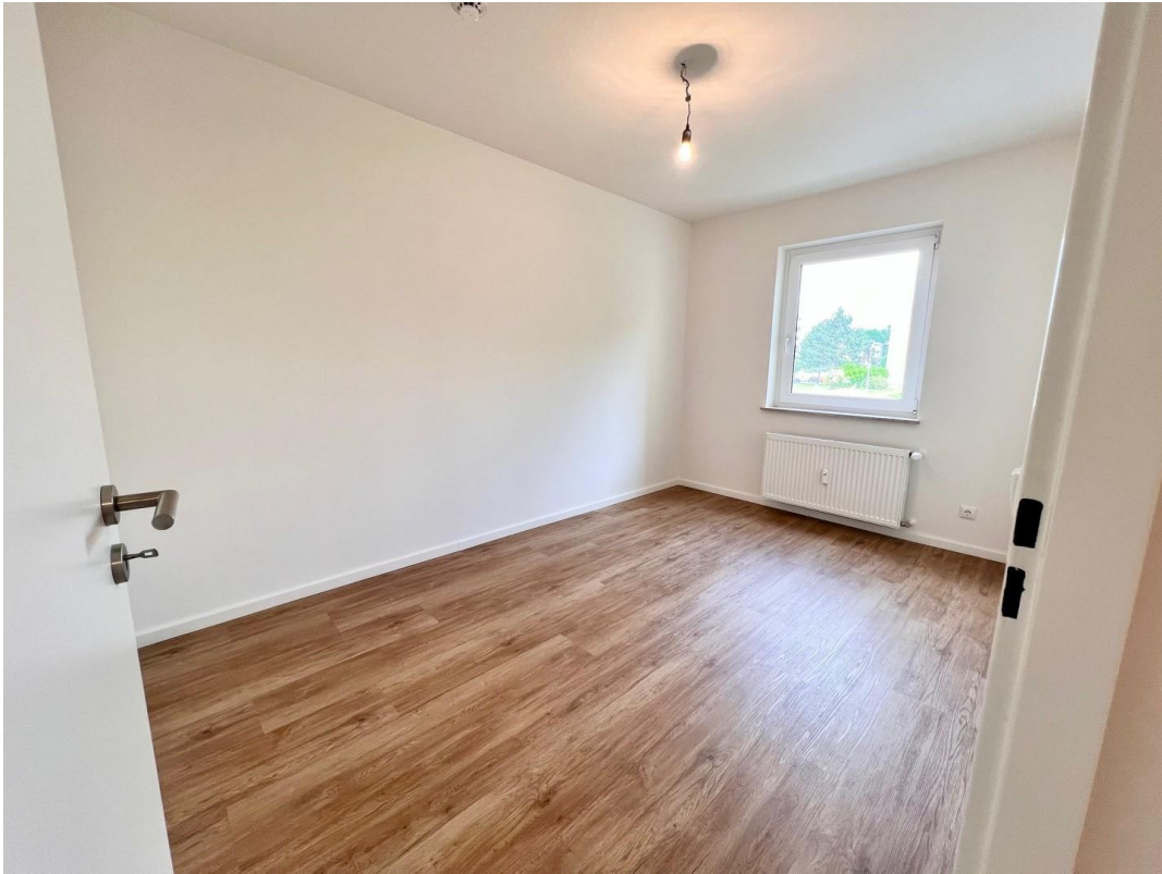
Büro / Kind