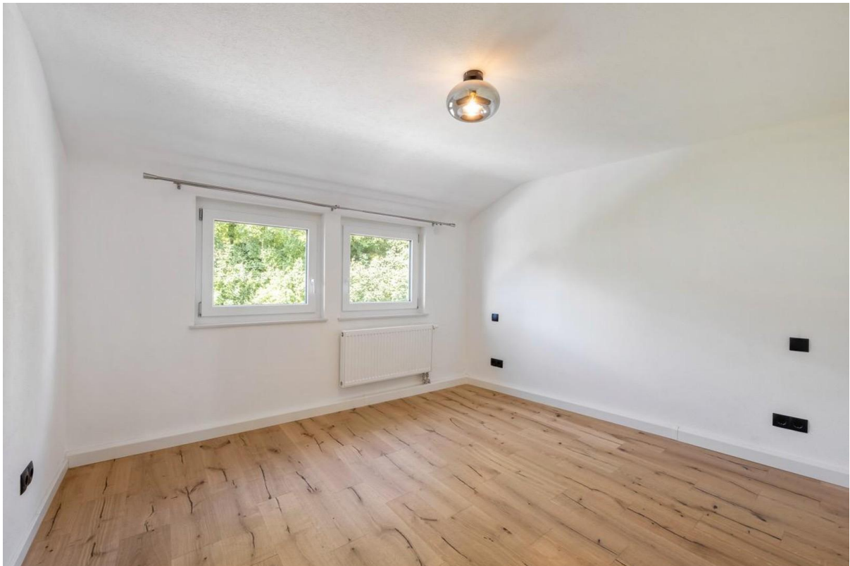
Kinder- oder Arbeitszimmer