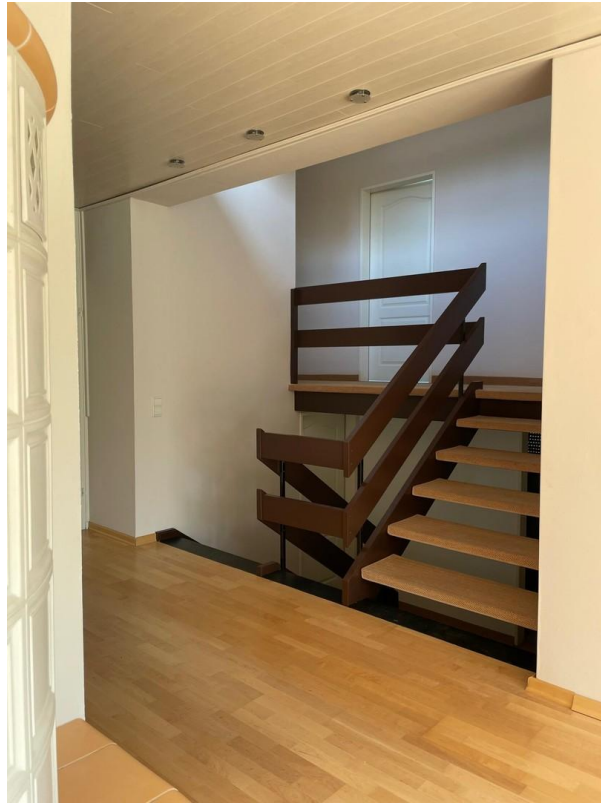
Übergang Wohnzimmer 1.OG