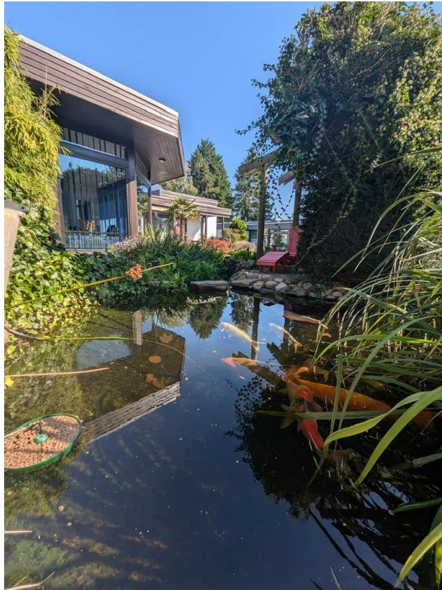
Garten m. Teichlandschaft