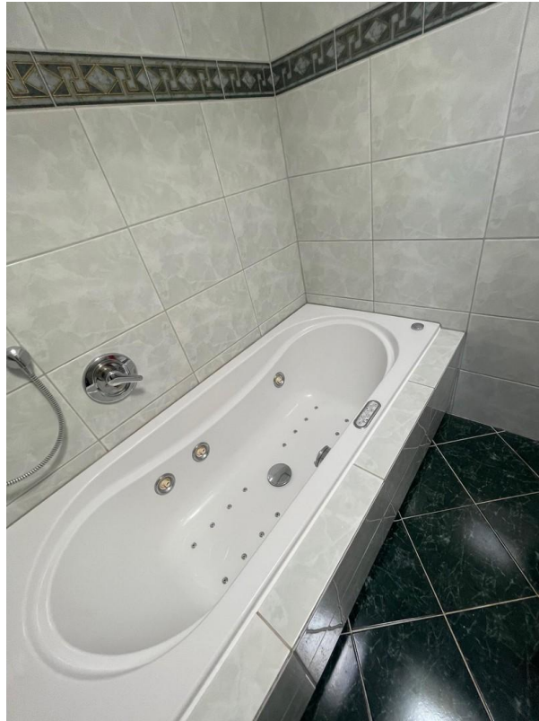
Whirlpool - Badewanne