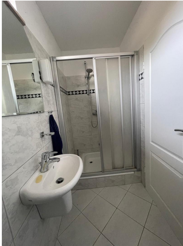
2. Dusche m. WC