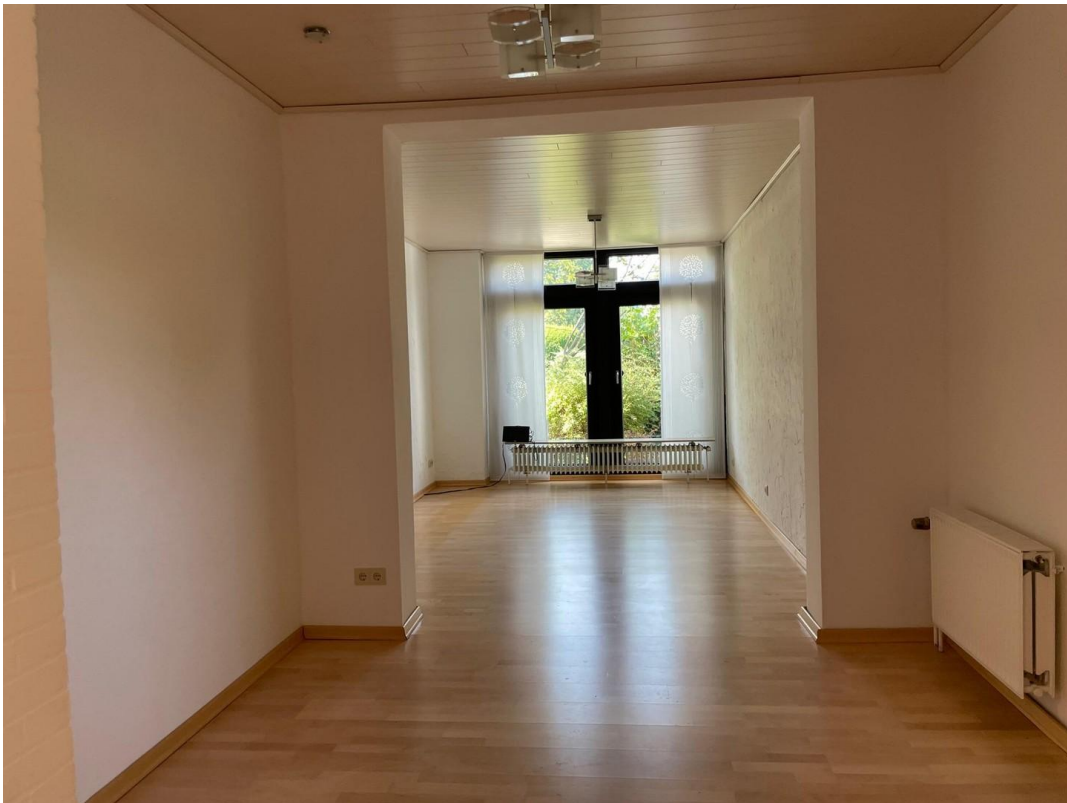
Esszimmer m. Vorzimmer