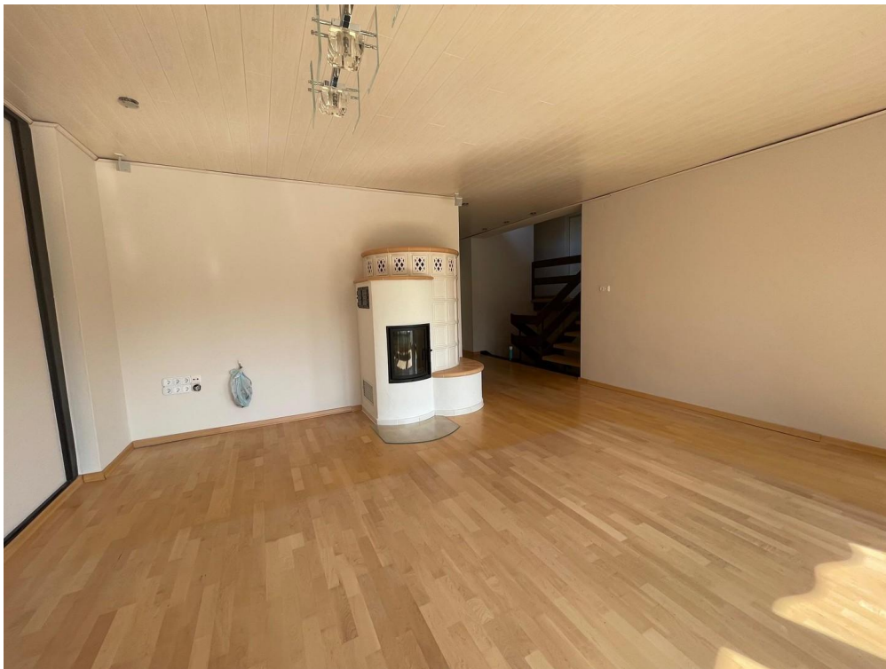
Wohnzimmer m. wasserfüh. Ofen