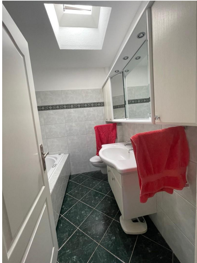
3. Bad m . WC