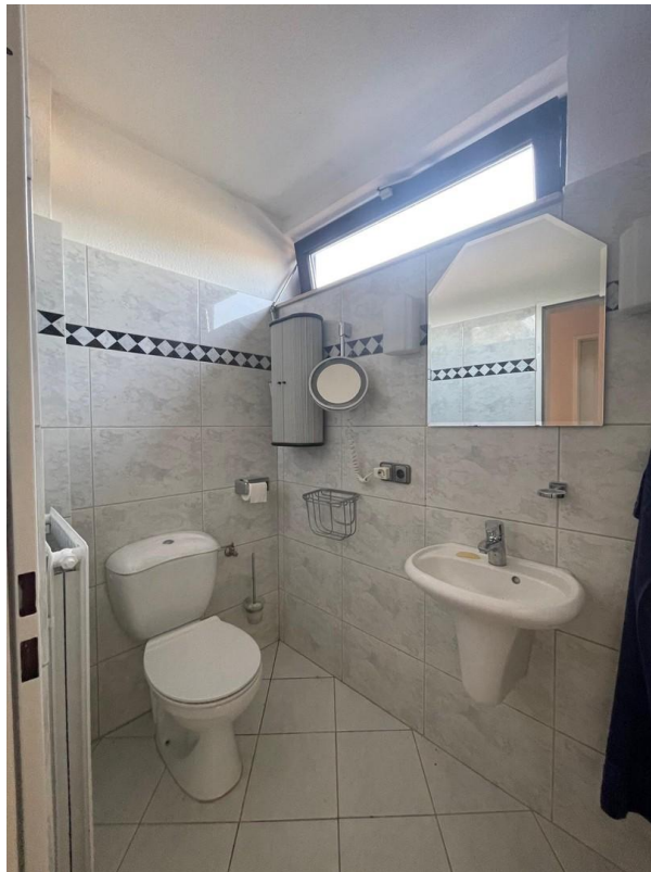
2. Dusche m. WC