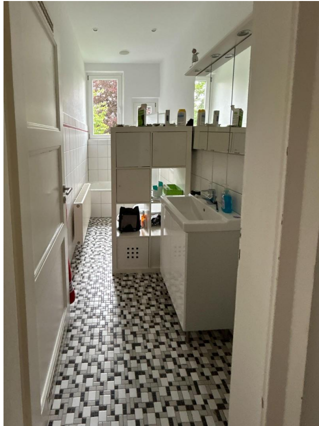
Bad 1. OG