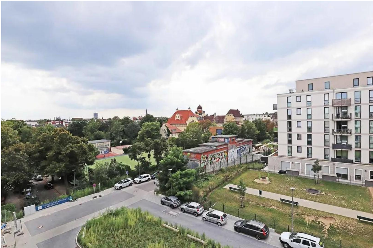
Ausblick vom Balkon