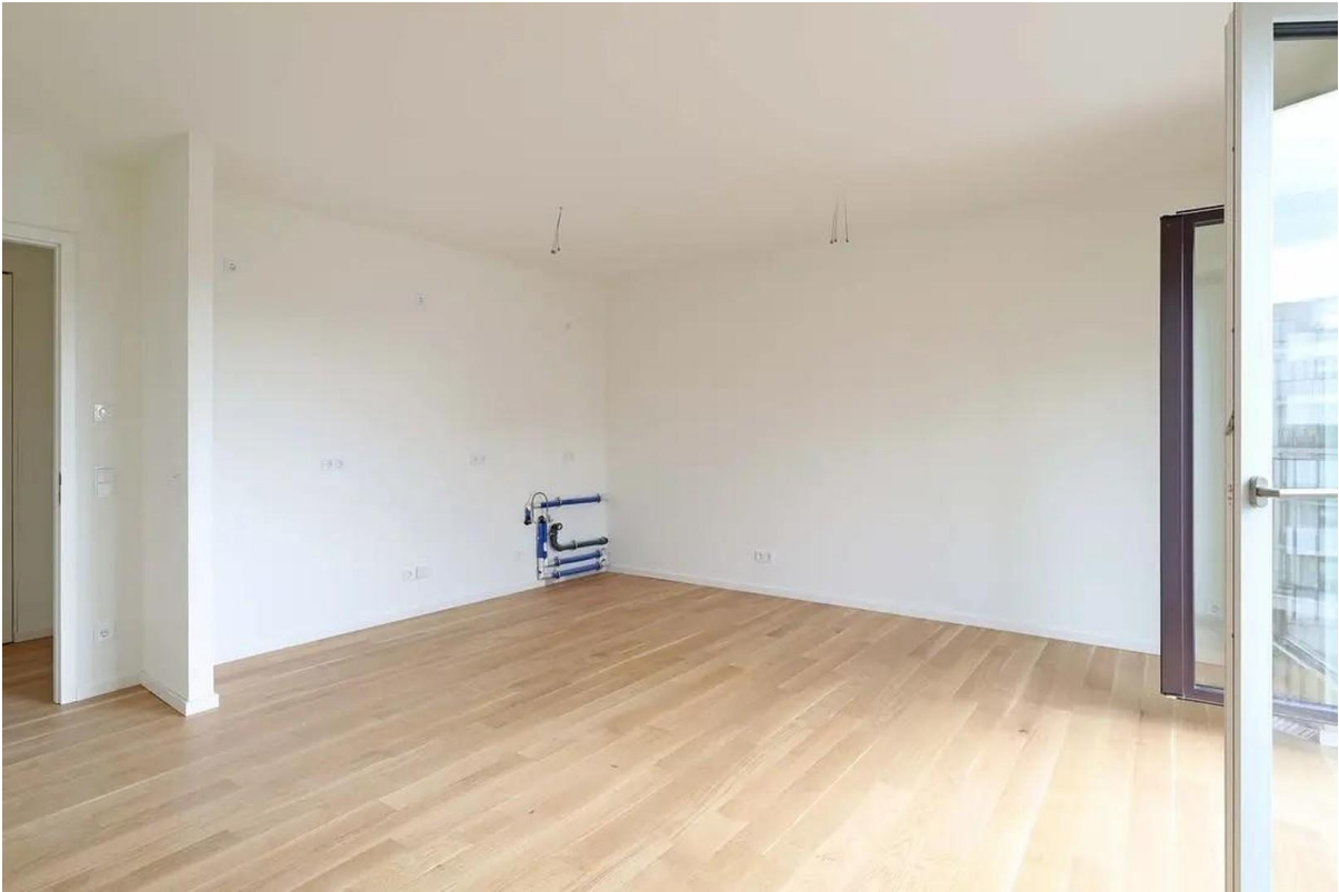
Wohnzimmer mit Küche