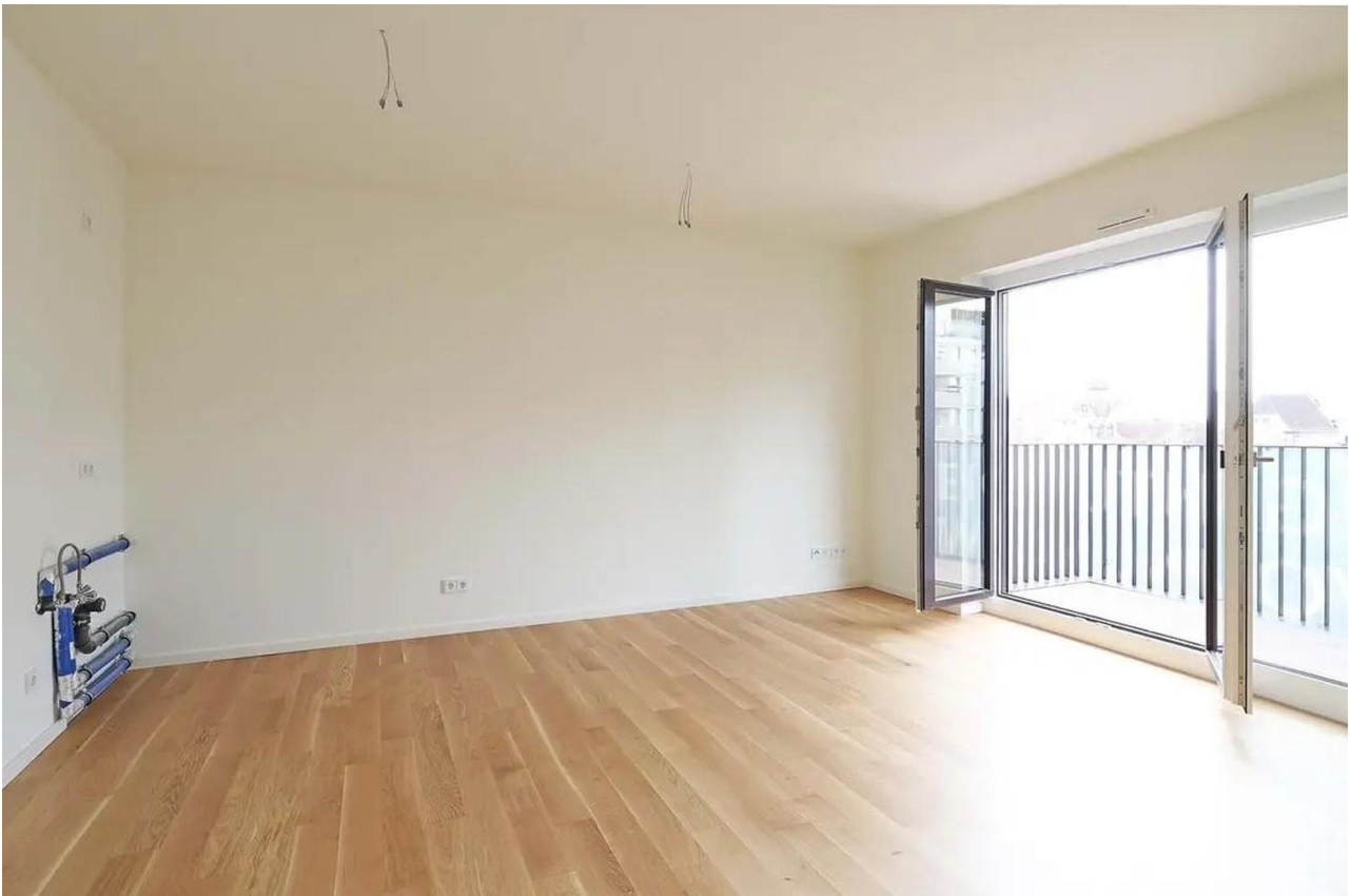
Wohnzimmer mit Küche