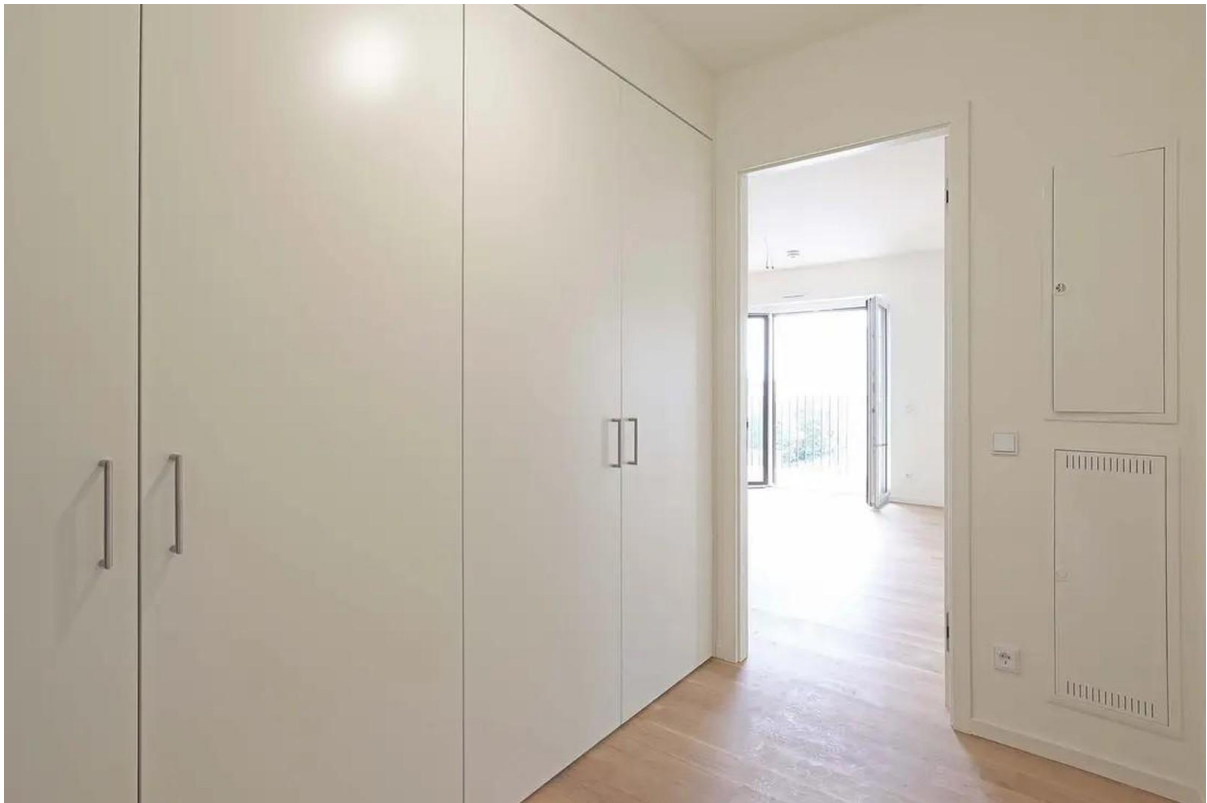
Flur mit Einbauschränk