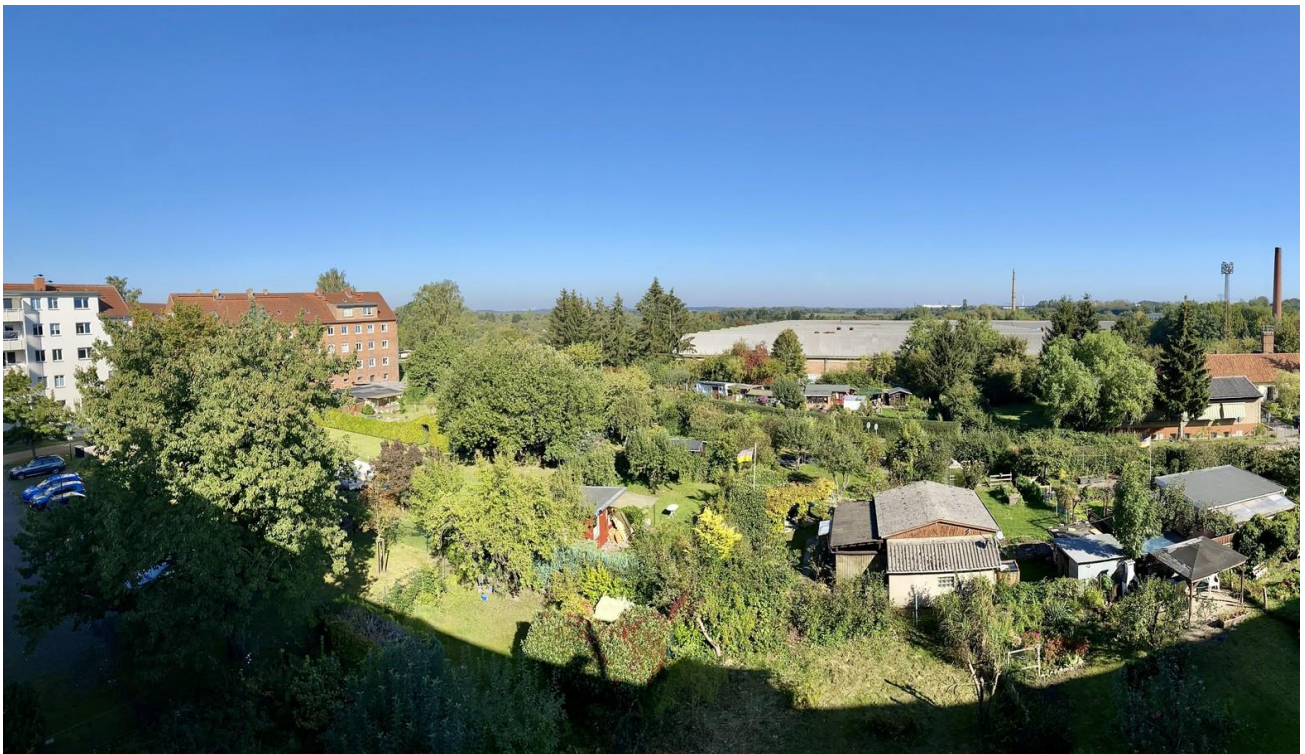
Blick in den Garten