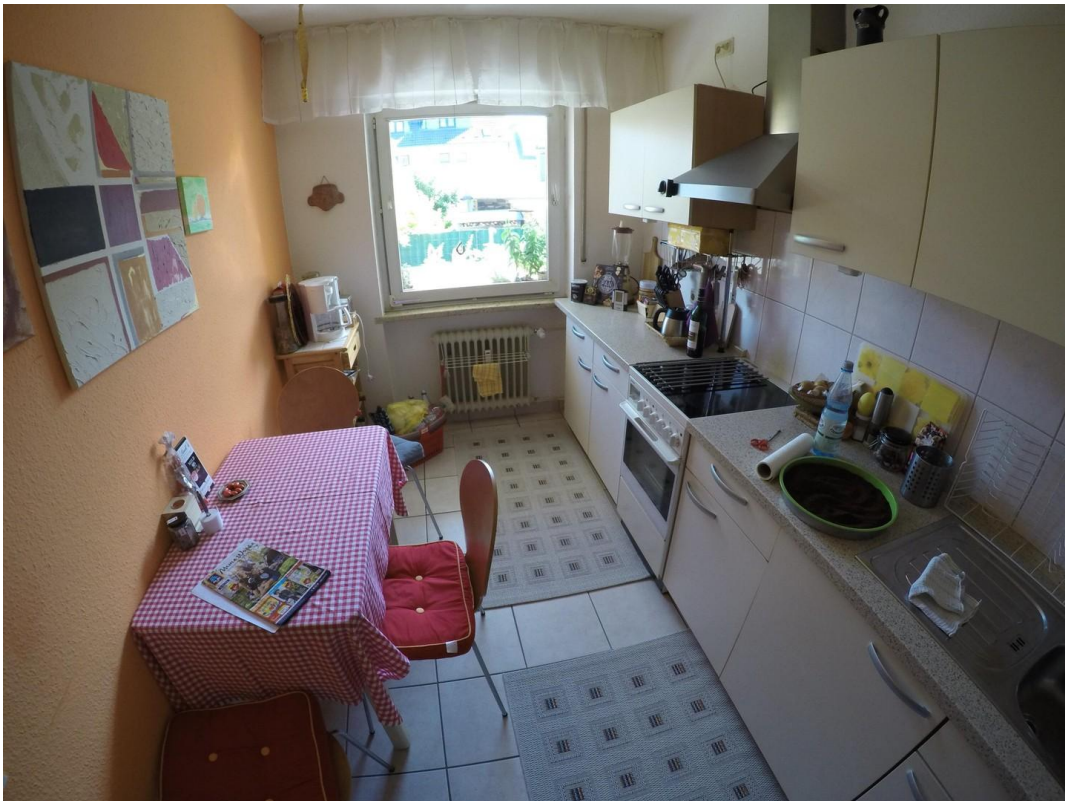
Küche mit Essplatz