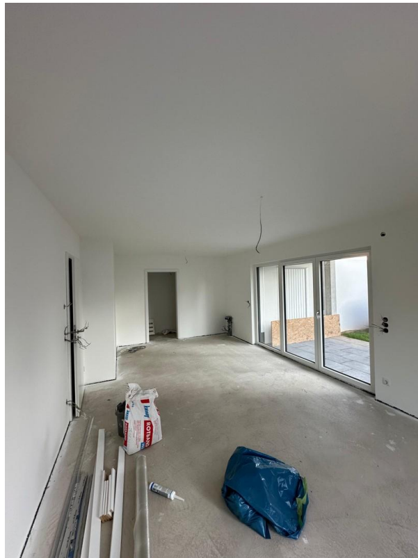
Küche mit Wohn/Essbereich