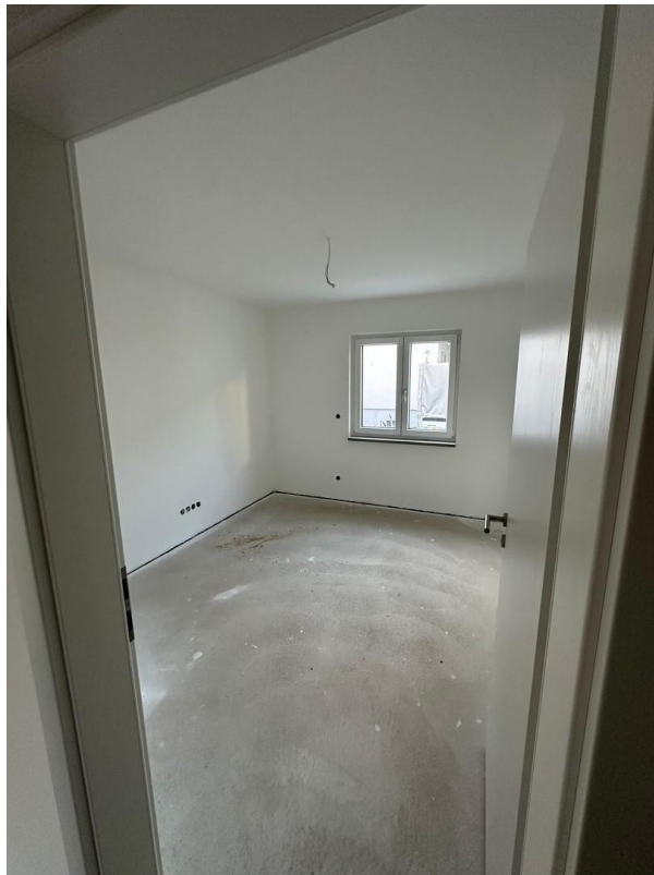
Zimmer zum Garten