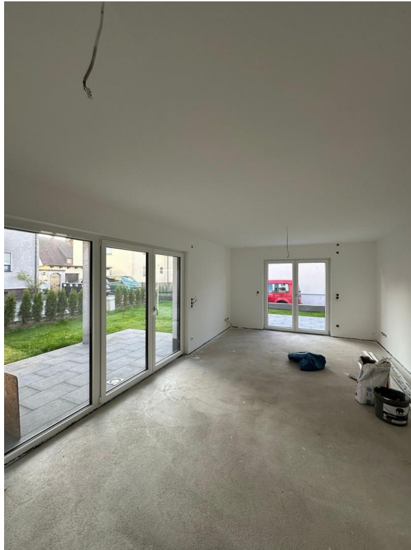
Küche mit Wohn/Essbereich