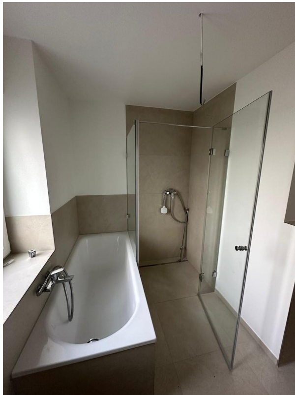
Dusche und Badewanne