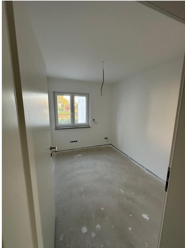
Zimmer Richtung Straße