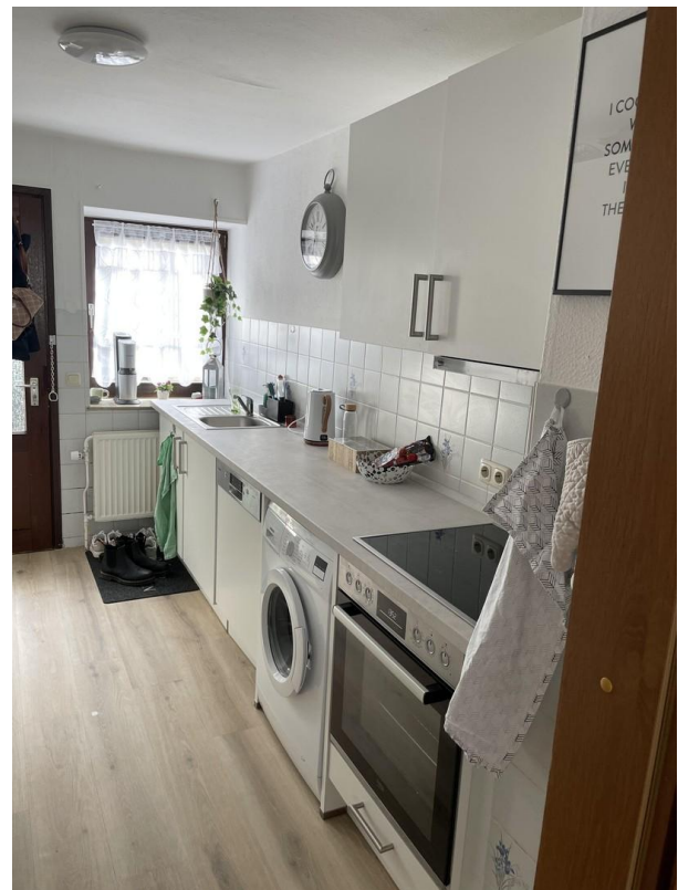
Küche N16 unten rechts