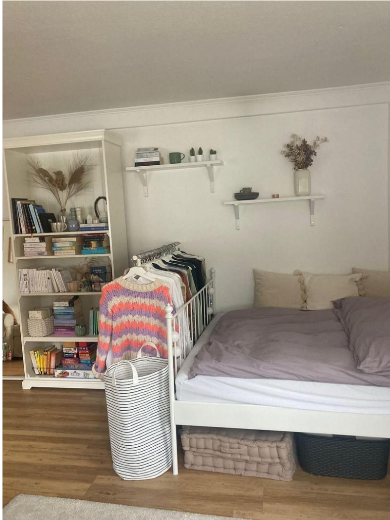
Zimmer 2 N16 oben