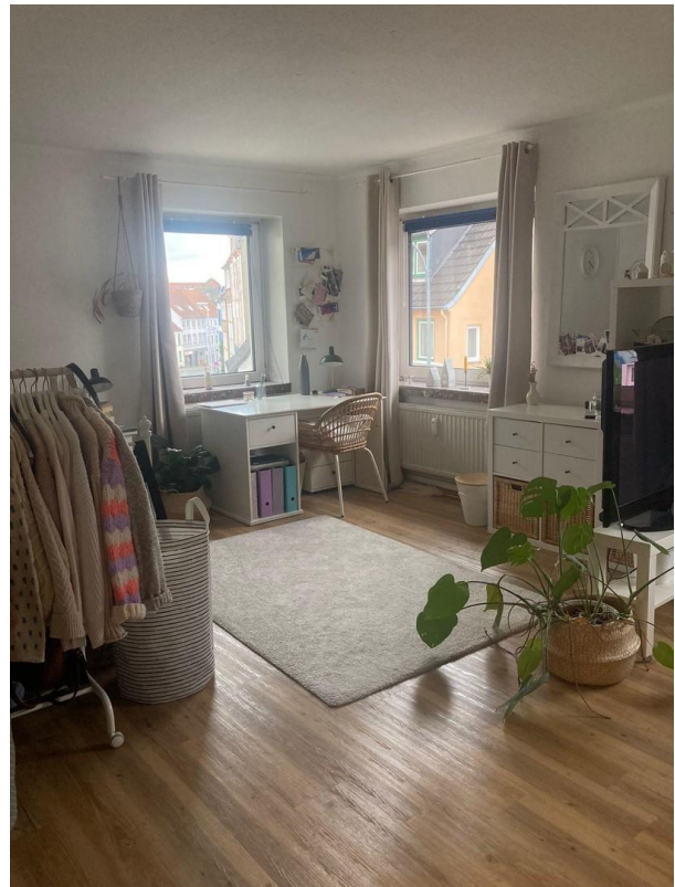
Zimmer 2 N16 oben