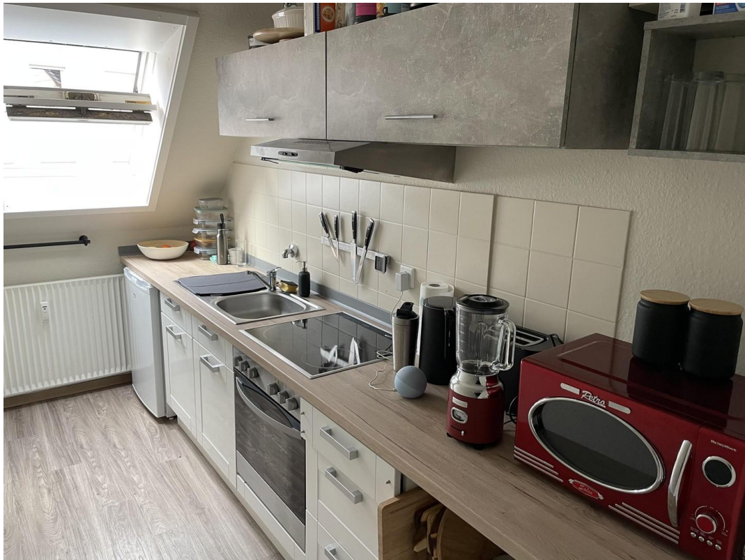
Küche N14 oben