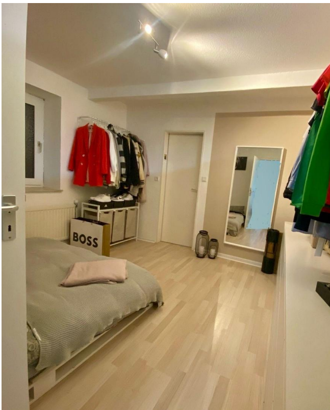
Schlafzimmer N16 unten links