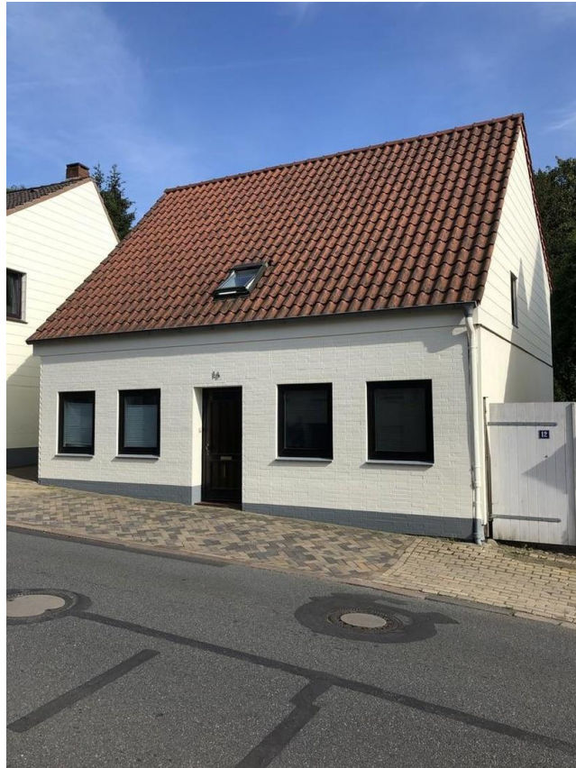
Ansicht Nr 14