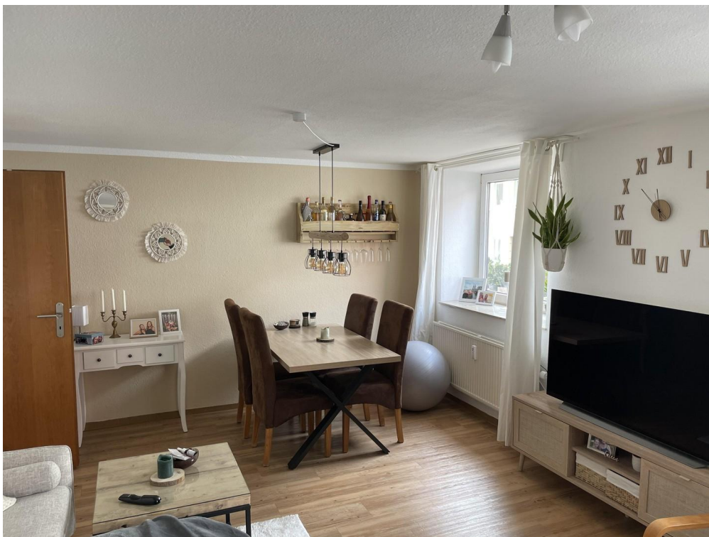
Wohnzimmer N16 unten links