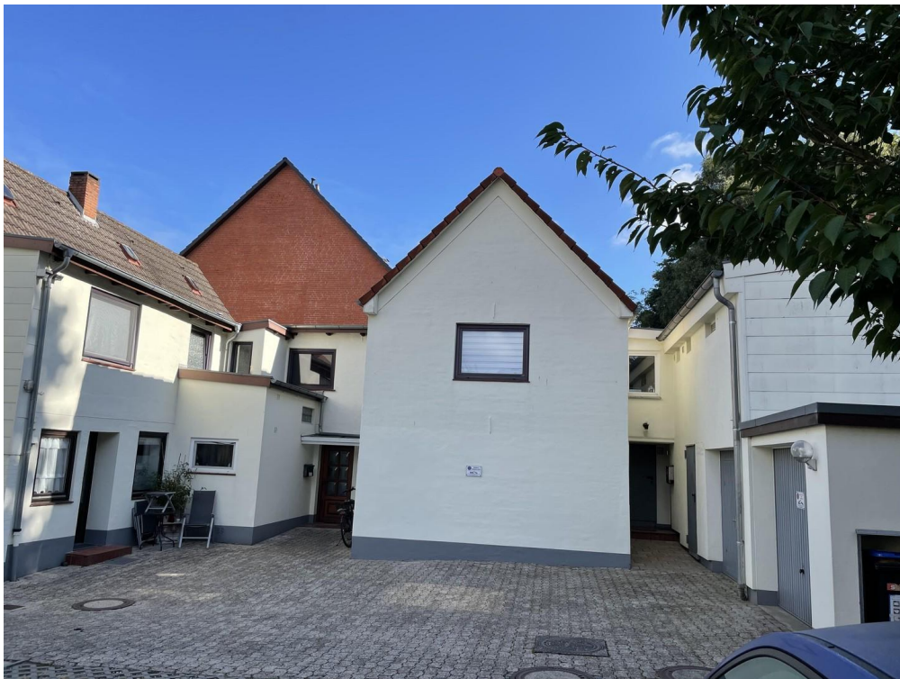
Mittelhaus im Hof