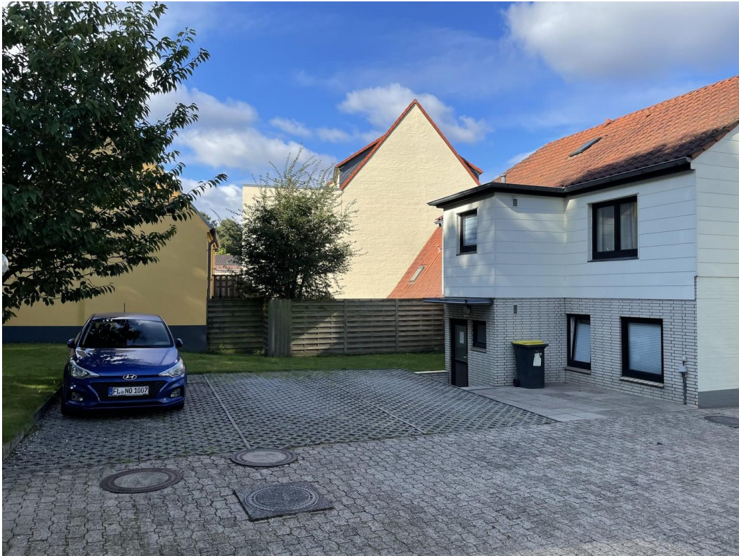
Ansicht auf die Stellplätze