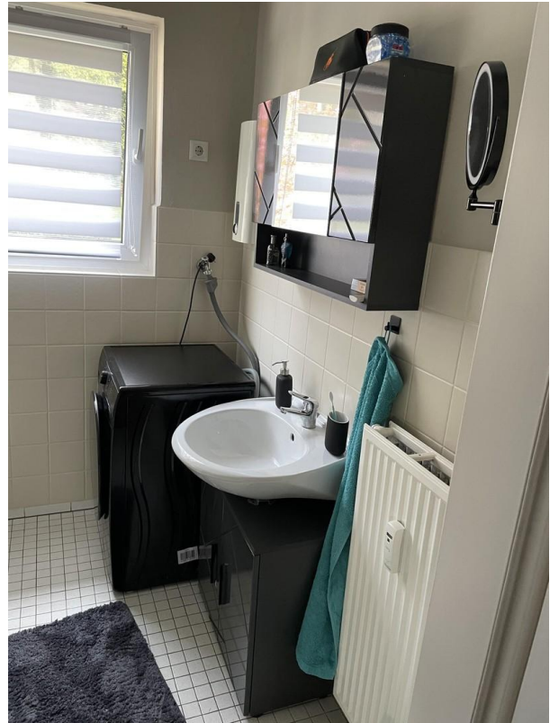
Bad N14 oben