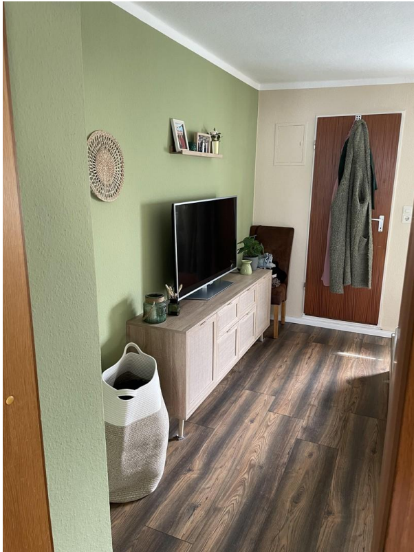
Schlafzimmer N16 unten links