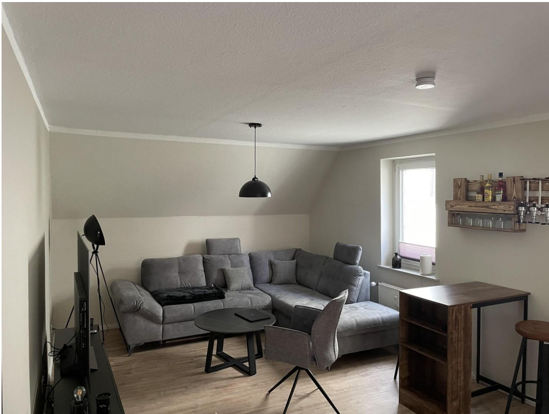
Wohnzimmer N14 oben