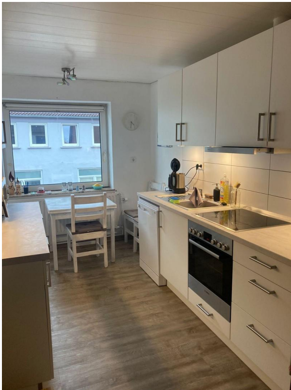
Küche N16 oben