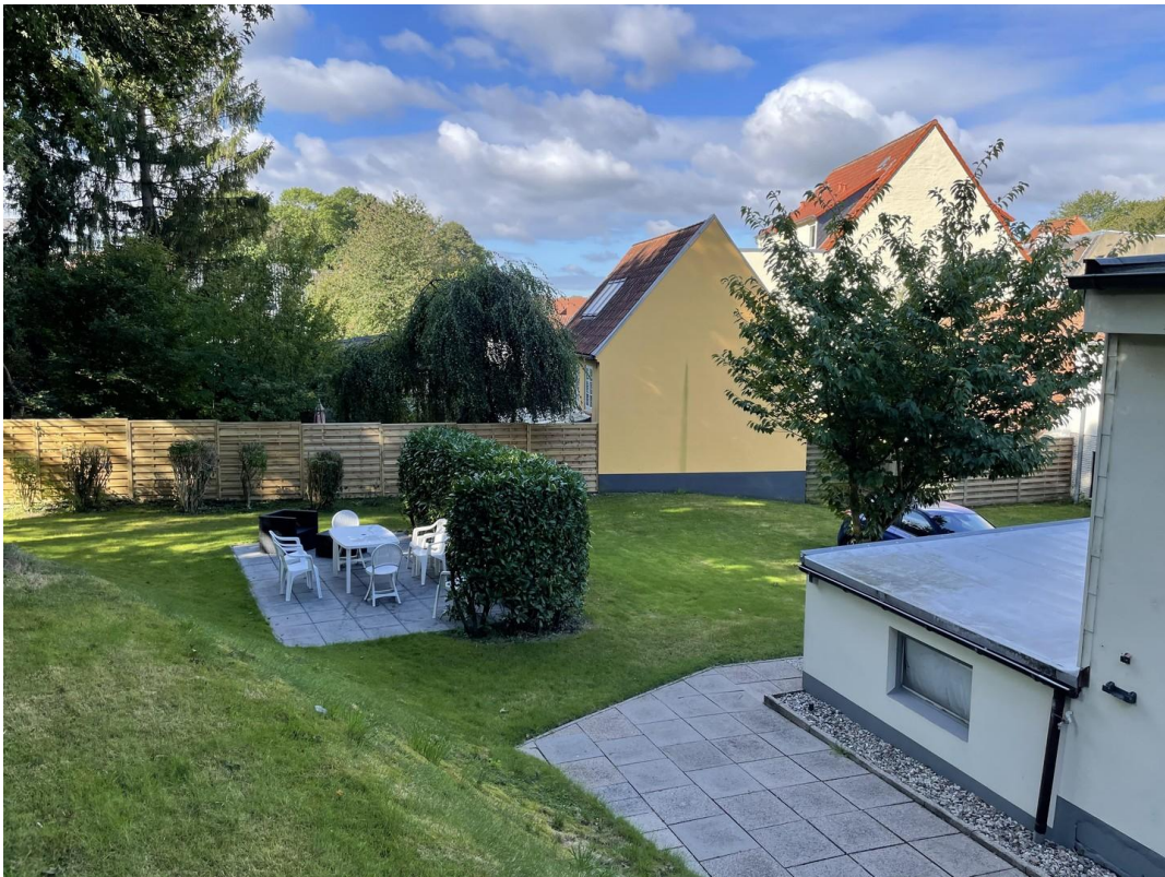
Blick auf die Terrasse