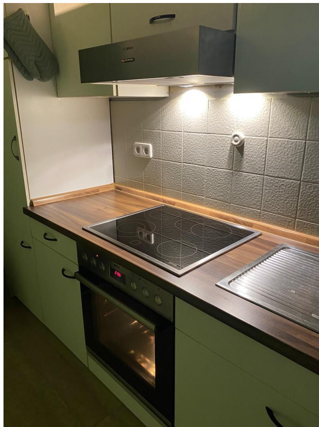
Küche N16 unten links