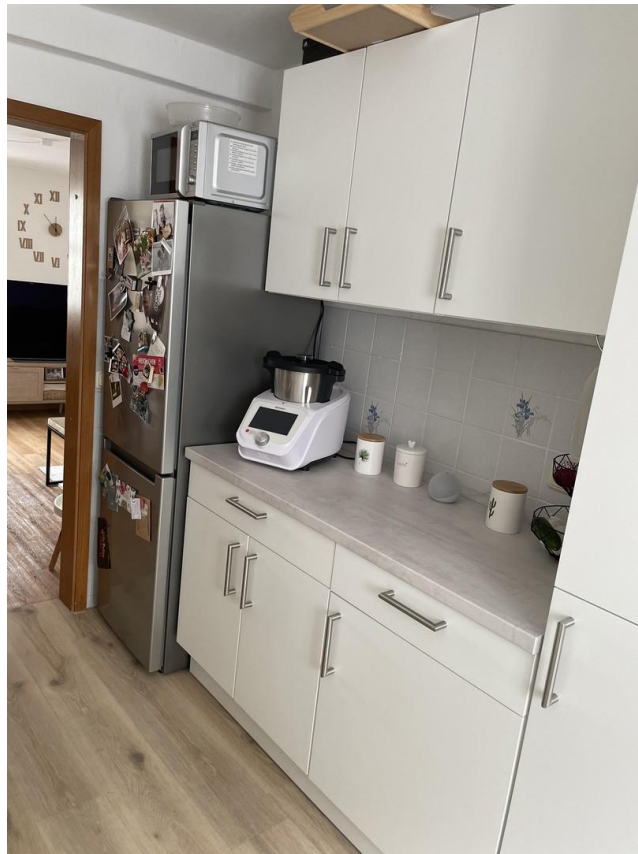
Küche N16 unten links