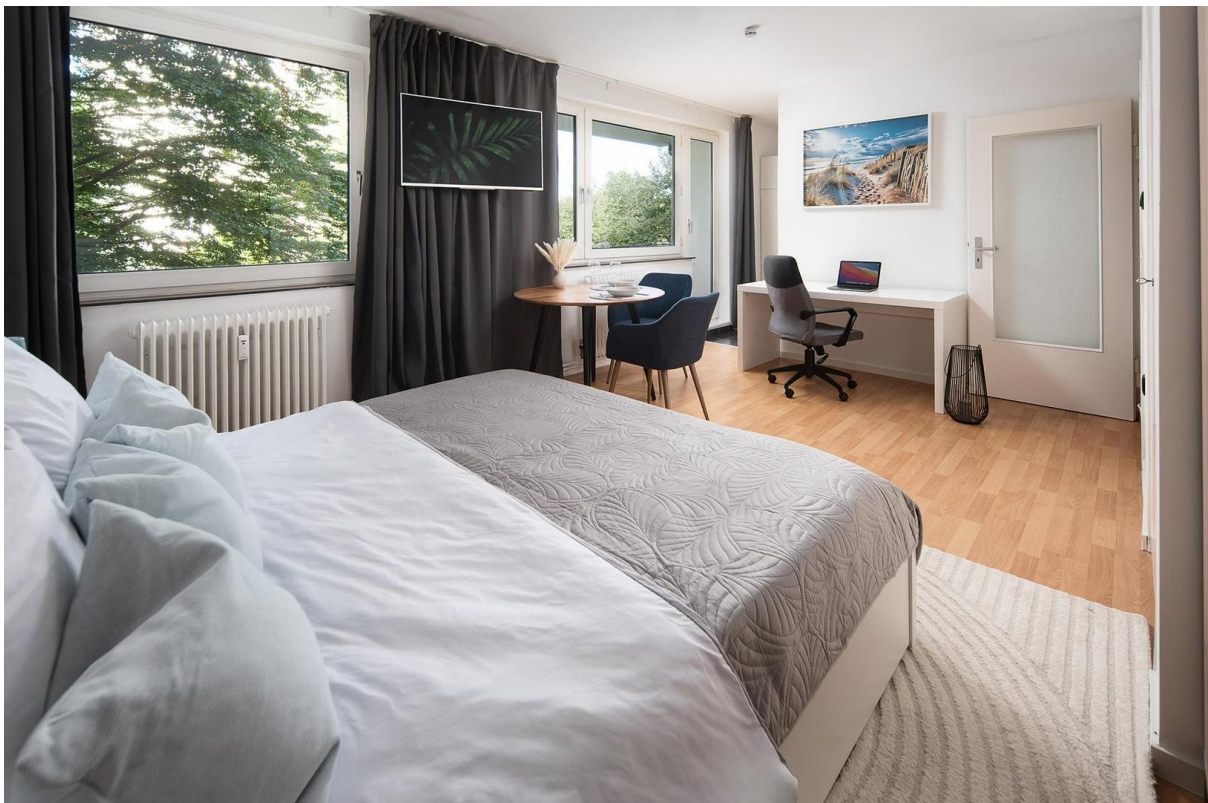
Schlaf- und Wohnbereich