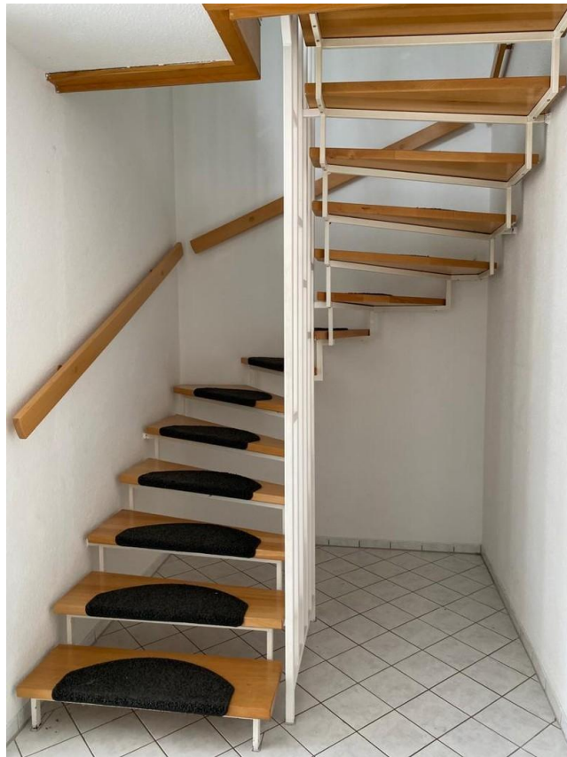
Treppe ins 1. OG