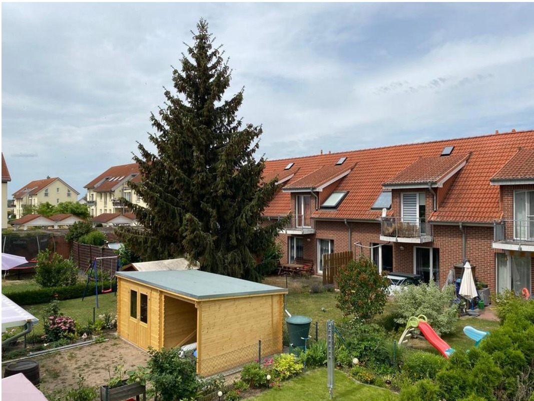
Blick in die Gärten