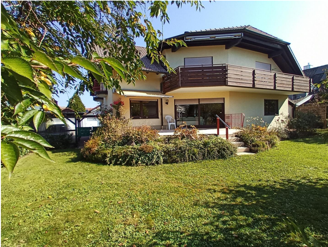
Südlage mit Terrasse und Garten