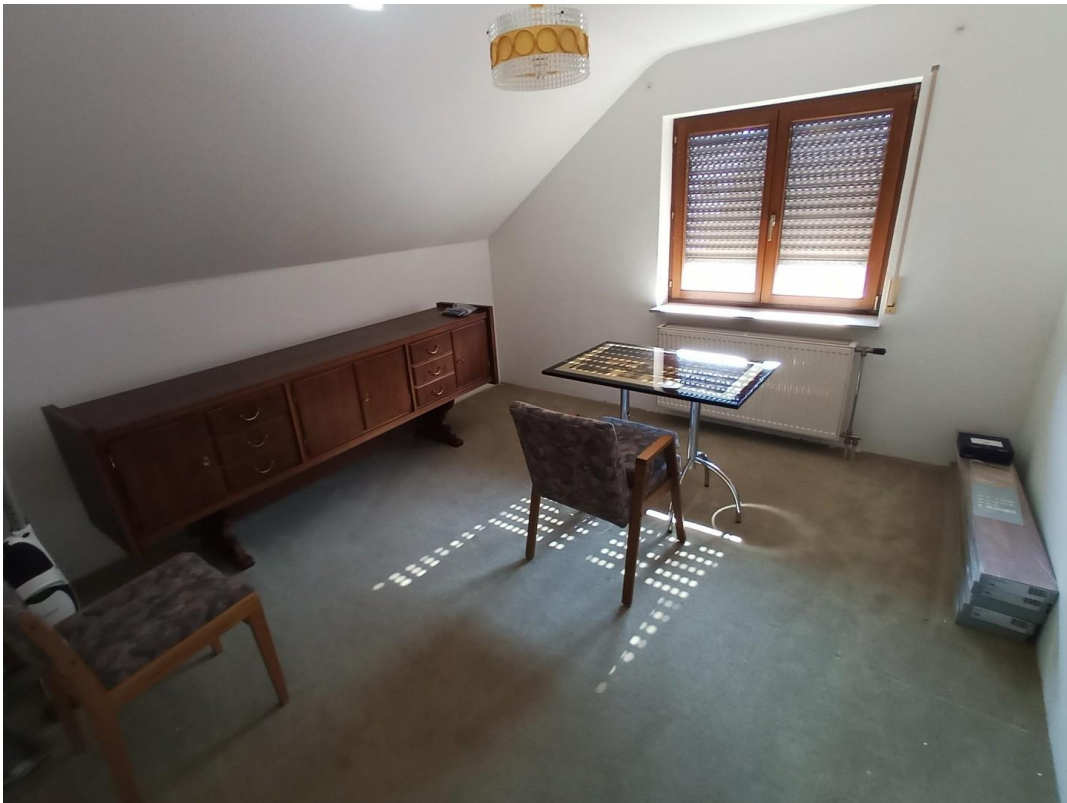
Nicht vermietetes DG-Zimmer