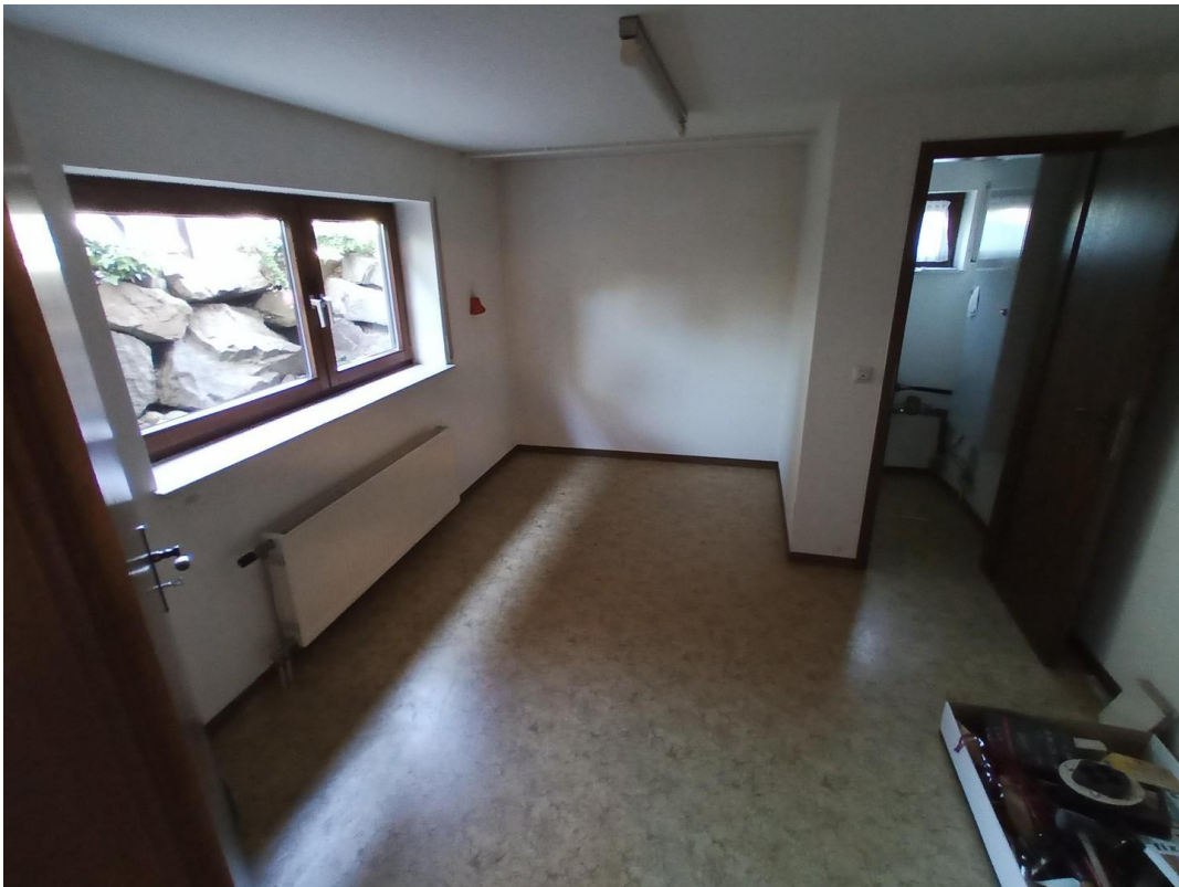
Zimmer 3 im Keller