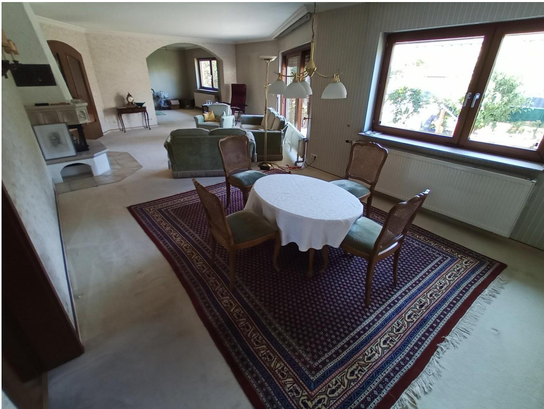
Wohn- & Esszimmer