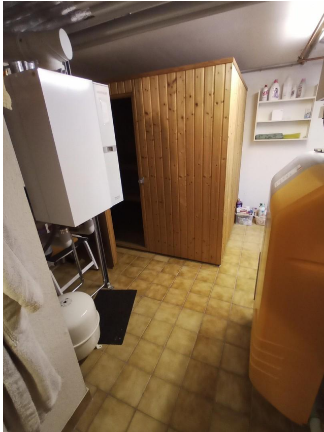
Technikraum mit Sauna