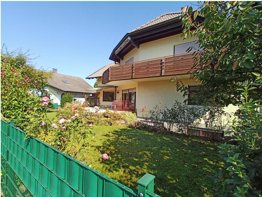
Südlage mit Terrasse und Garten