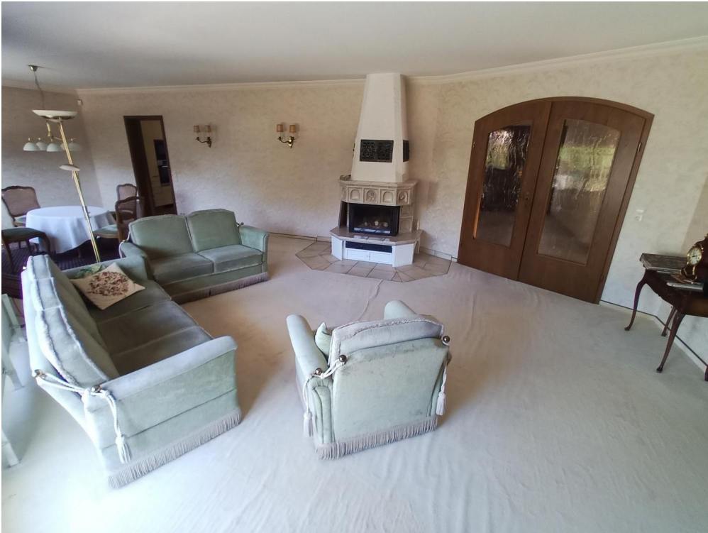
Wohn- & Esszimmer