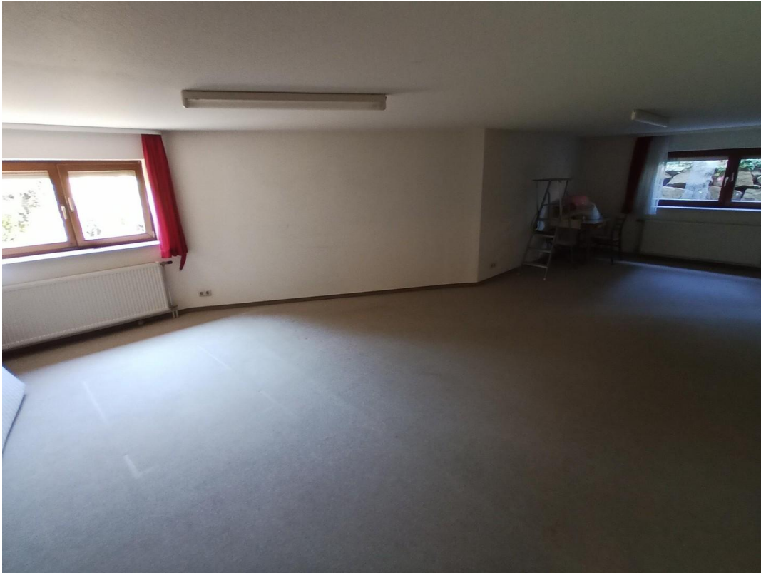
Zimmer 2 (Hobbyraum) im Keller