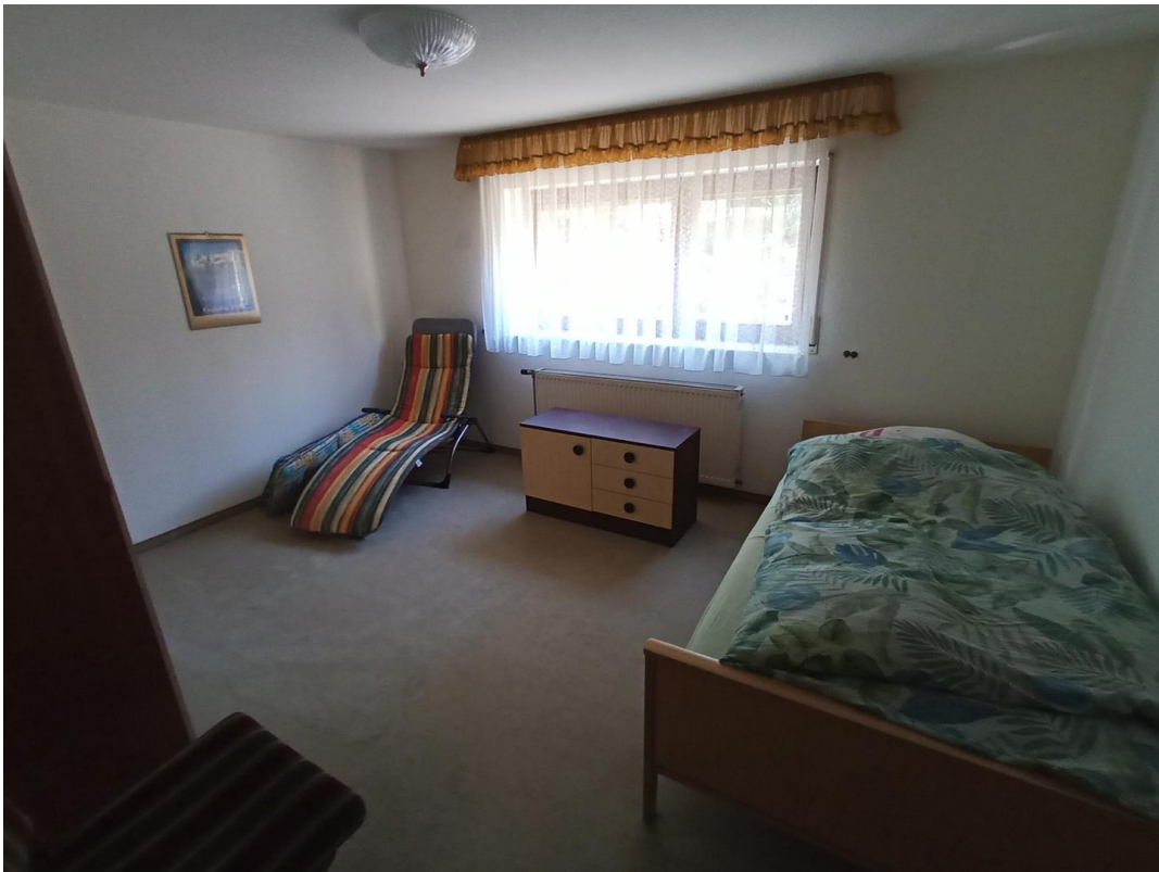
Zimmer 1 im Keller