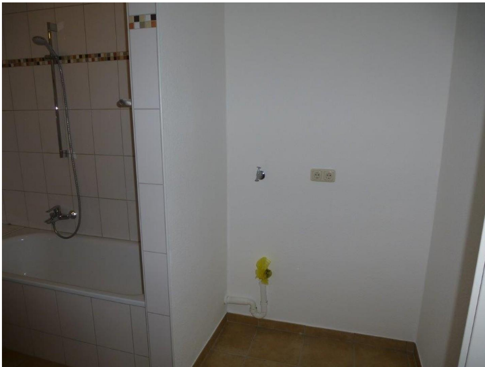
Bad, Wanne mit WM und Trockner