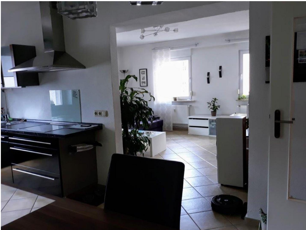
offene Küche mit Wohnzimmer