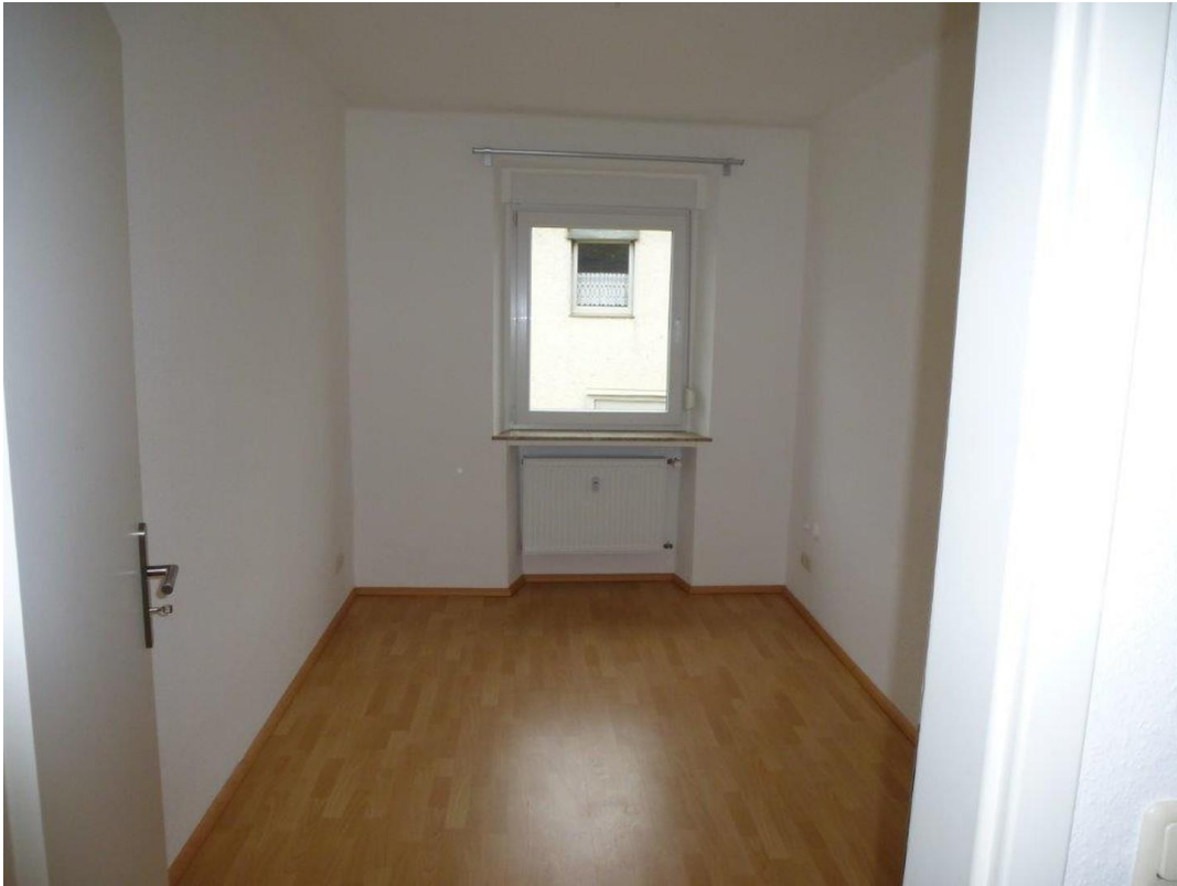
Kind / Arbeit