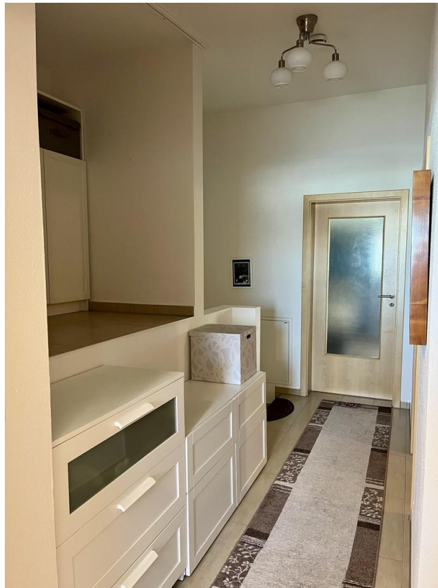
Großer Flur mit viel Stauraum