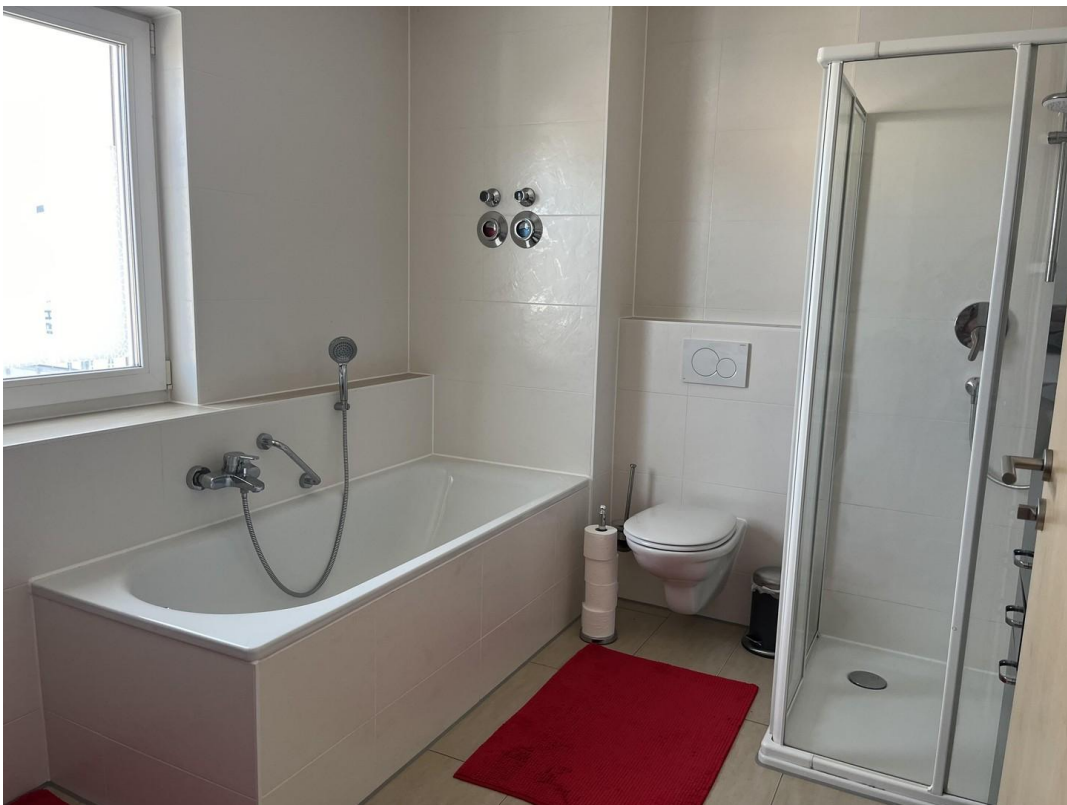
Großes, helles Badezimmer