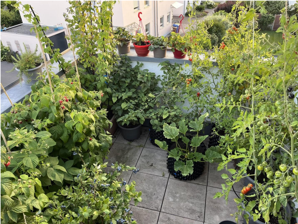
Dachterrasse nach Süden