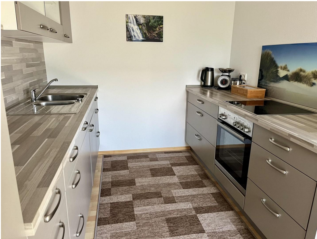
Küche mit moderner Einbauküche