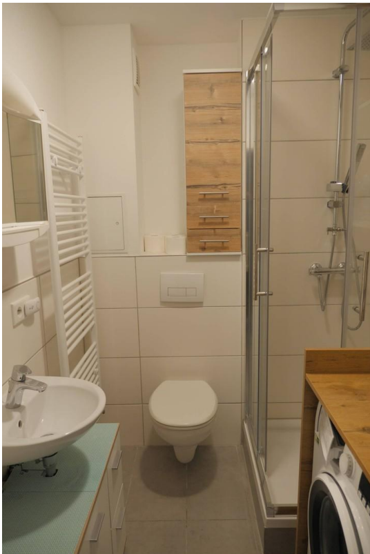
Bad mit Dusche / Waschmaschine