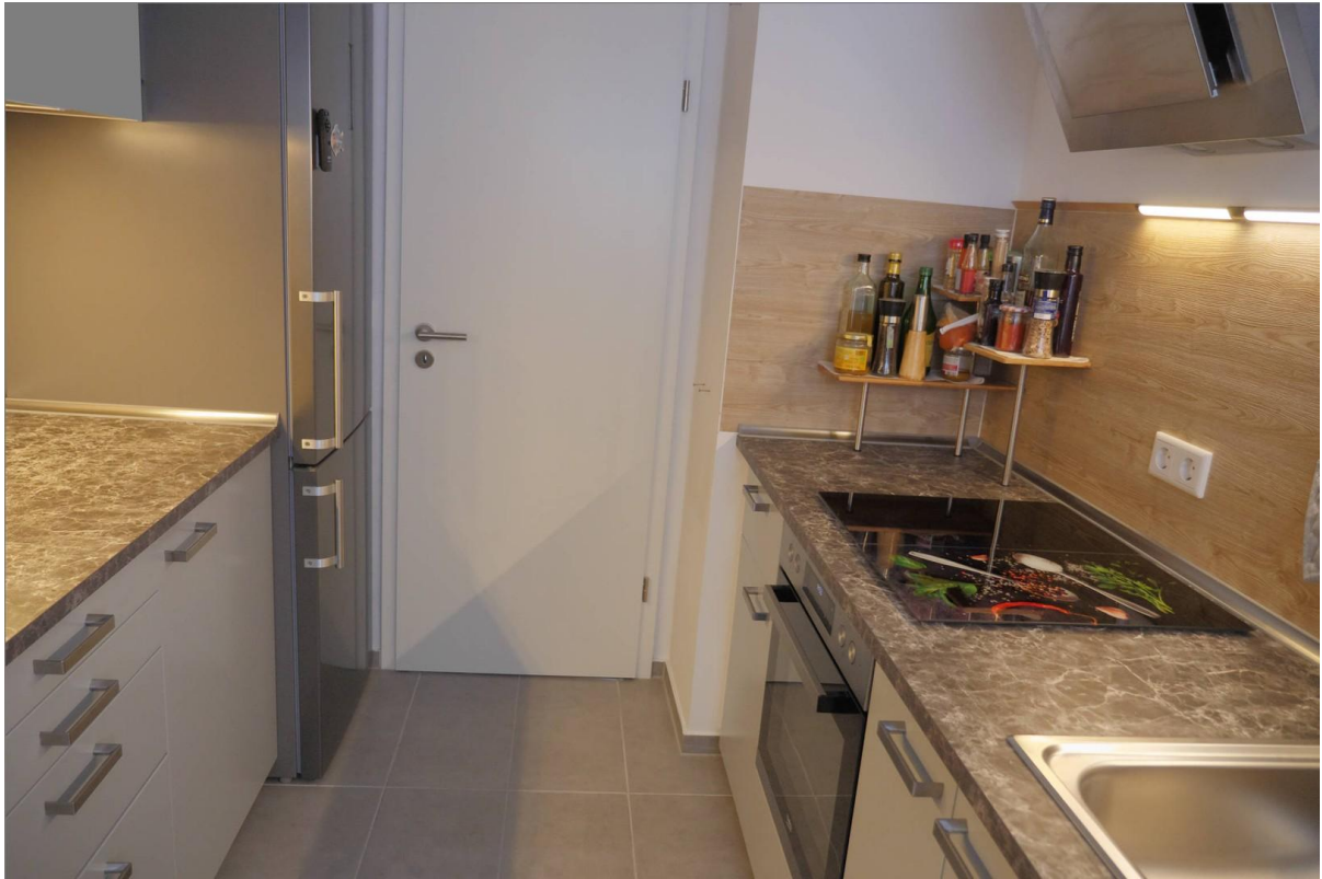
Küche (EBK Eigentum Mieter)