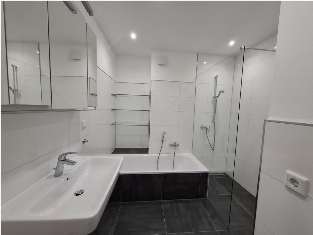
Bad mit Dusche und Wanne