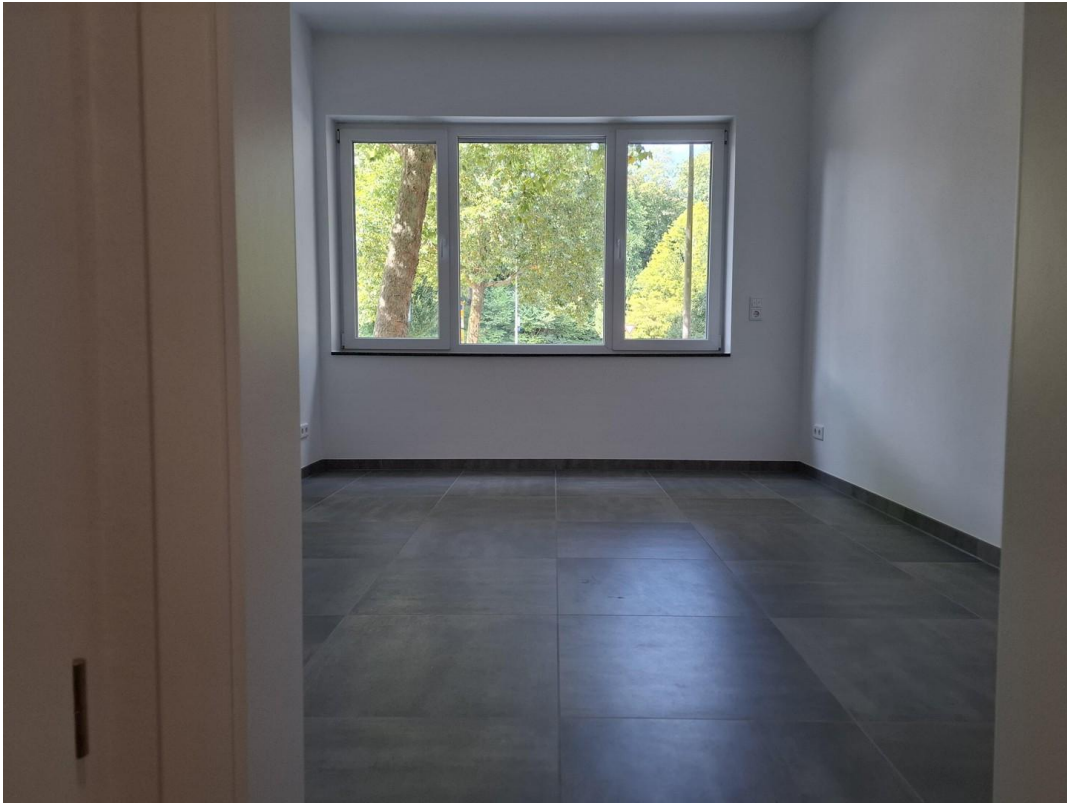
Esszimmer/ Zimmer 1 Grundriss