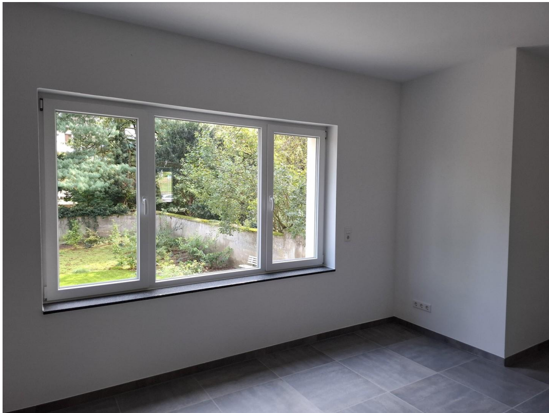
EG links/ Zimmer 3 Grundriss