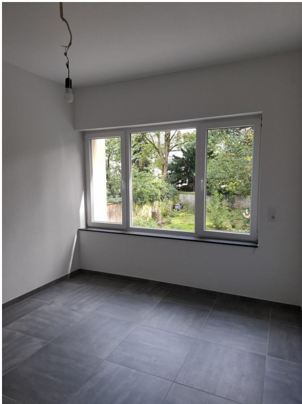
EG rechts/ Zimmer 2 Grundriss