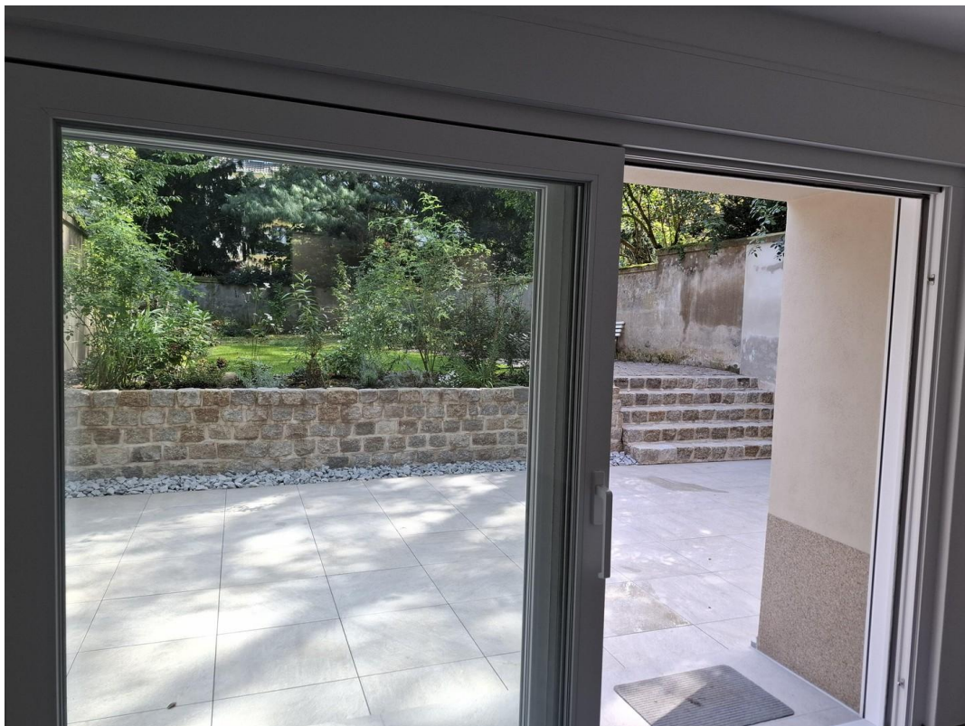
Blick auf die Terrasse