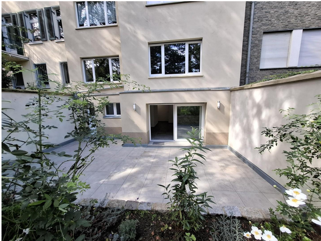
Blick auf die Terasse