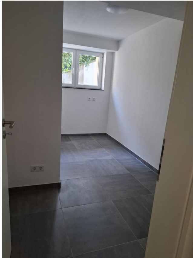
HWR/ Zimmer 5 Grundriss