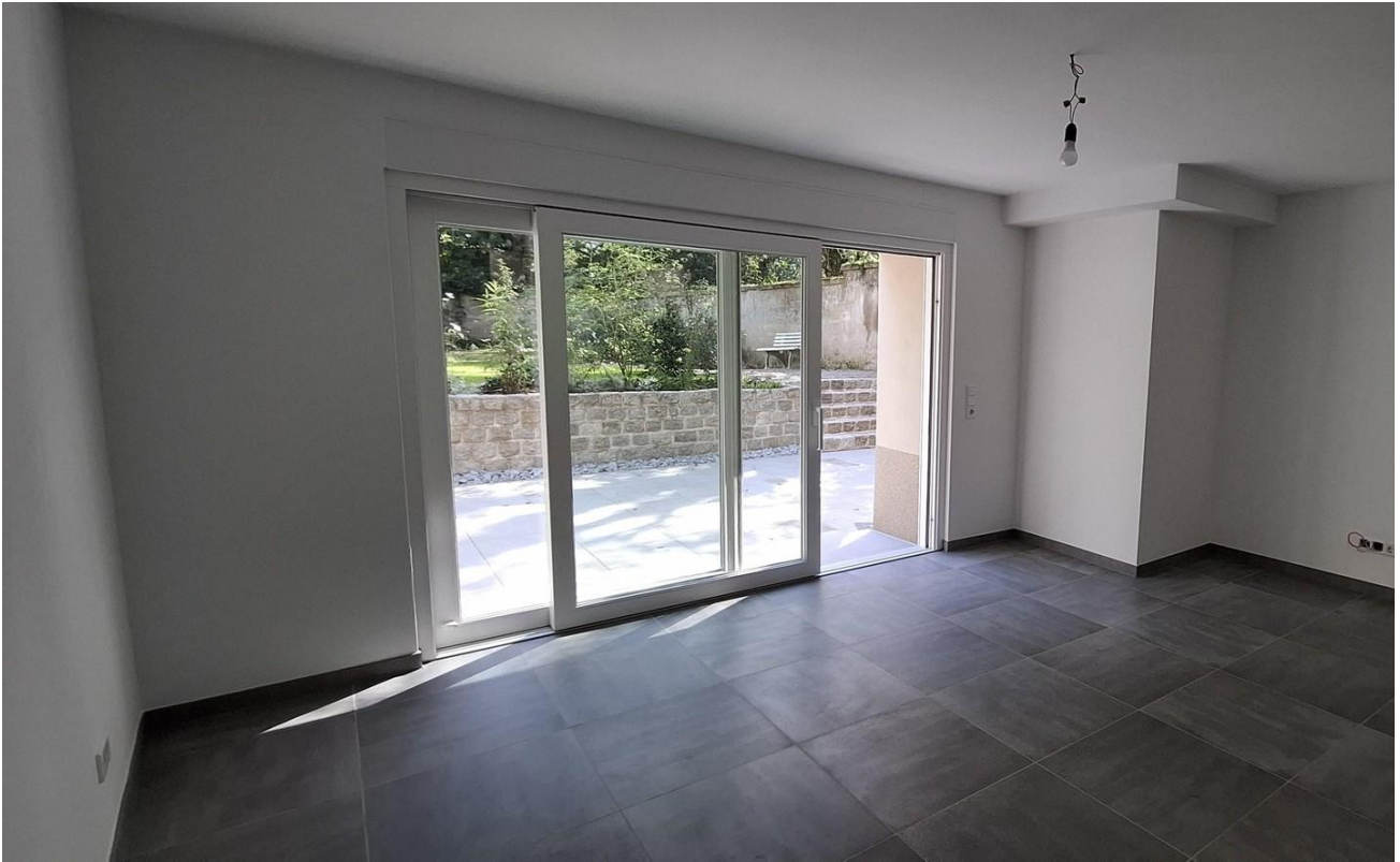
UG links/ Zimmer 4 Grundriss