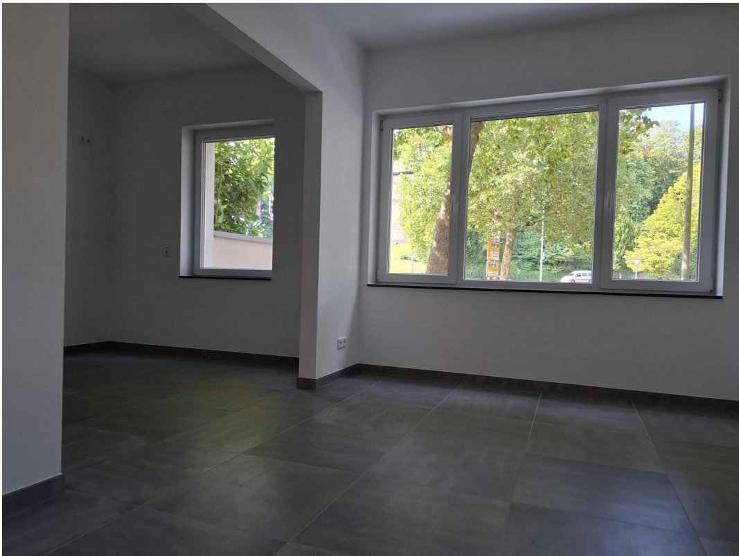
Esszimmer und Küche