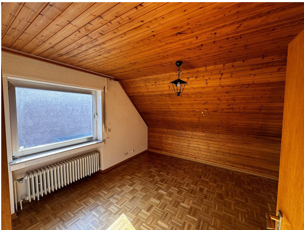
Zimmer 1, 1. OG