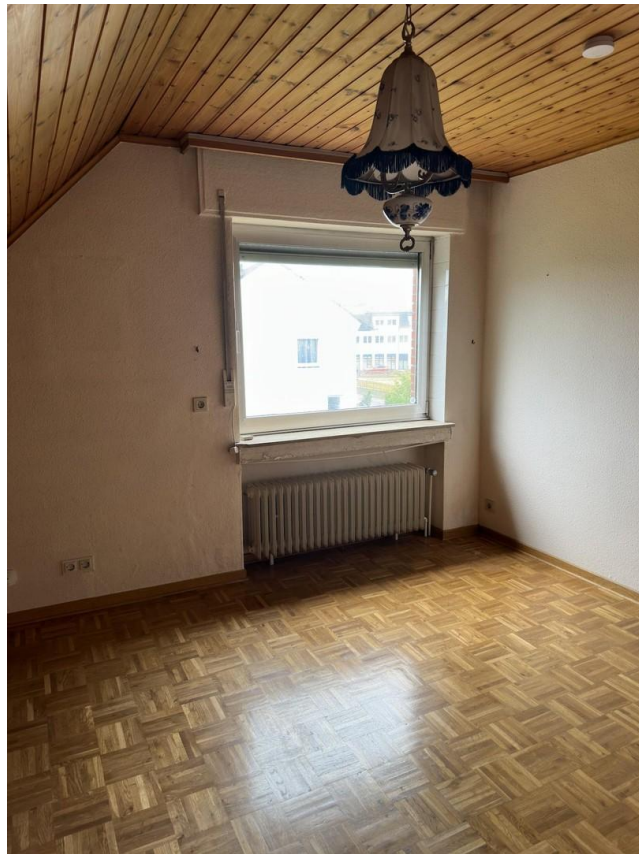
Zimmer 2, 1. OG