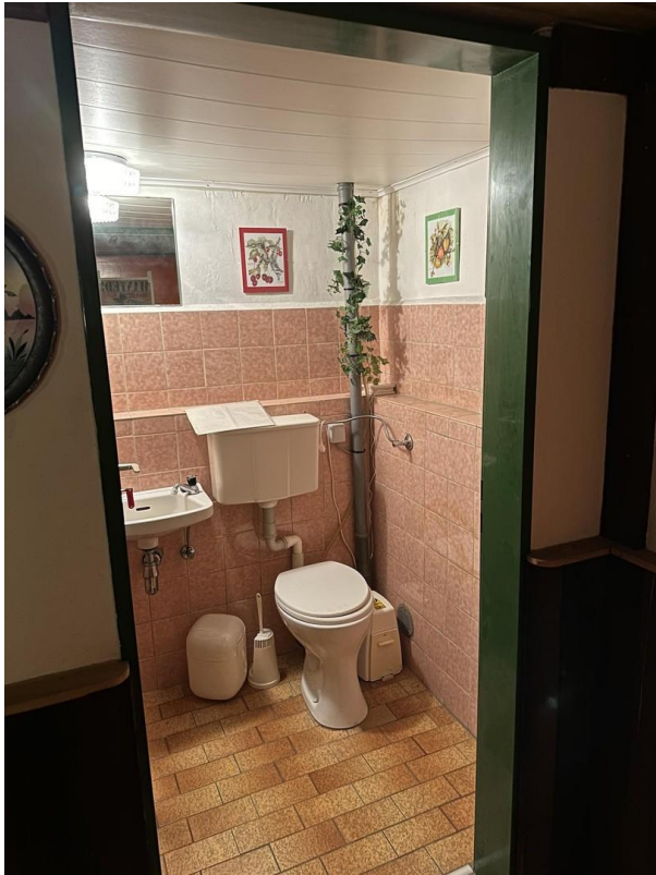
WC im Keller