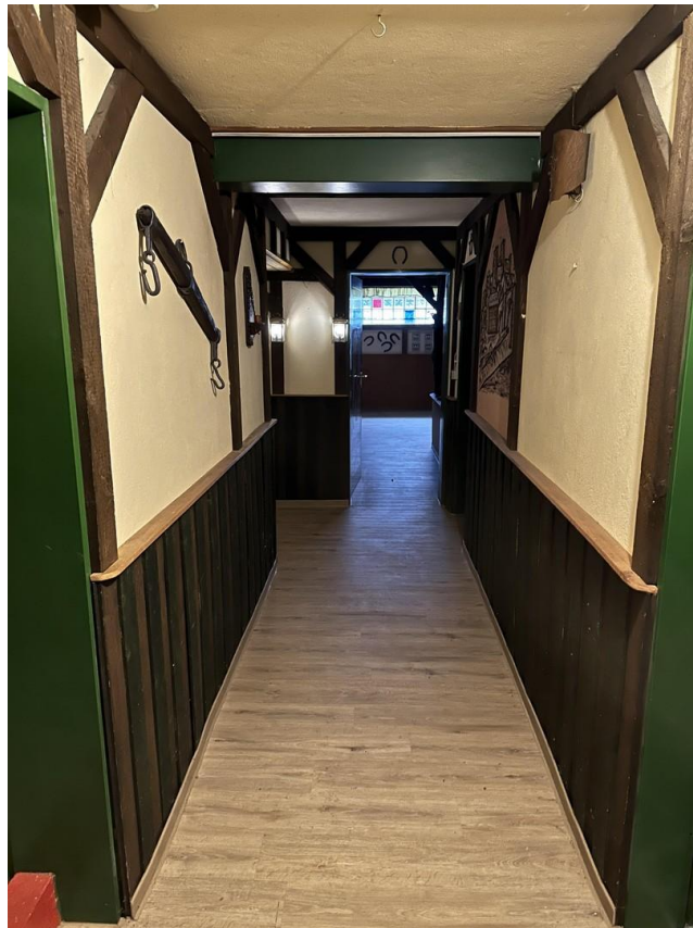
Flur im Keller