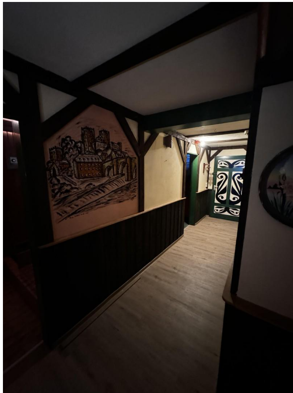
Flur im Keller