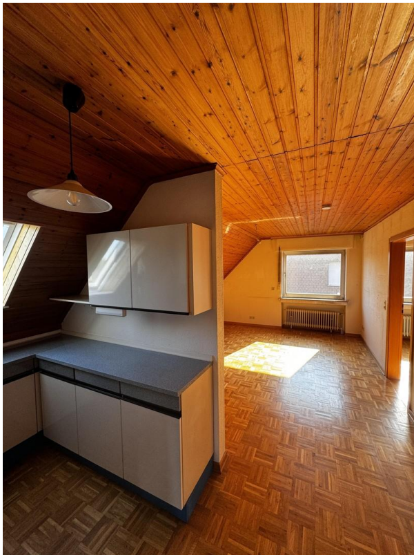
Zimmer 4 mit Küche 1. OG