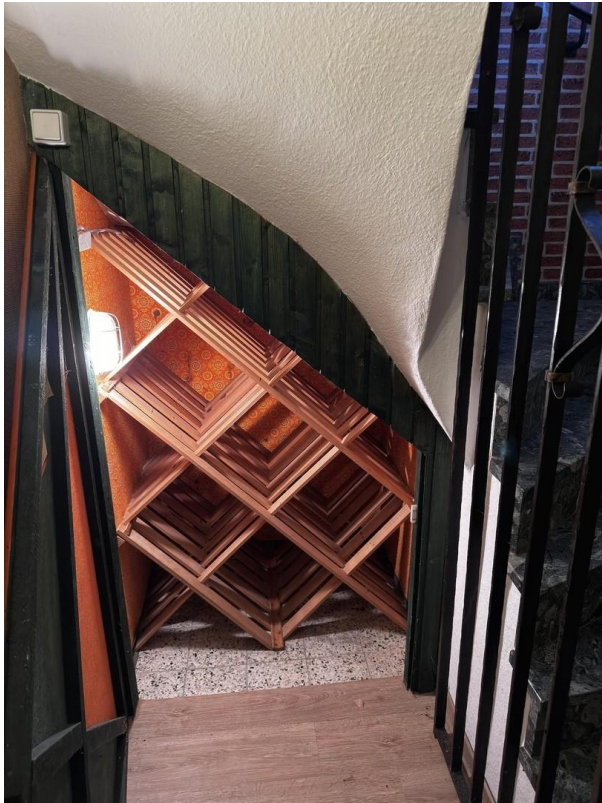
Weinlager im Keller