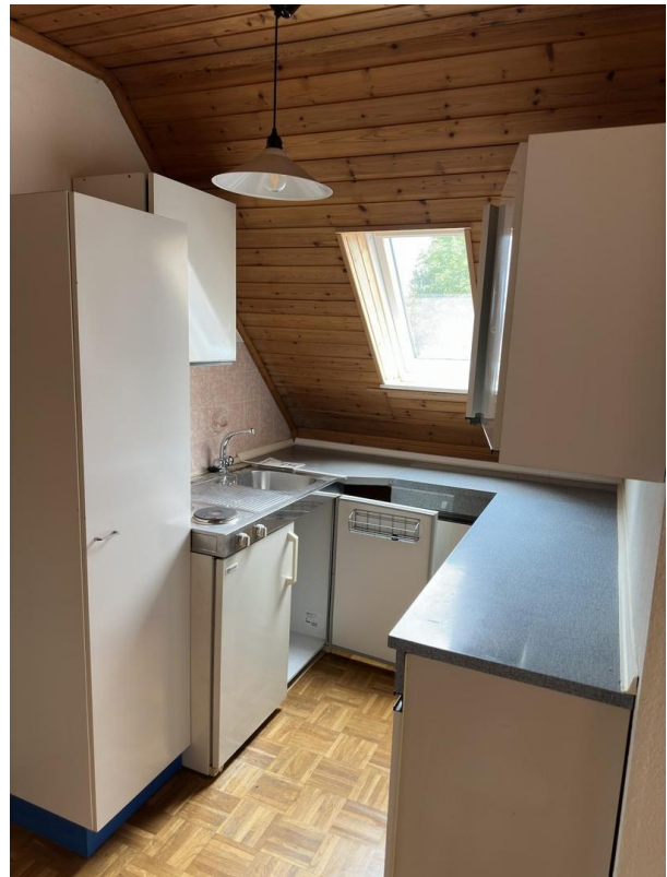
Küche 1. OG