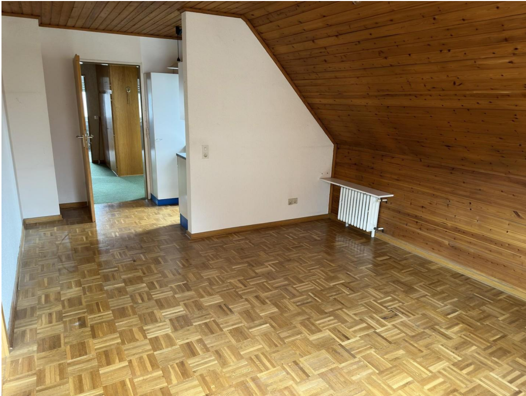
Zimmer 4, 1. OG