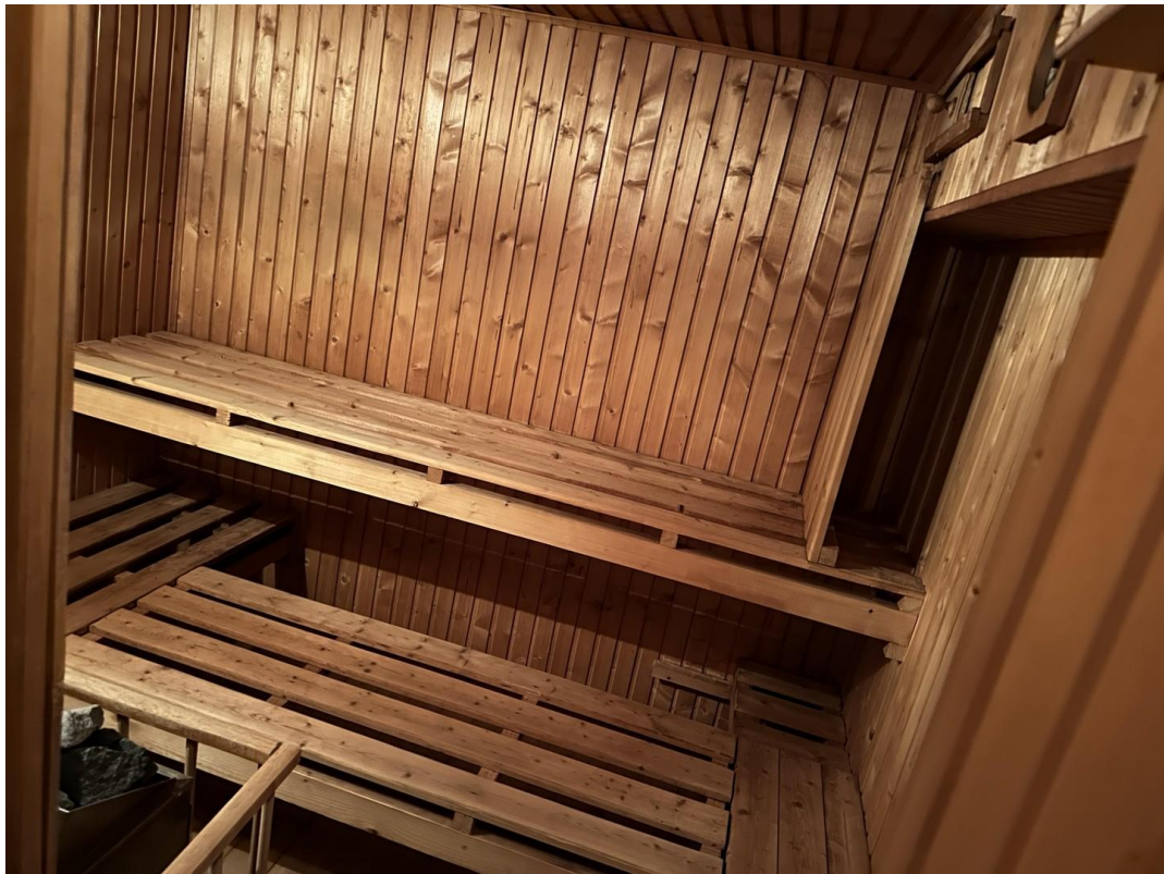
Sauna im Keller