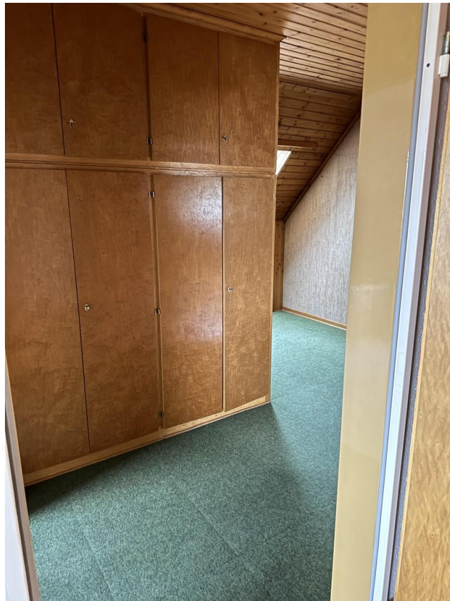
Flur 1. OG