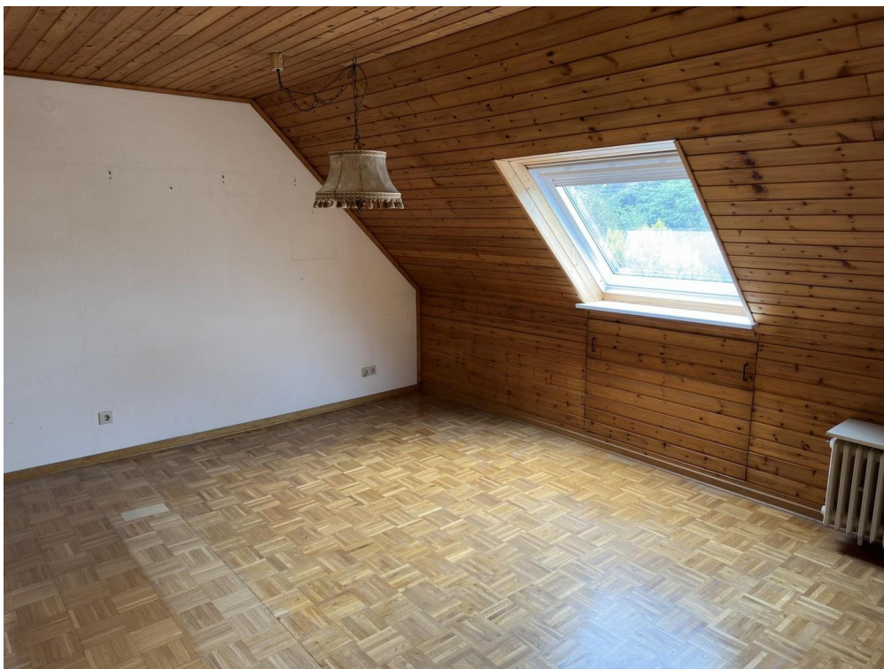
Zimmer 3, 1. OG