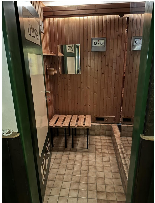
Sauna im Keller