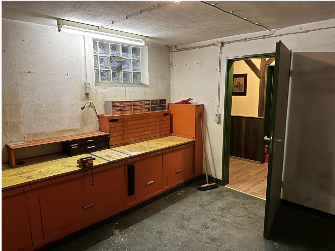
Werksatt im Keller