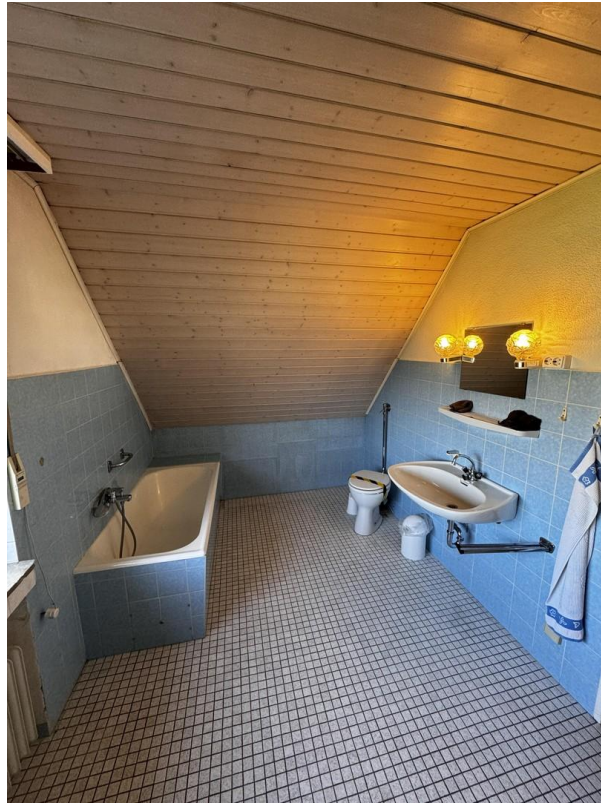
Bad 1. OG