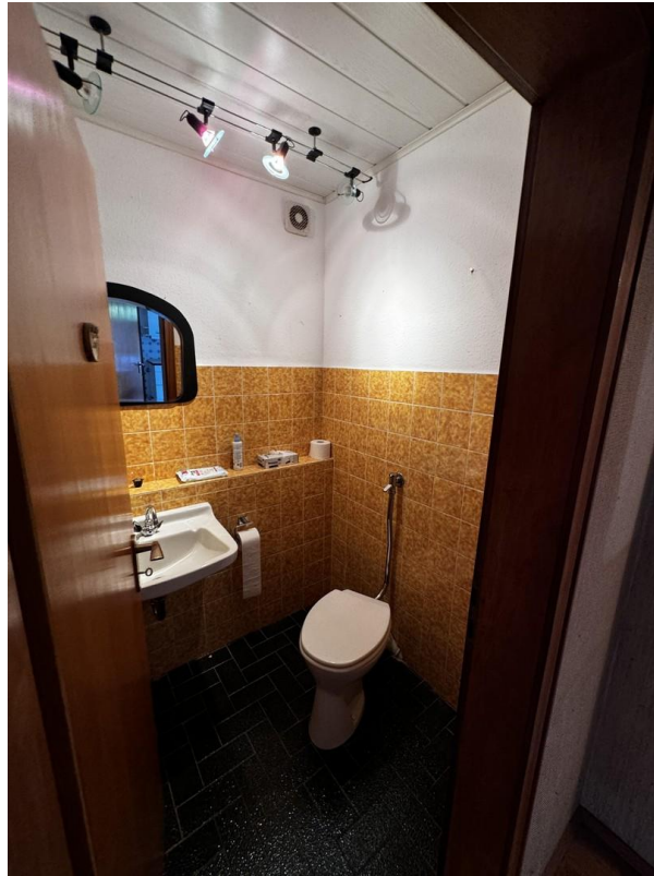
Gäste WG im EG