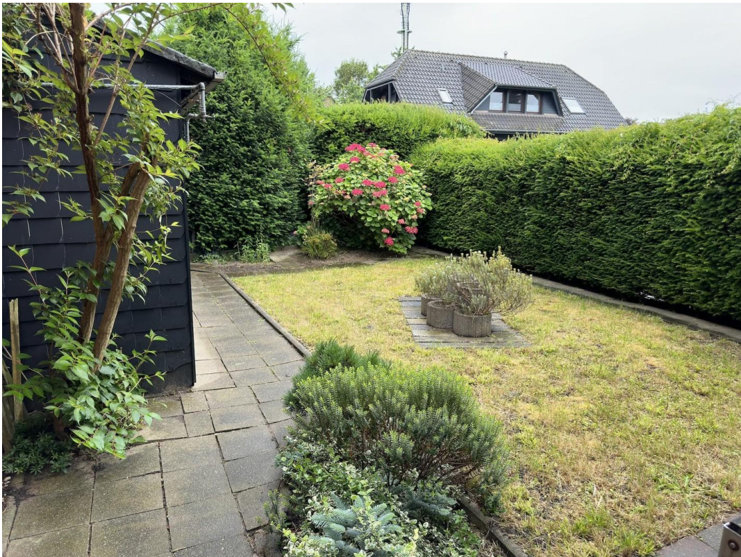
Garten neben dem Haus