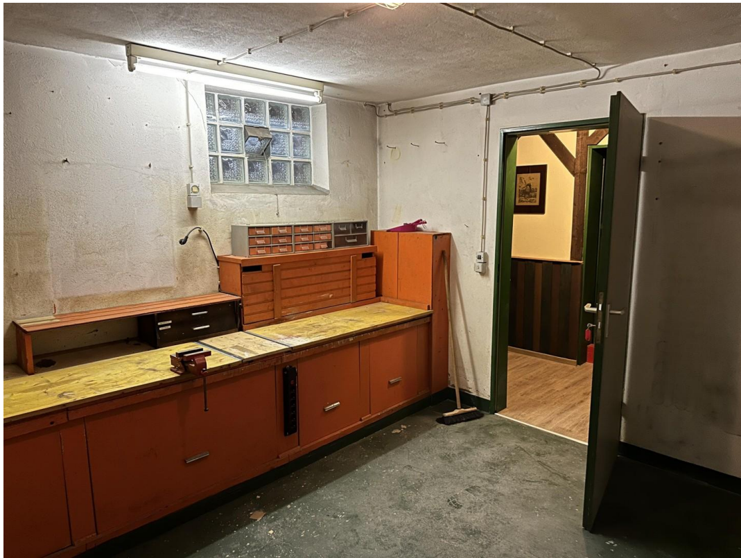
Werksatt im Keller