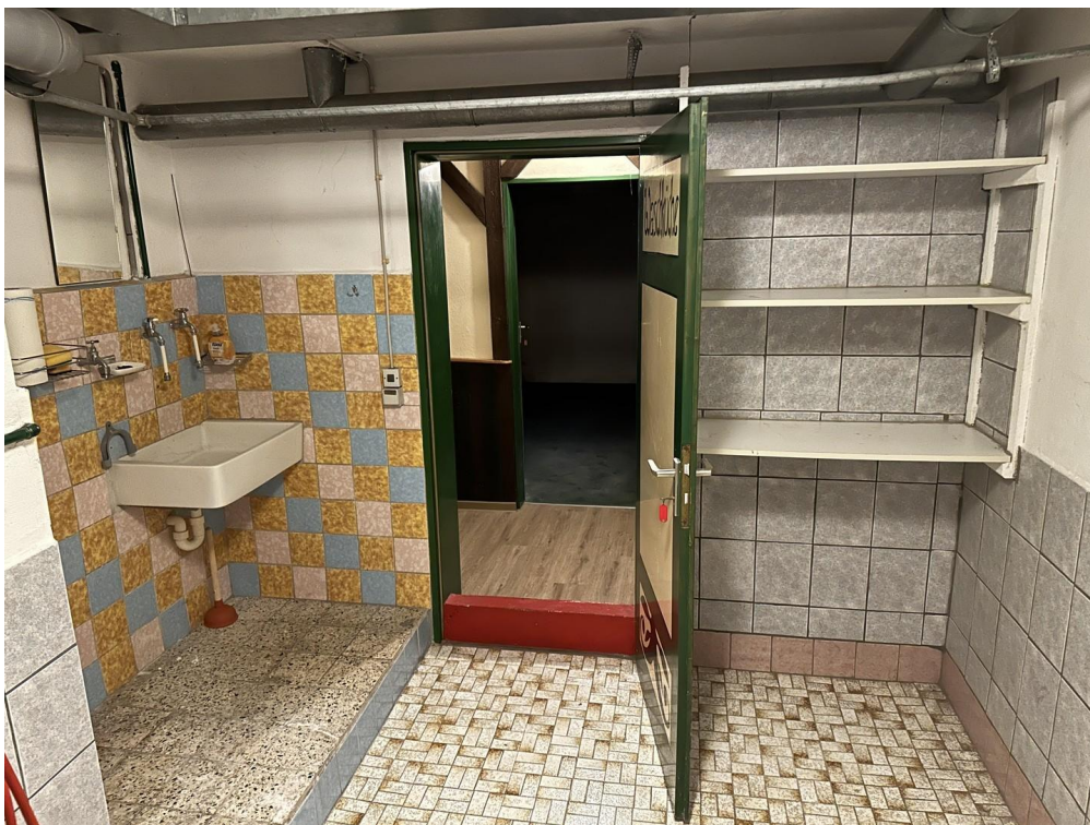
Waschküche im Keller