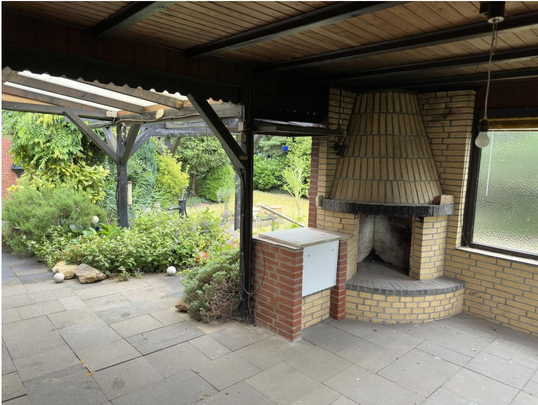
Terrasse mit Kamin und Grill