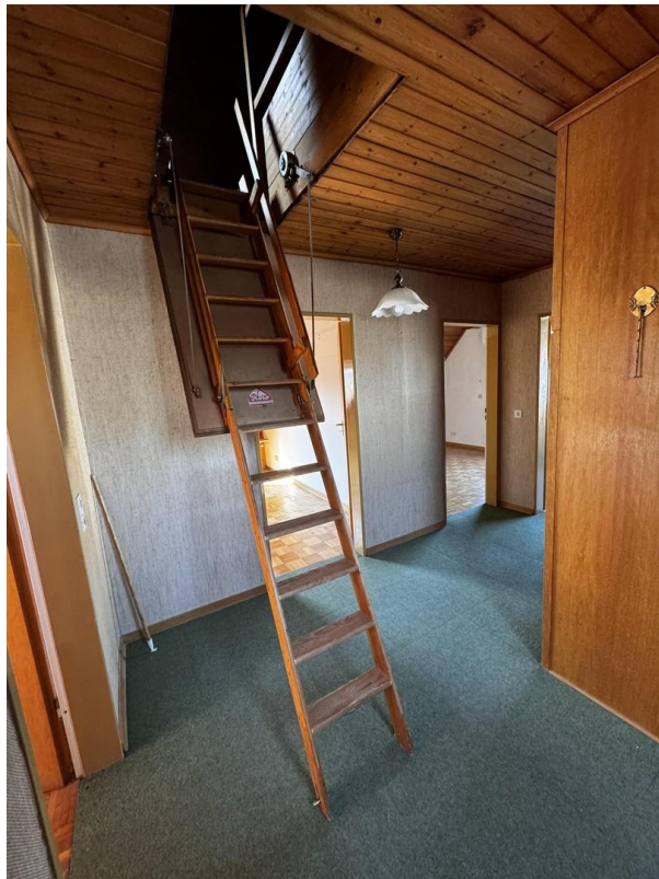
Flur 1. OG