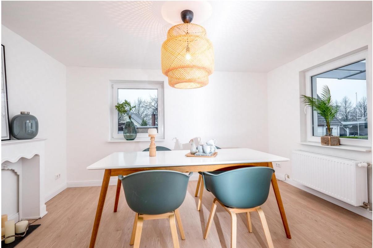
Ess- oder Arbeitszimmer