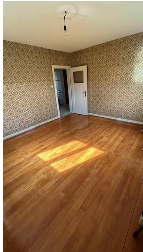
Eines der 7 Zimmer