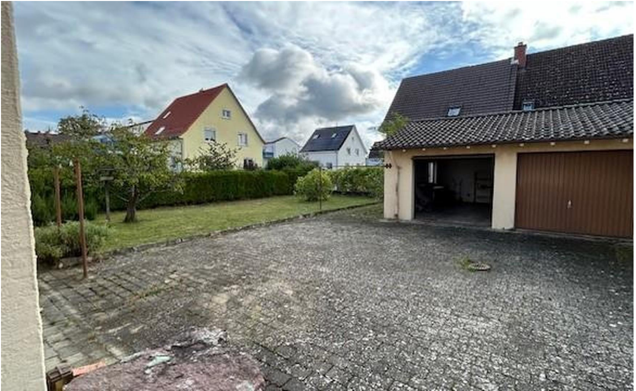
Garagen und Garten