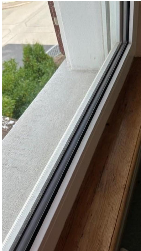
Alle Fenster doppelverglast