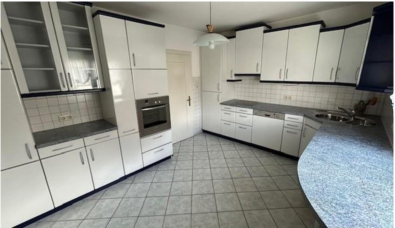
Küche im OG