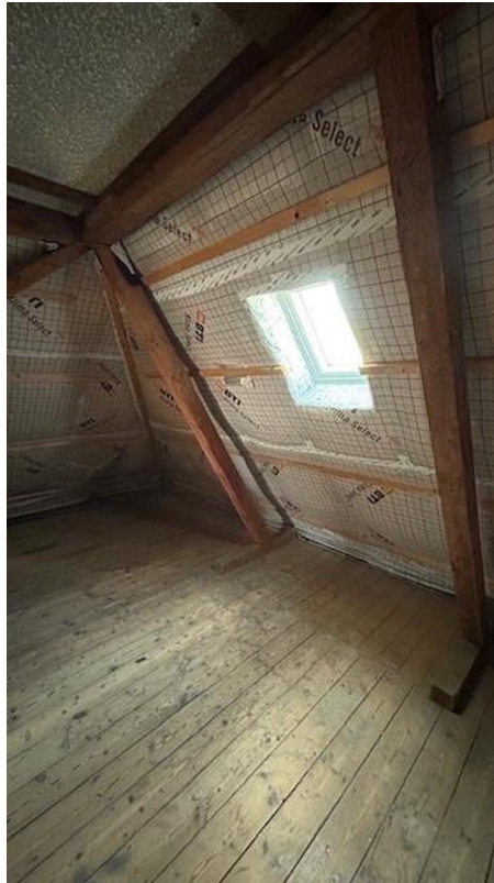
DG mit saniertem Dach