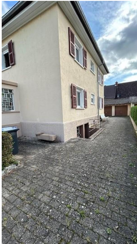
Zufahrt zu den Garagen