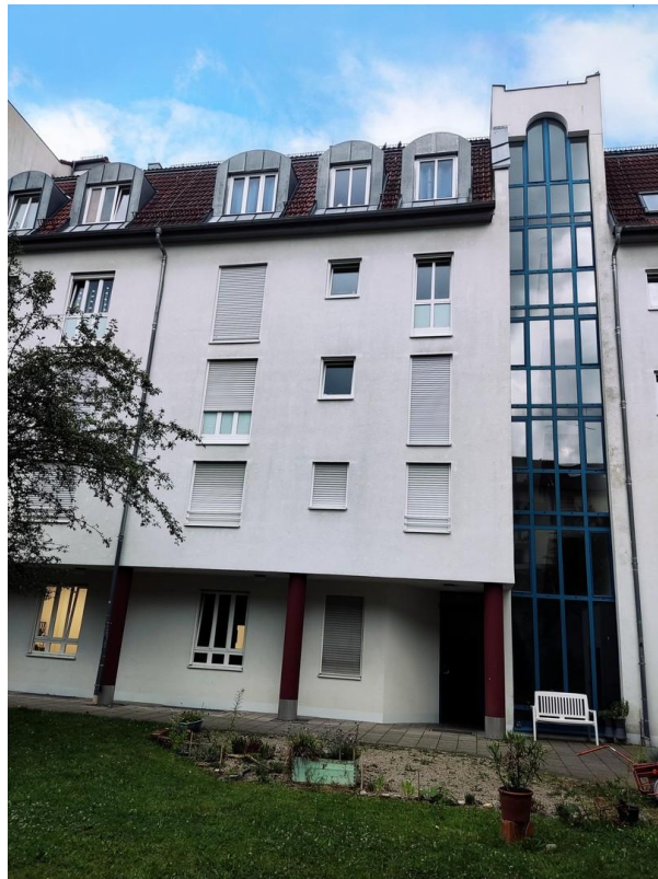
Gebäude Innenhof 2