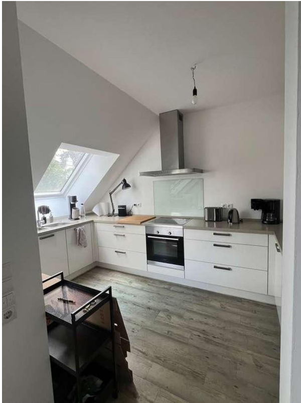
Küche (in Miete enthalten)