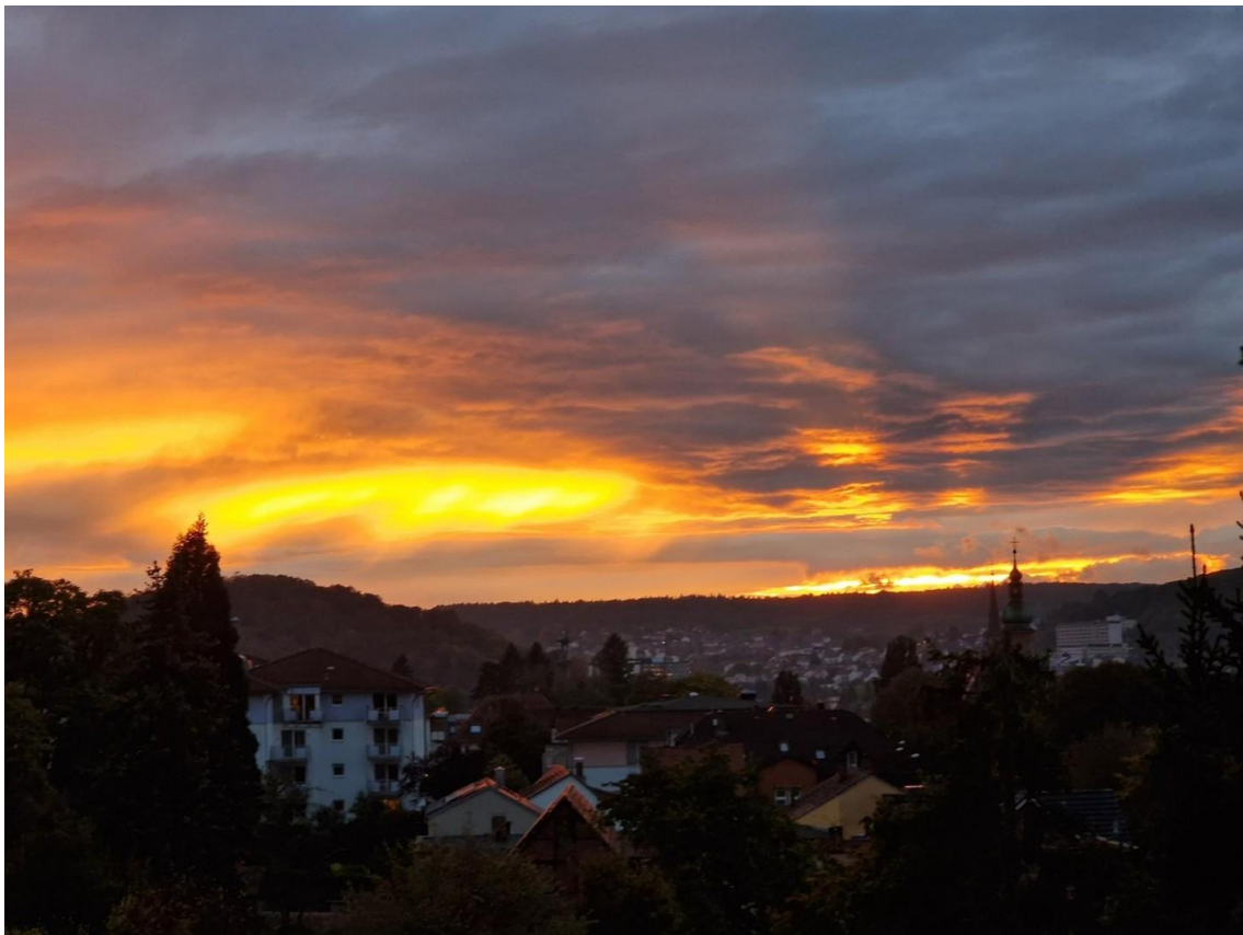
Impressionen vom Balkon