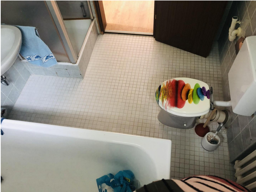
Bad von oben