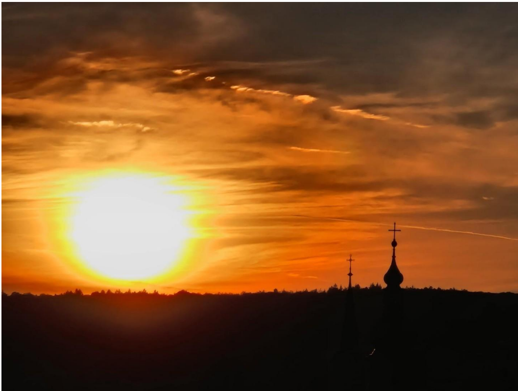
Impressionen vom Balkon