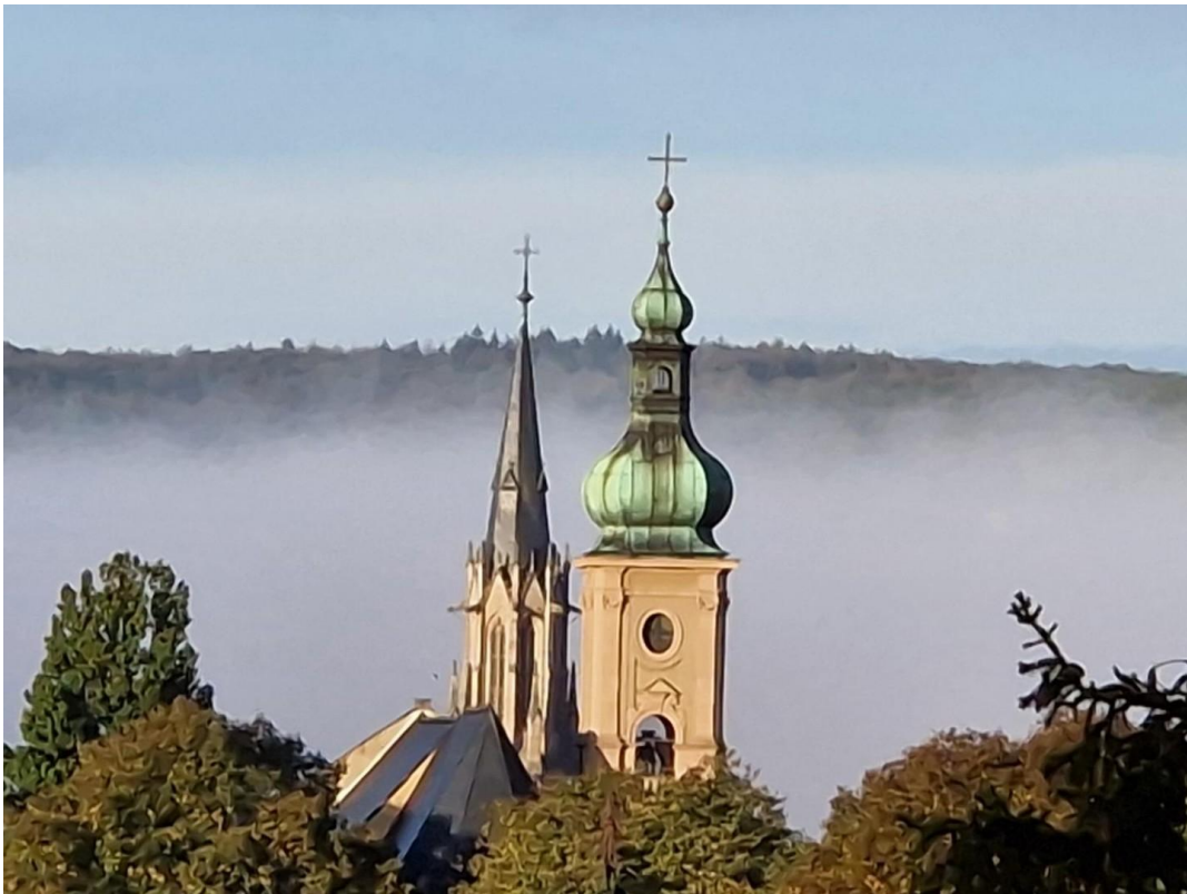
Impressionen vom Balkon