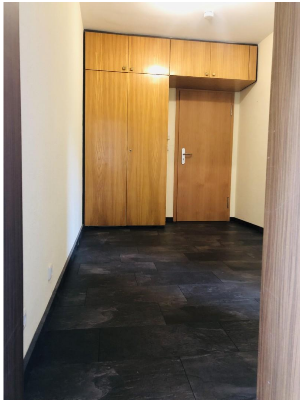
Diele mit Einbauschränk