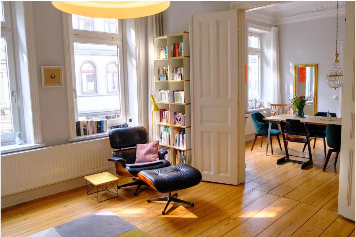
Großzügiges Wohnen im Altbau