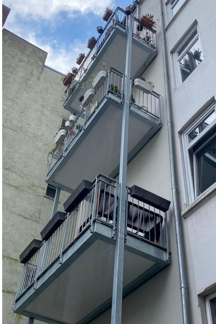
Balkone im Innenhof