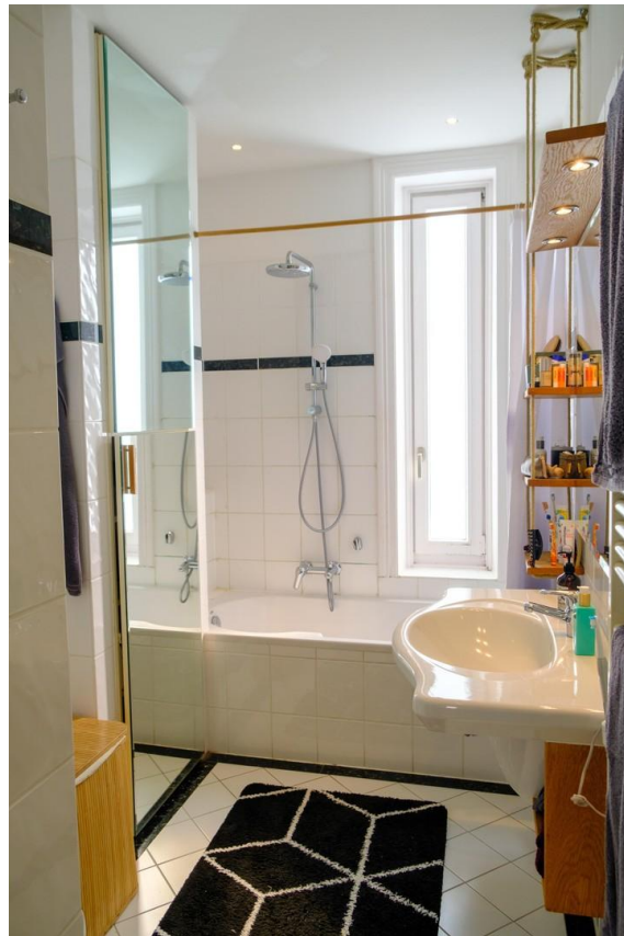
Vollbad mit Fenster zum Hof