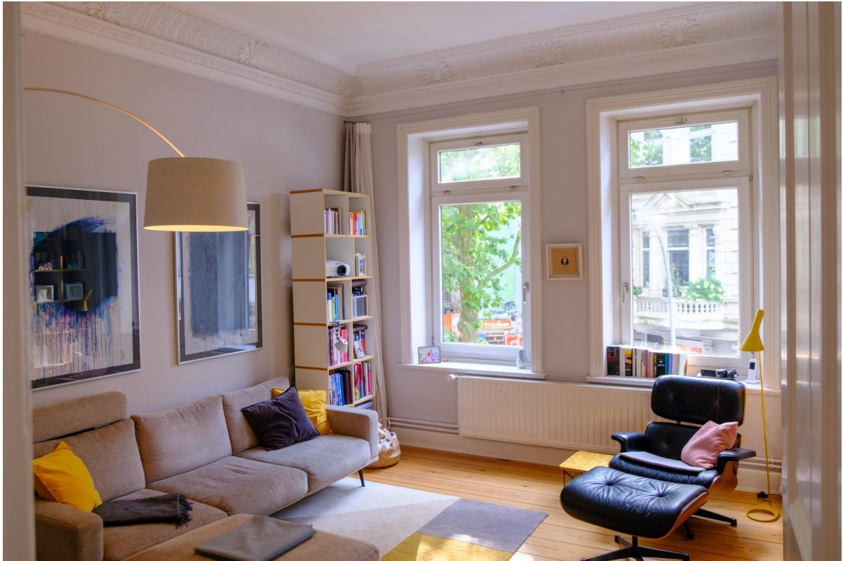
Fensterfronten im Wohnzimmer