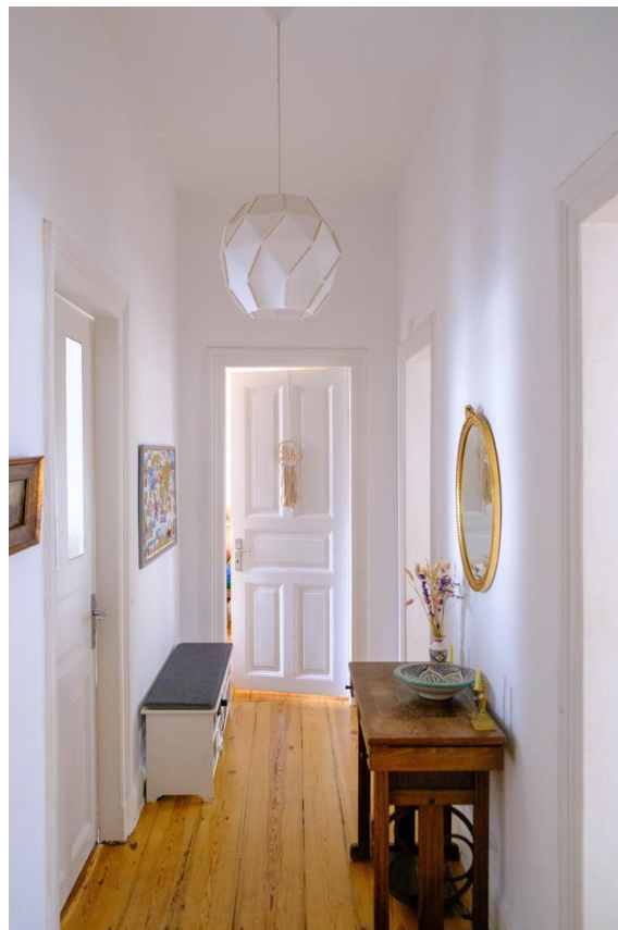
Heller Flur mit Abstellkammer