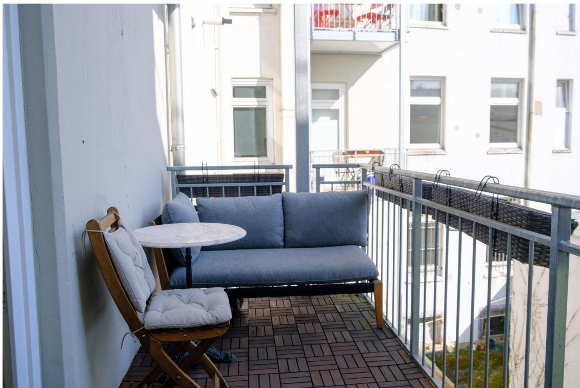
Neuer großzügiger Balkon