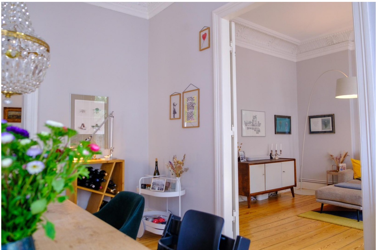
Heller Ess- und Wohnbereich