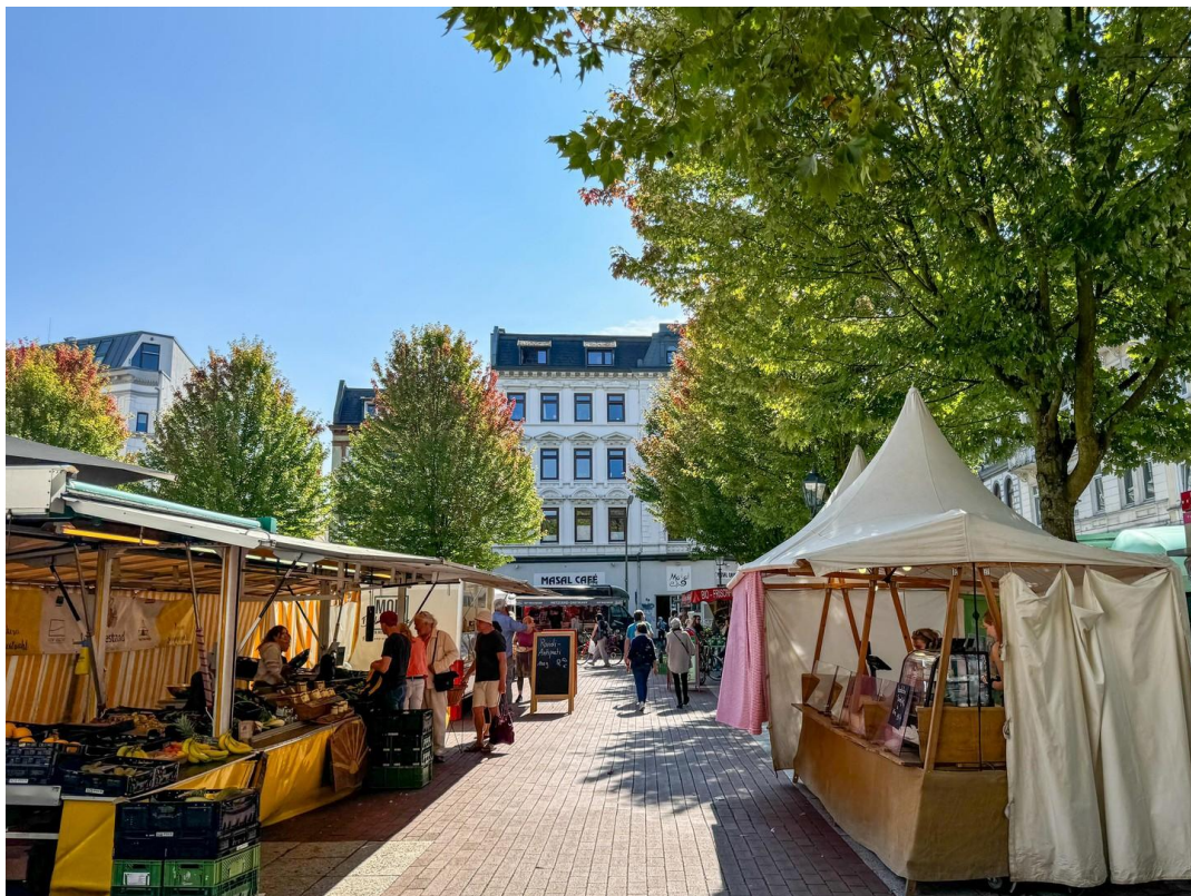
Blick vom Marktplatz