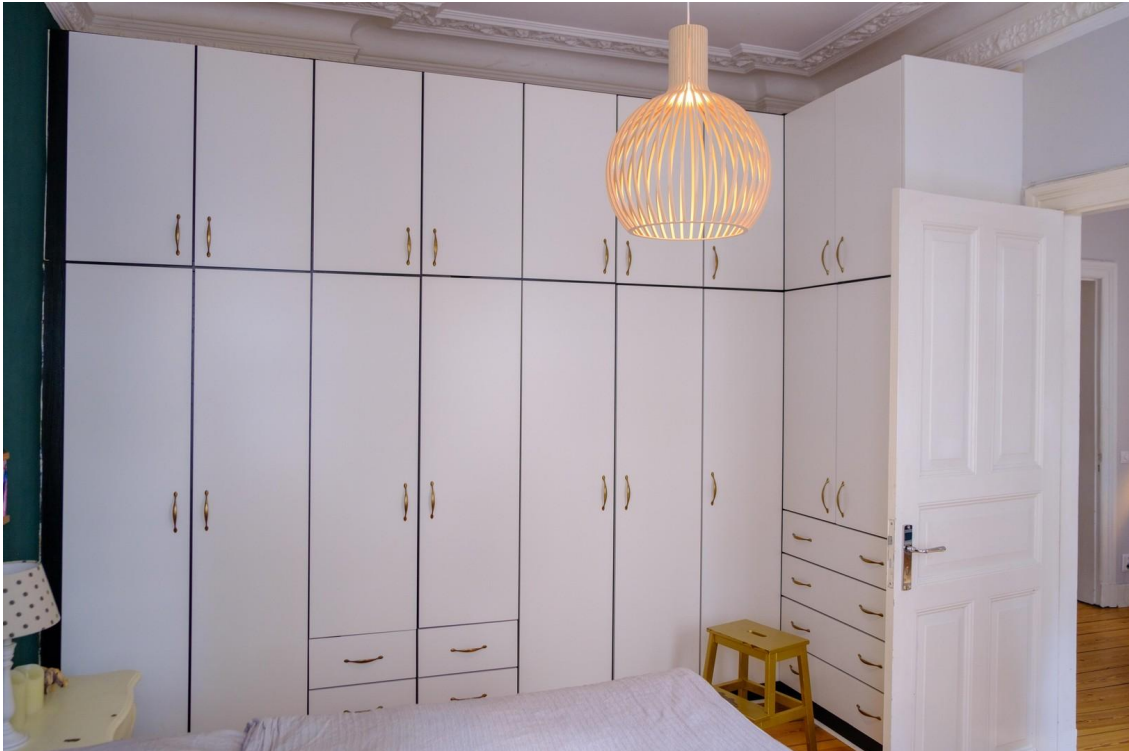
Schlafzimmer mit Einbauschränk