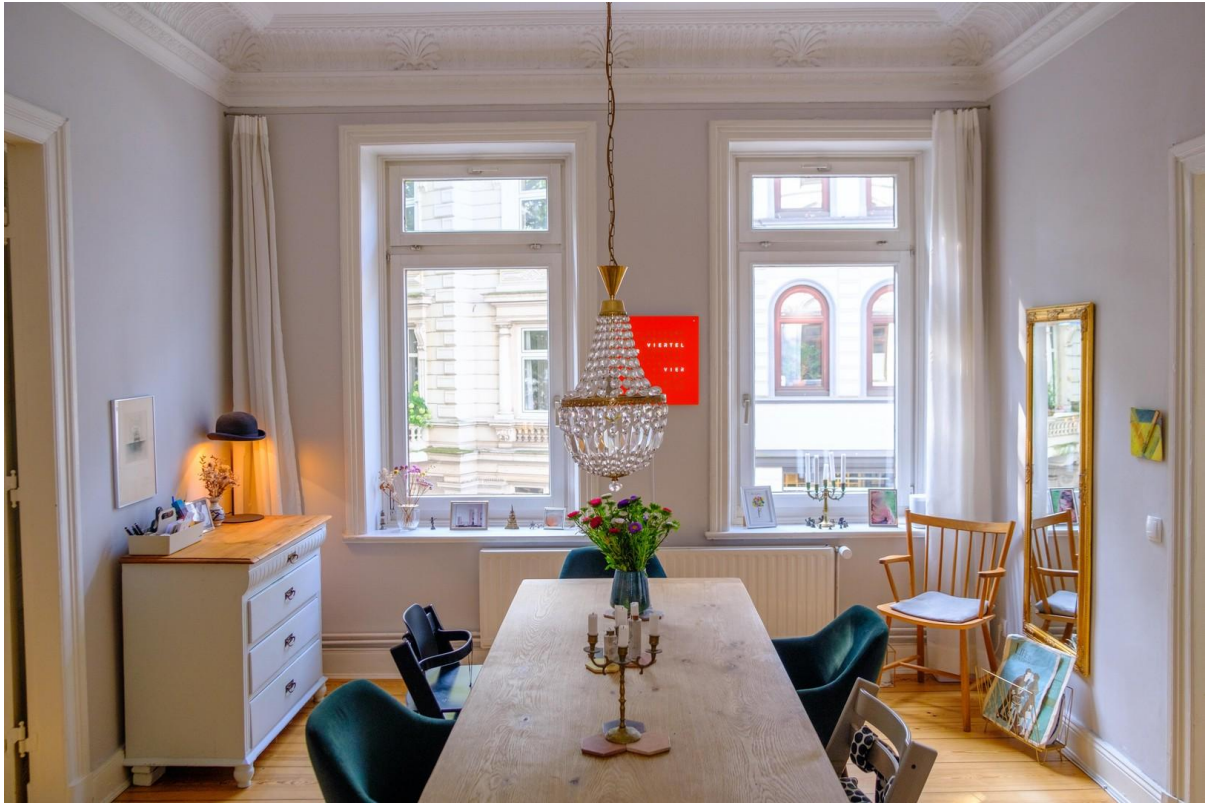
Eine große Tafel im Esszimmer