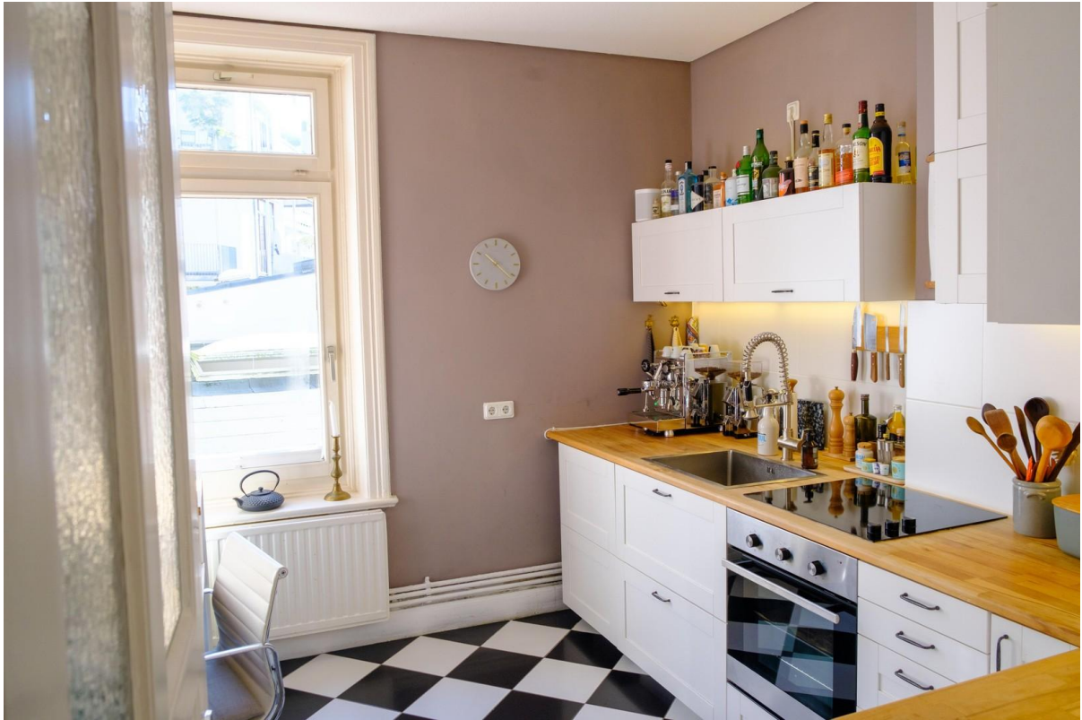
Küche mit historischen Fliesen