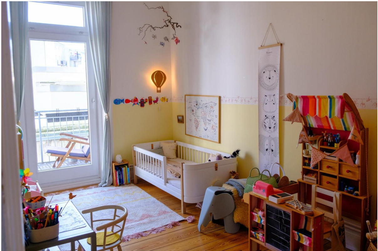
Kinder, Gäste, Arbeiten