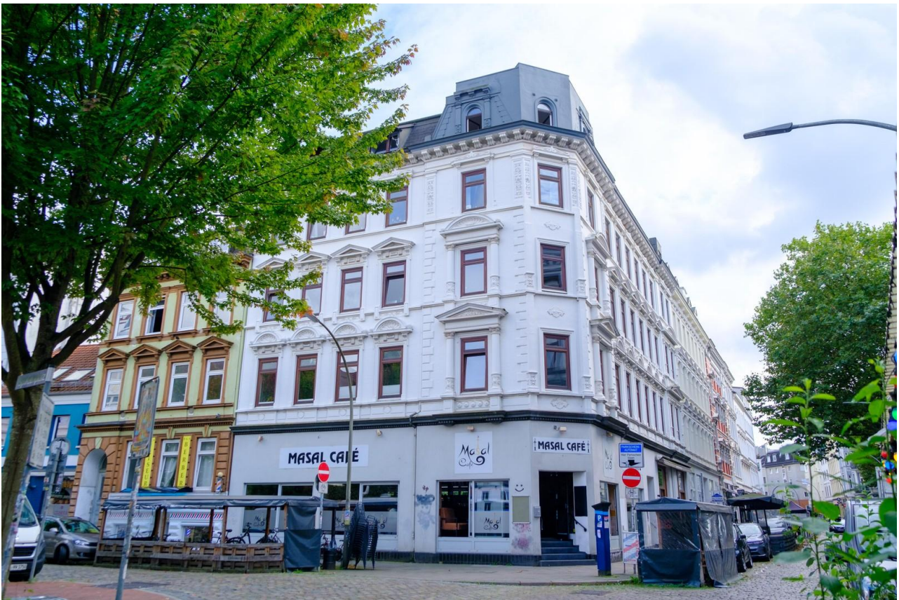
Eckhaus am Spritzenplatz