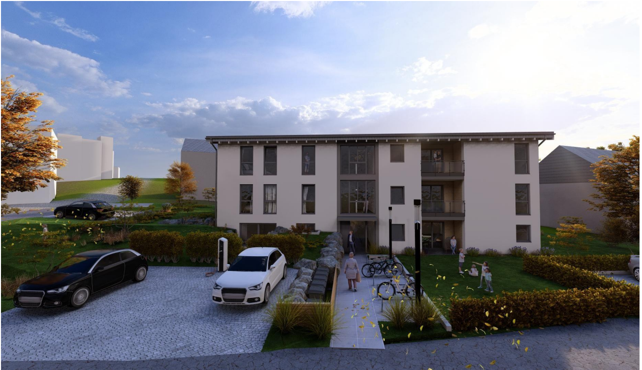
Frontansicht des Hauses