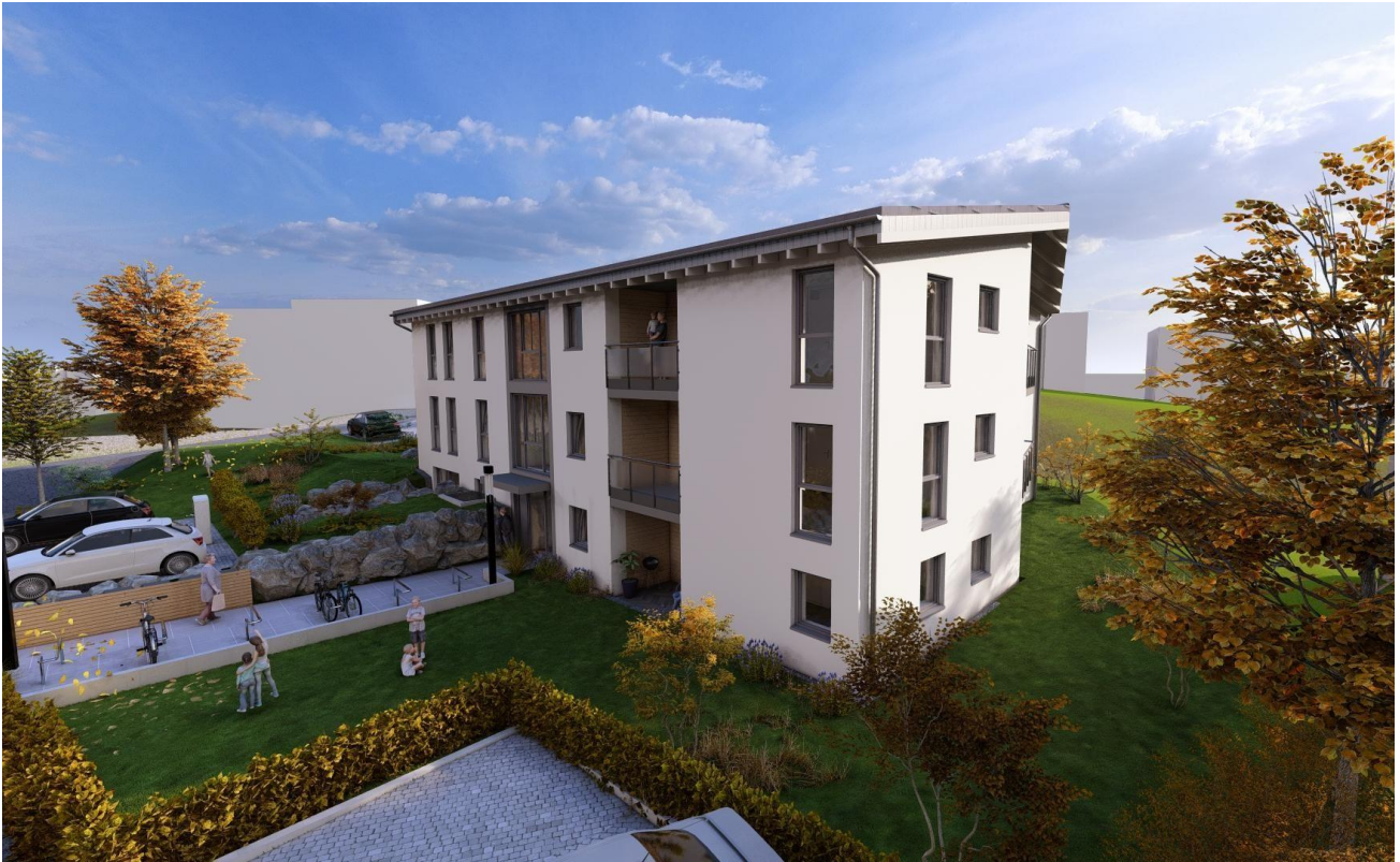
Neubau in Seelscheid