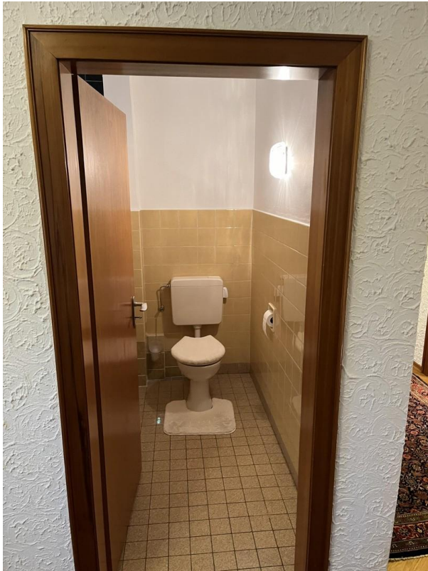
OG - WC