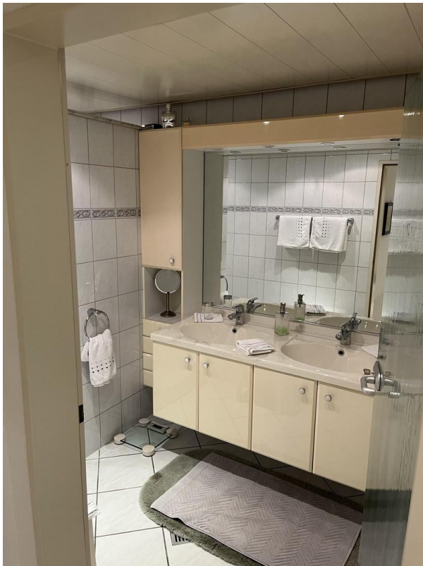
UG - Badezimmer mit Dusche