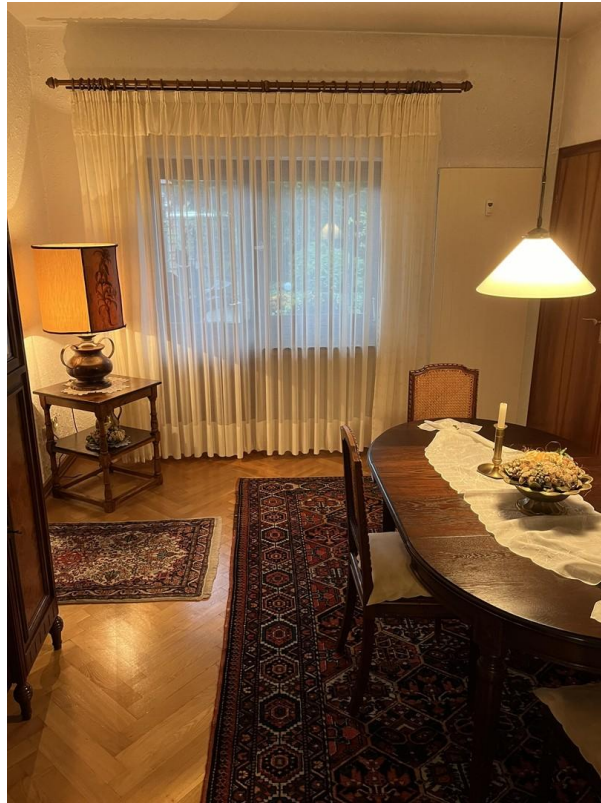
EG - Wohn- /Schlafzimmer 2