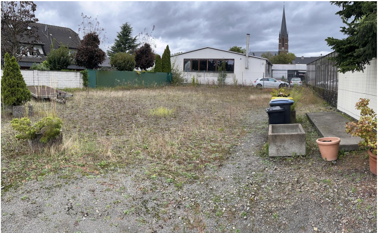
EG - Stellplatz KFZ