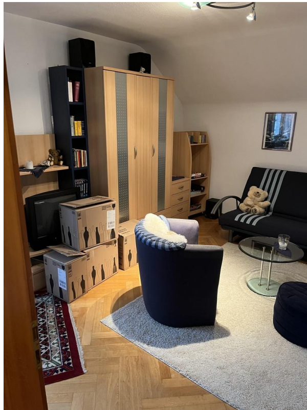
OG - Schlafzimmer 3