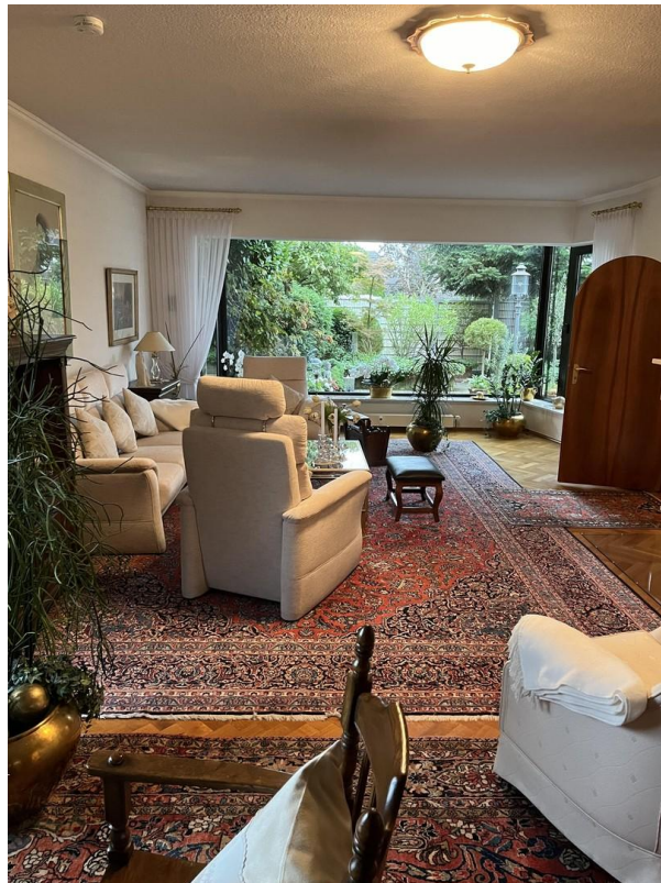
EG - Wohn- /Schlafzimmer 1