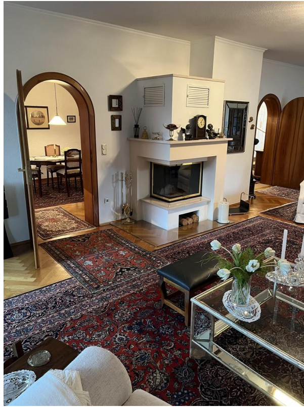
EG - Wohn- / Schlafzimmer 1