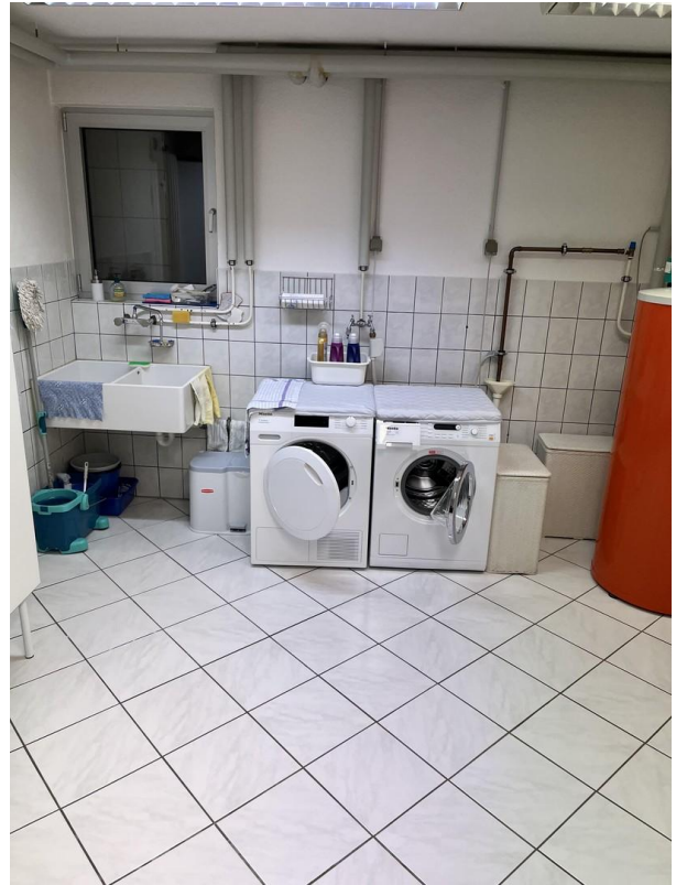
UG - Waschküche