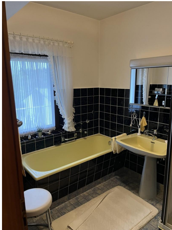
OG - Badezimmer mit DU & BW