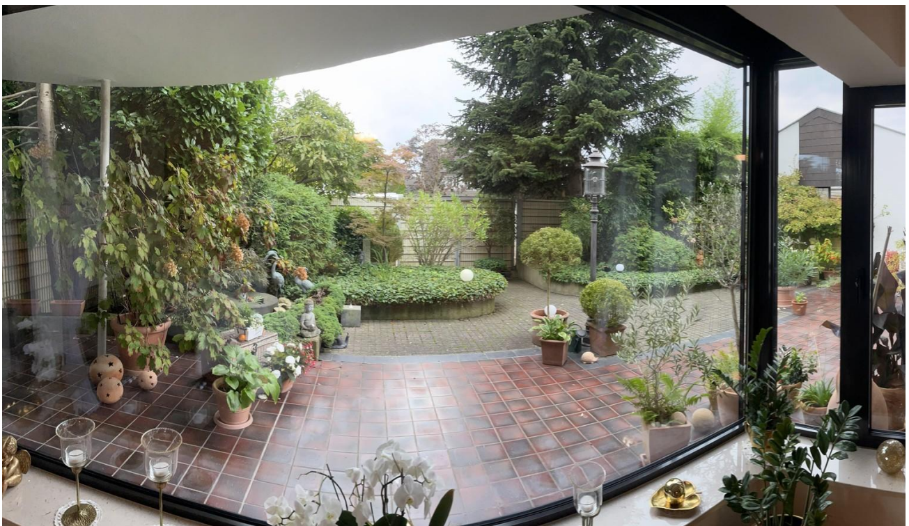
EG - Wohnzimmer Blick Terrasse