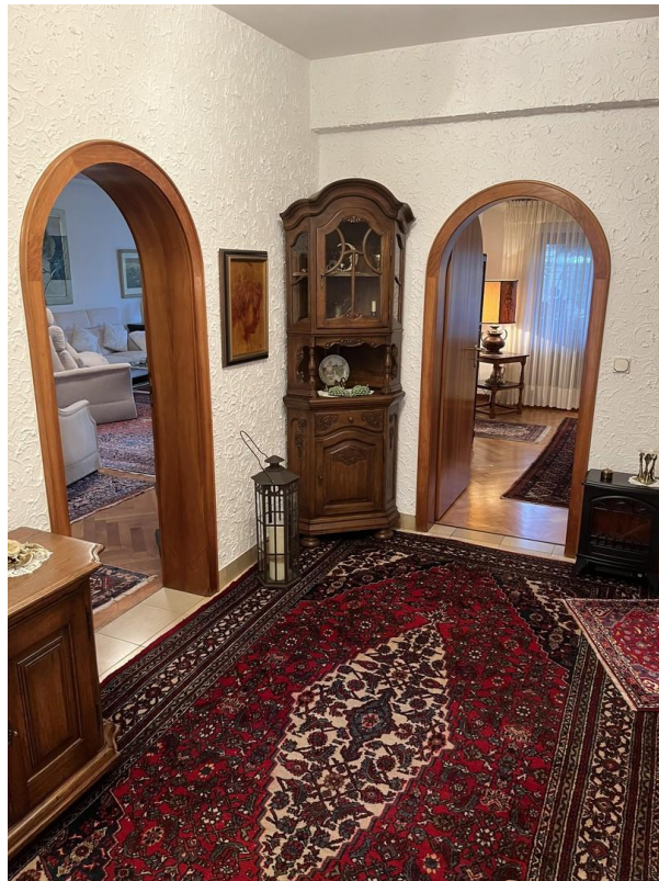
EG - Flur