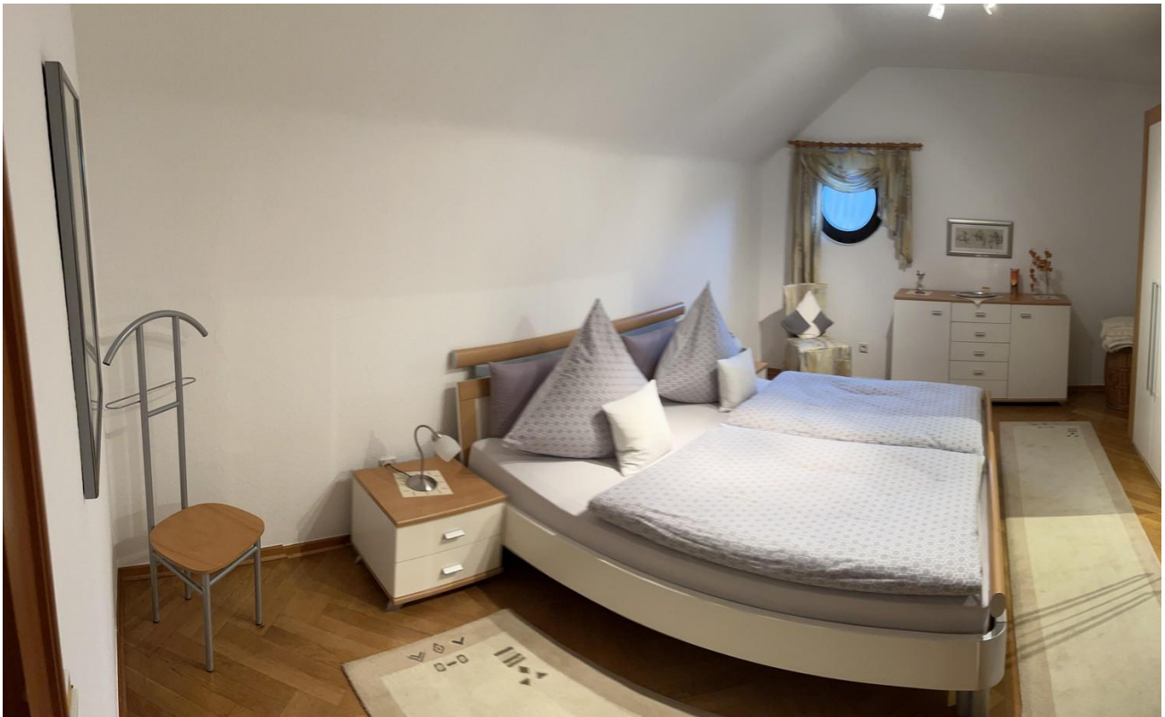
OG - Schlafzimmer 1