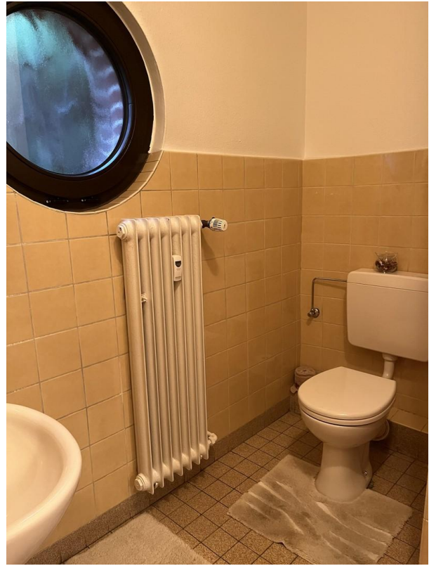
EG - WC