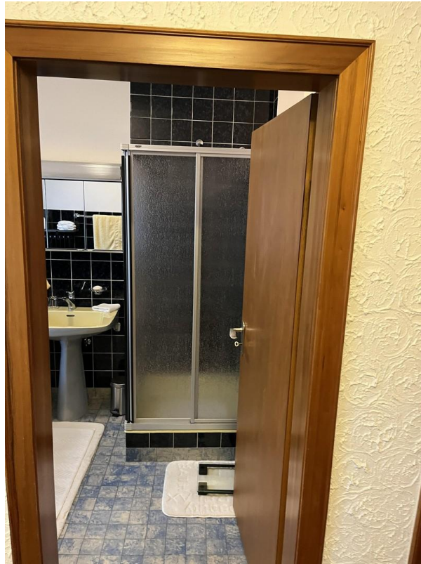
OG - Badezimmer mit DU & BW