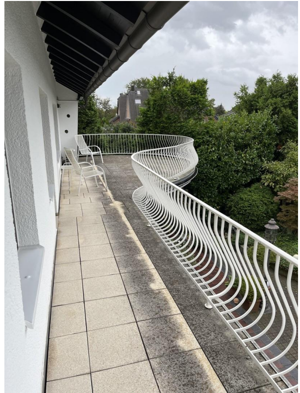
OG - Balkon