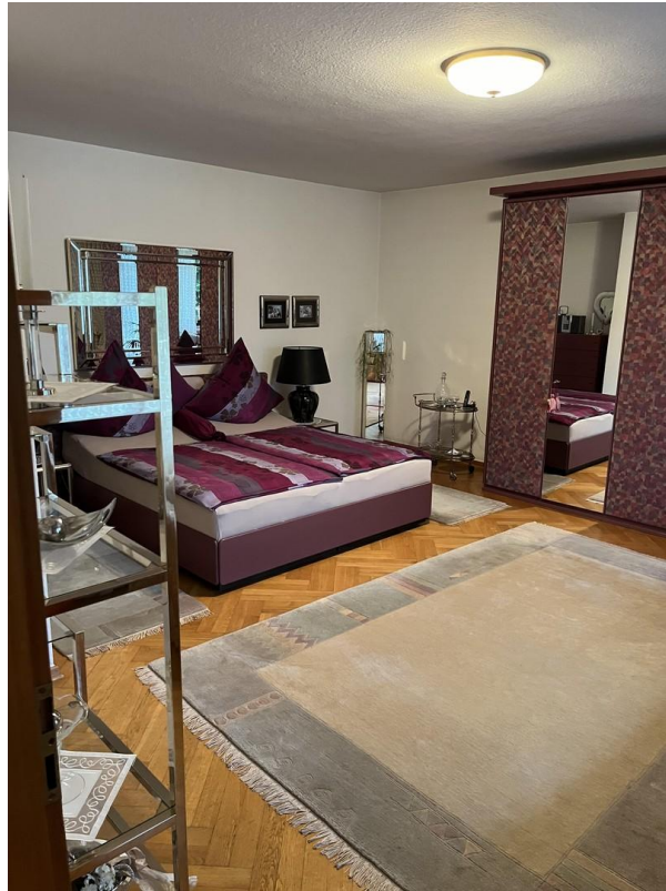
OG - Schlafzimmer 2