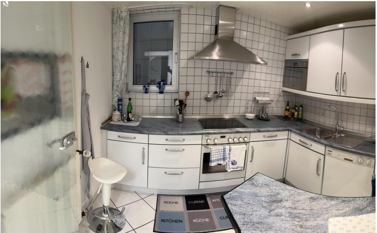
UG - Küche