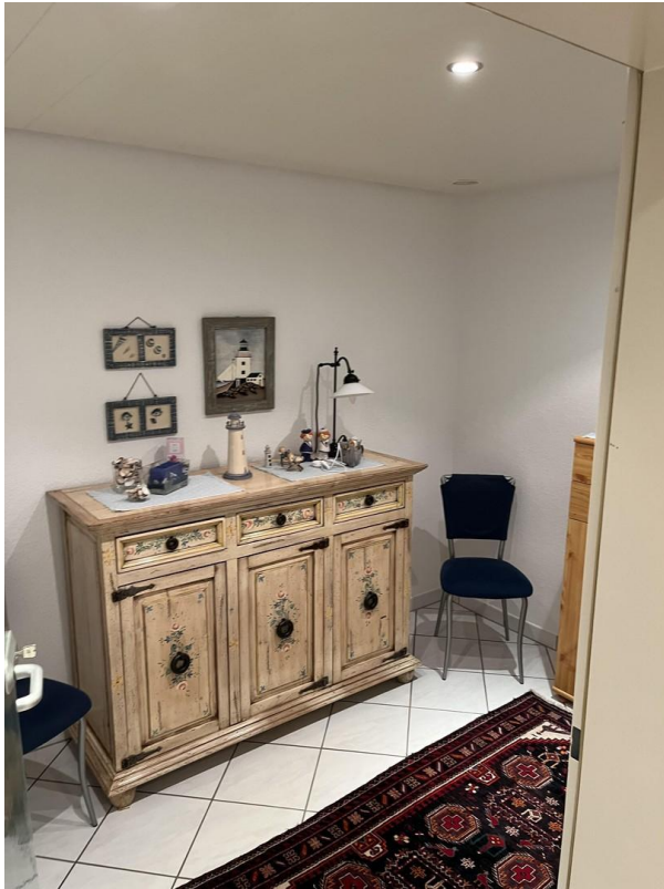
UG - Saunazimmer