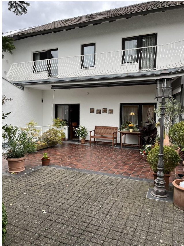
EG - Hausansicht von Garten