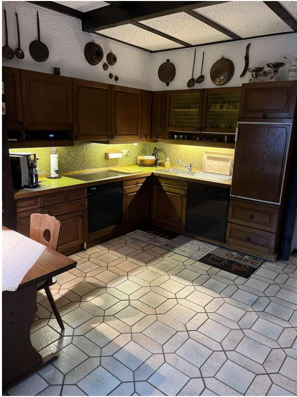
EG - Küche