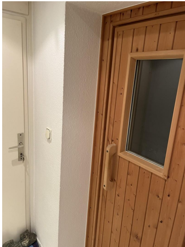
UG - Sauna