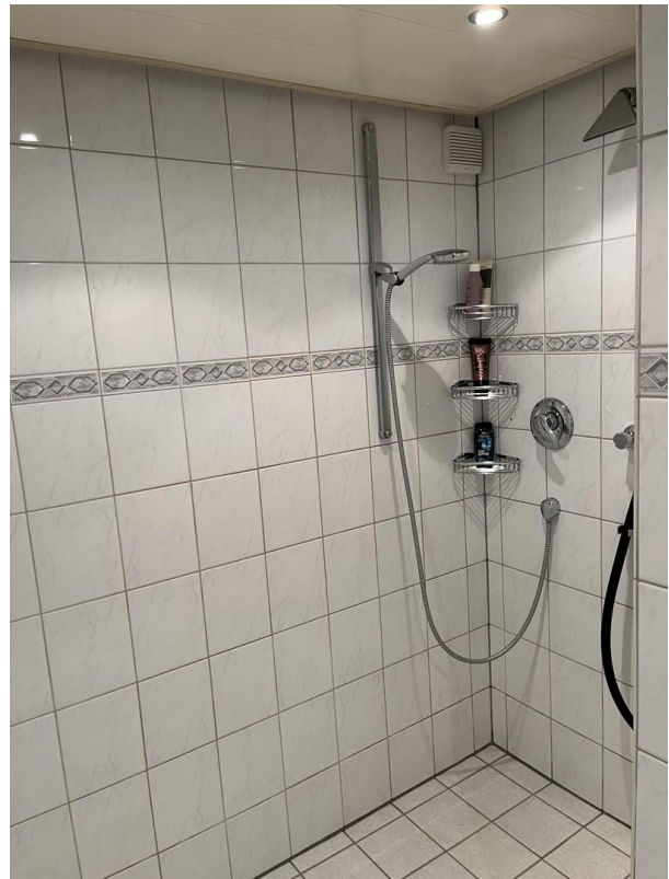
UG - Badezimmer mit Dusche