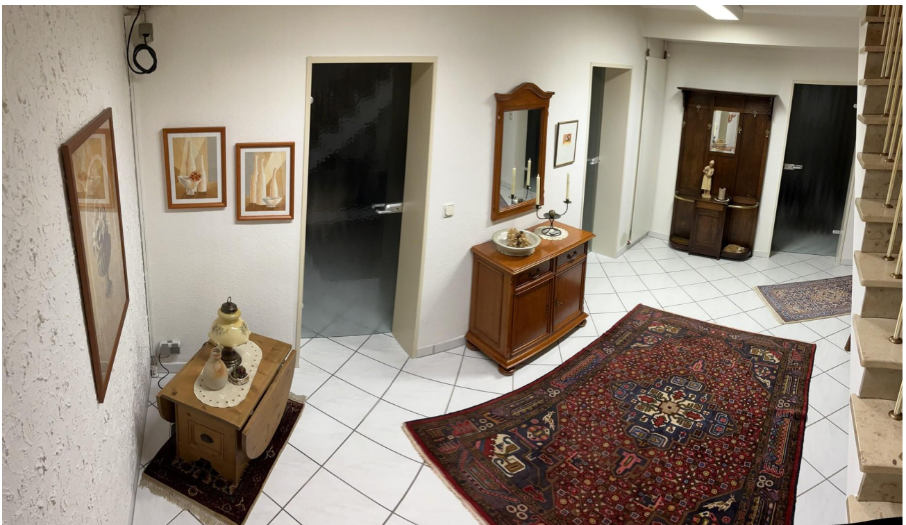
UG - Flur