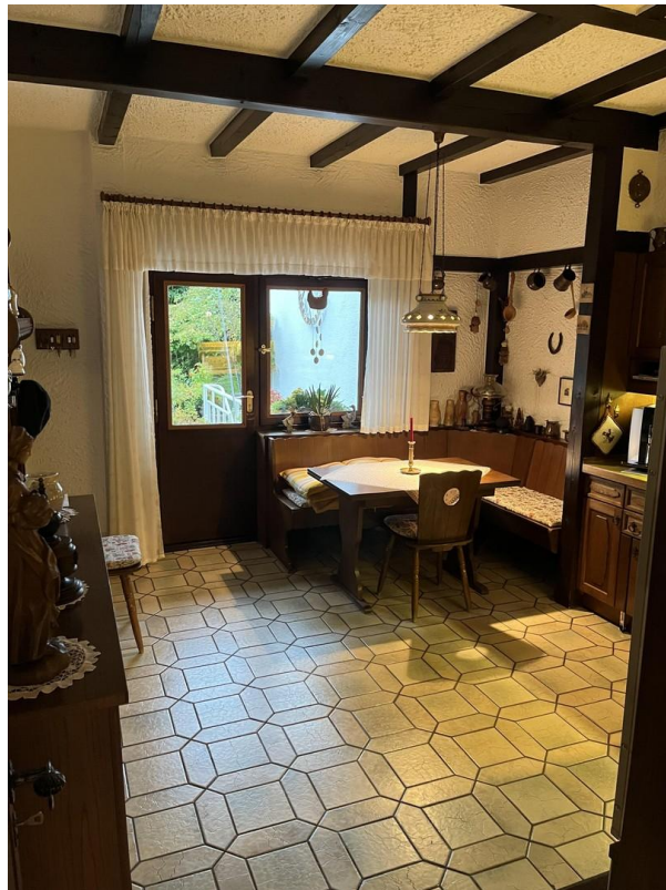
EG - Küche