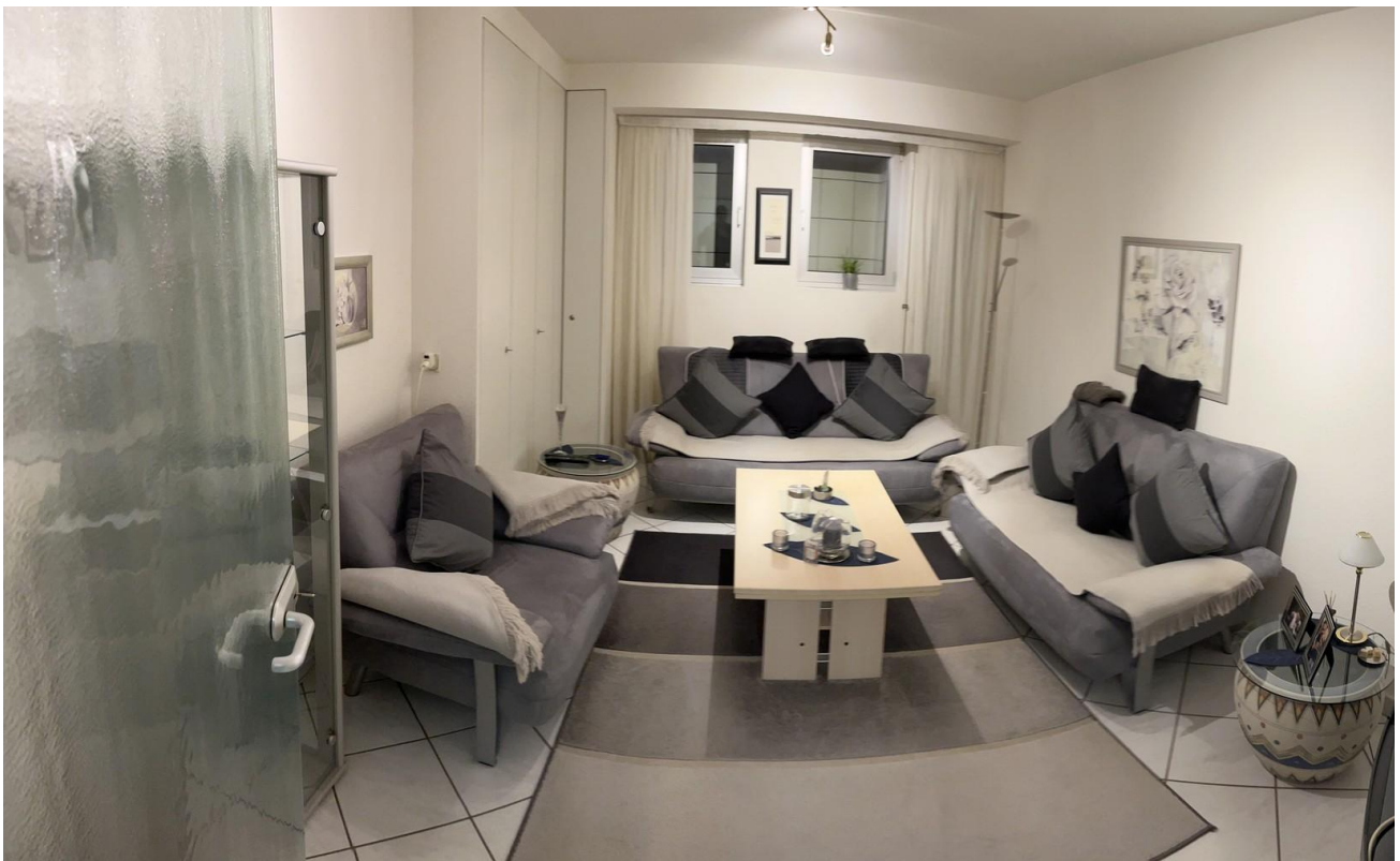
UG - Zimmer 1