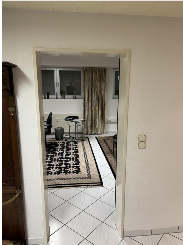
UG - Zimmer 2