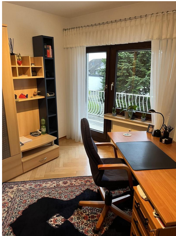
OG - Schlafzimmer 4