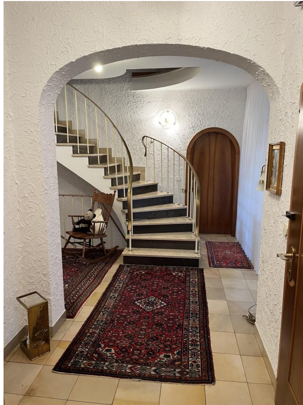
EG - Flur