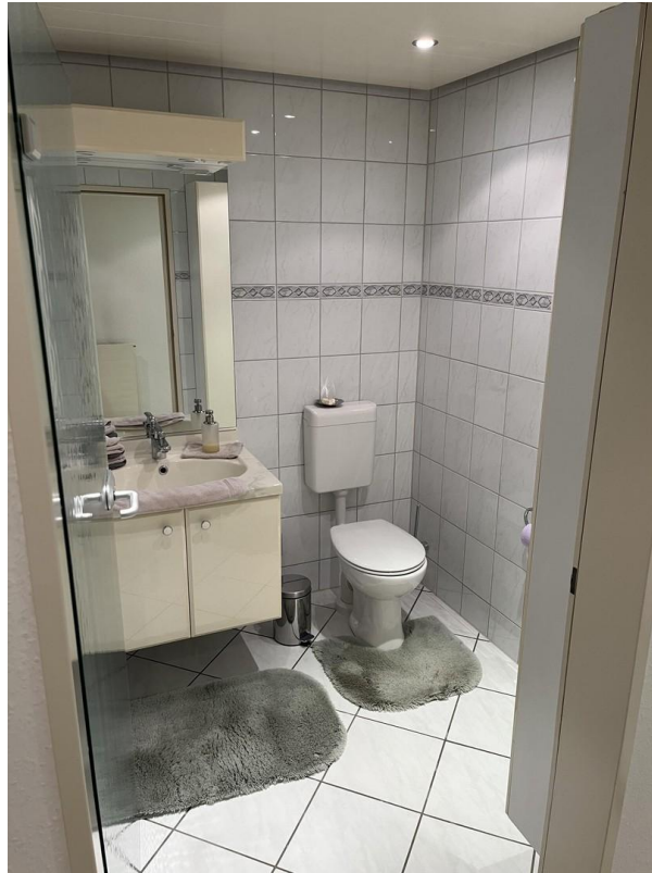
UG - WC