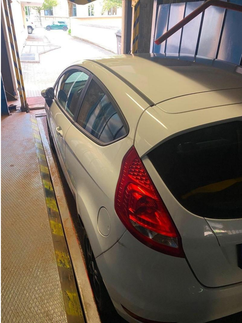
Auto in Hebebühne 3