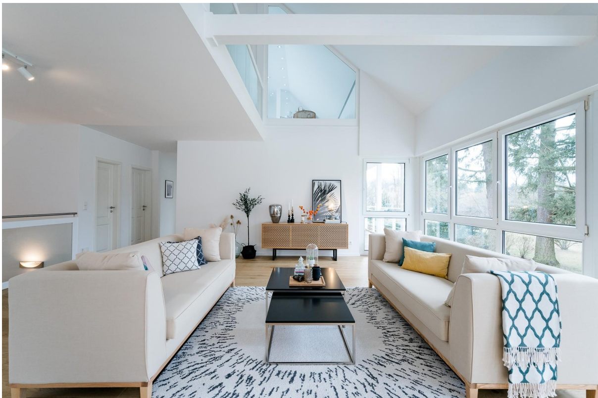
Wohnzimmer mit Galerie