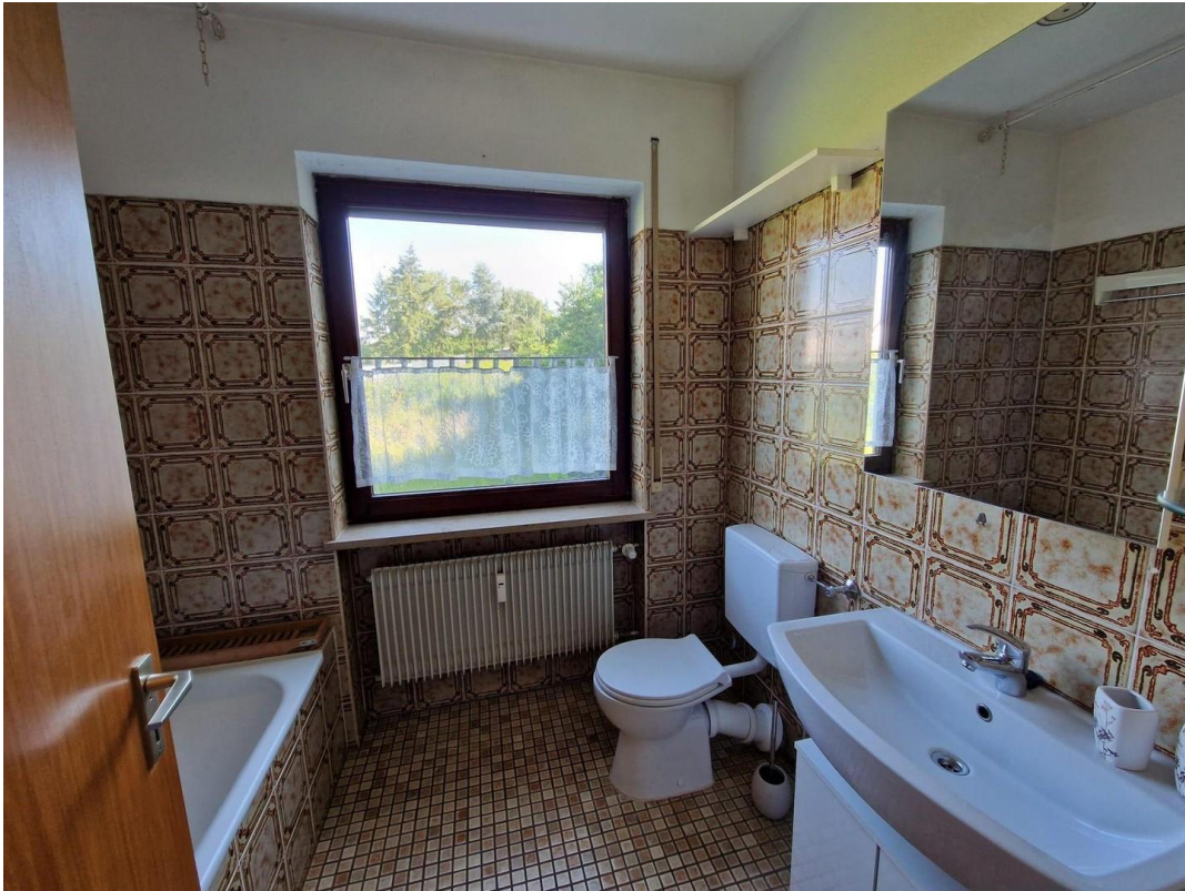
Tageslichtbad mit Badewanne