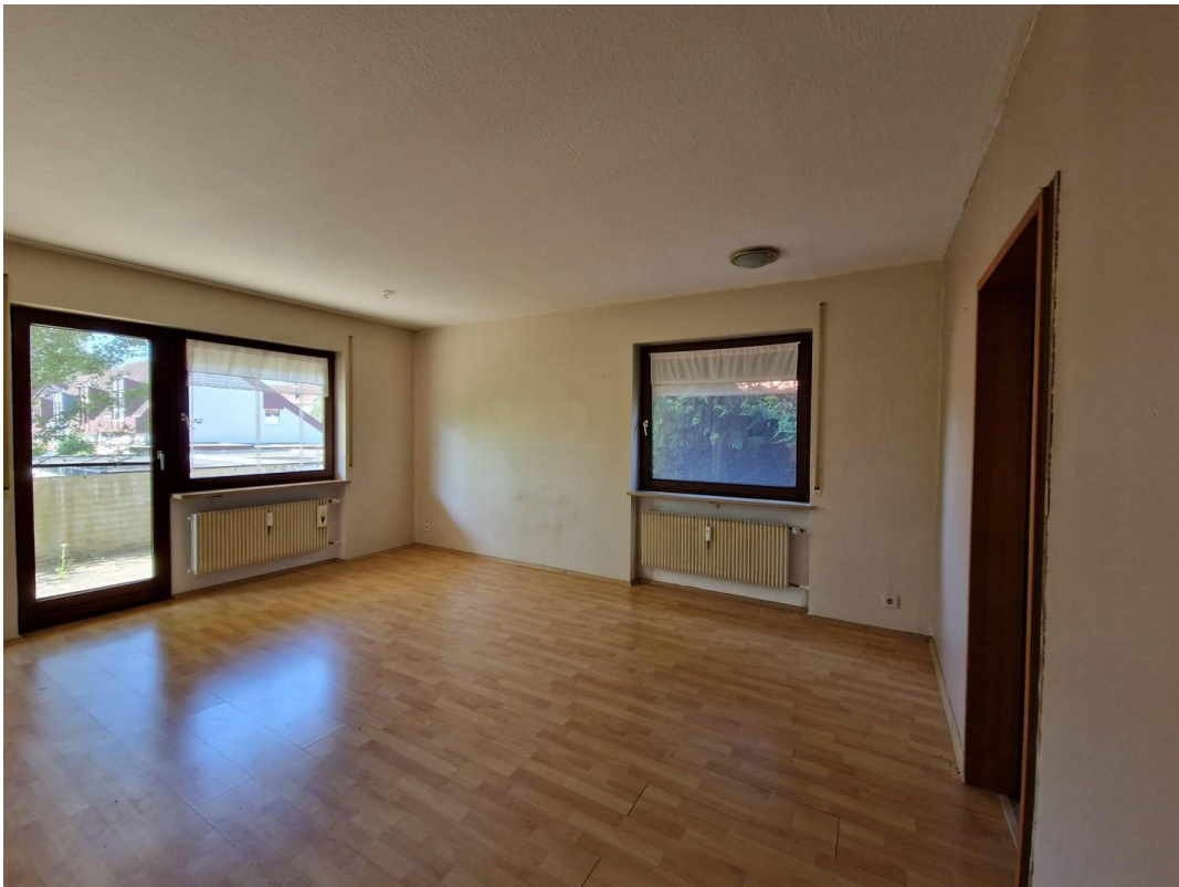
Wohnzimmer Beispiel aus EG