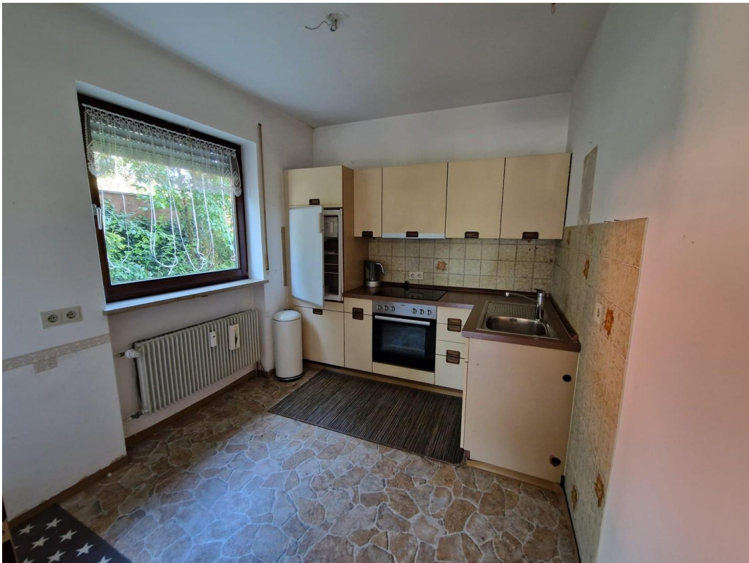
Küche Beispiel aus EG