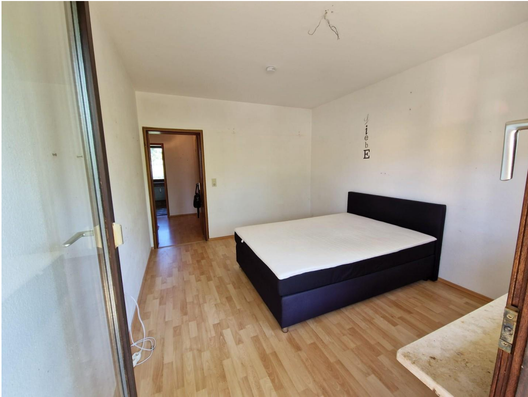
Schlafzimmer Beispiel aus EG