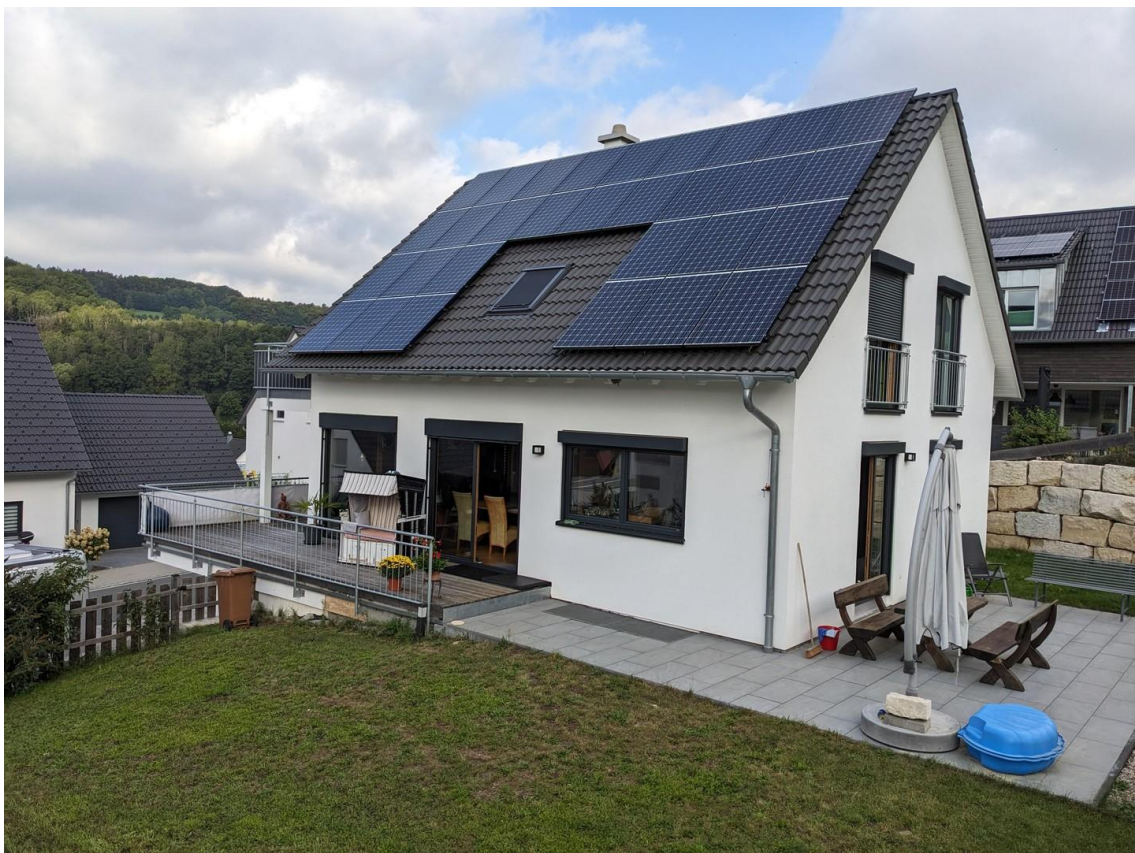
Haus und Garten