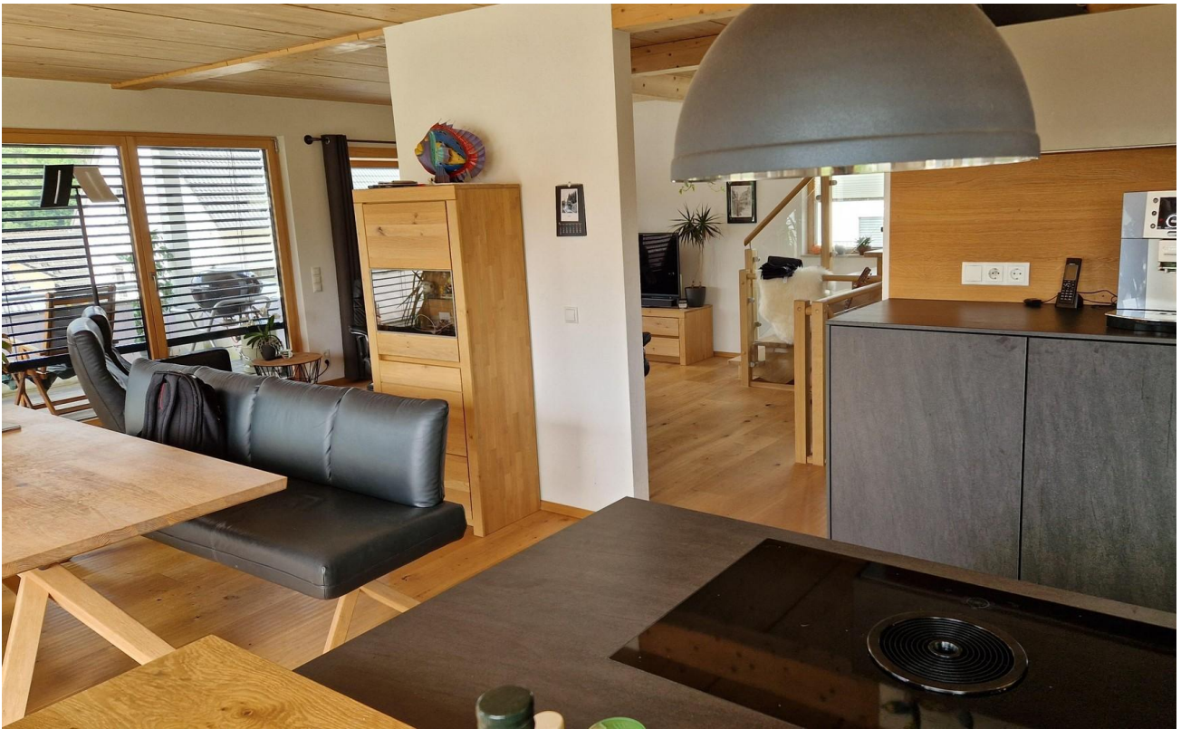
Ess- und Wohnzimmer