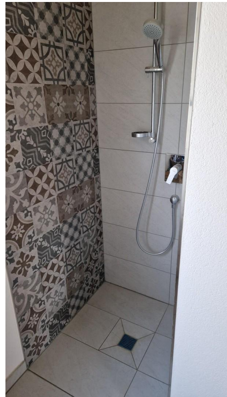
Gäste WC Dusche