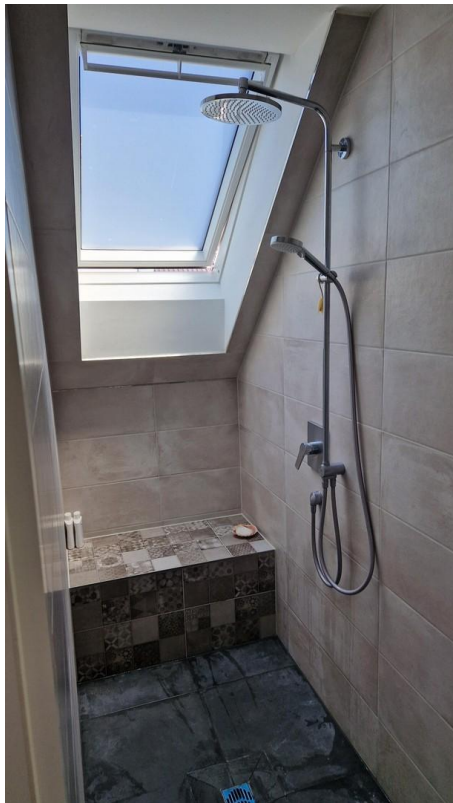
Bad - walk in Dusche