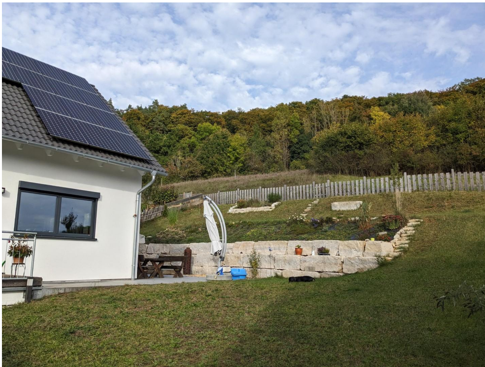
Haus mit Blick ins Grüne