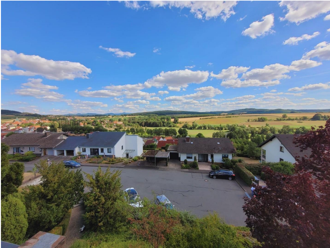
Blick in die Rhön