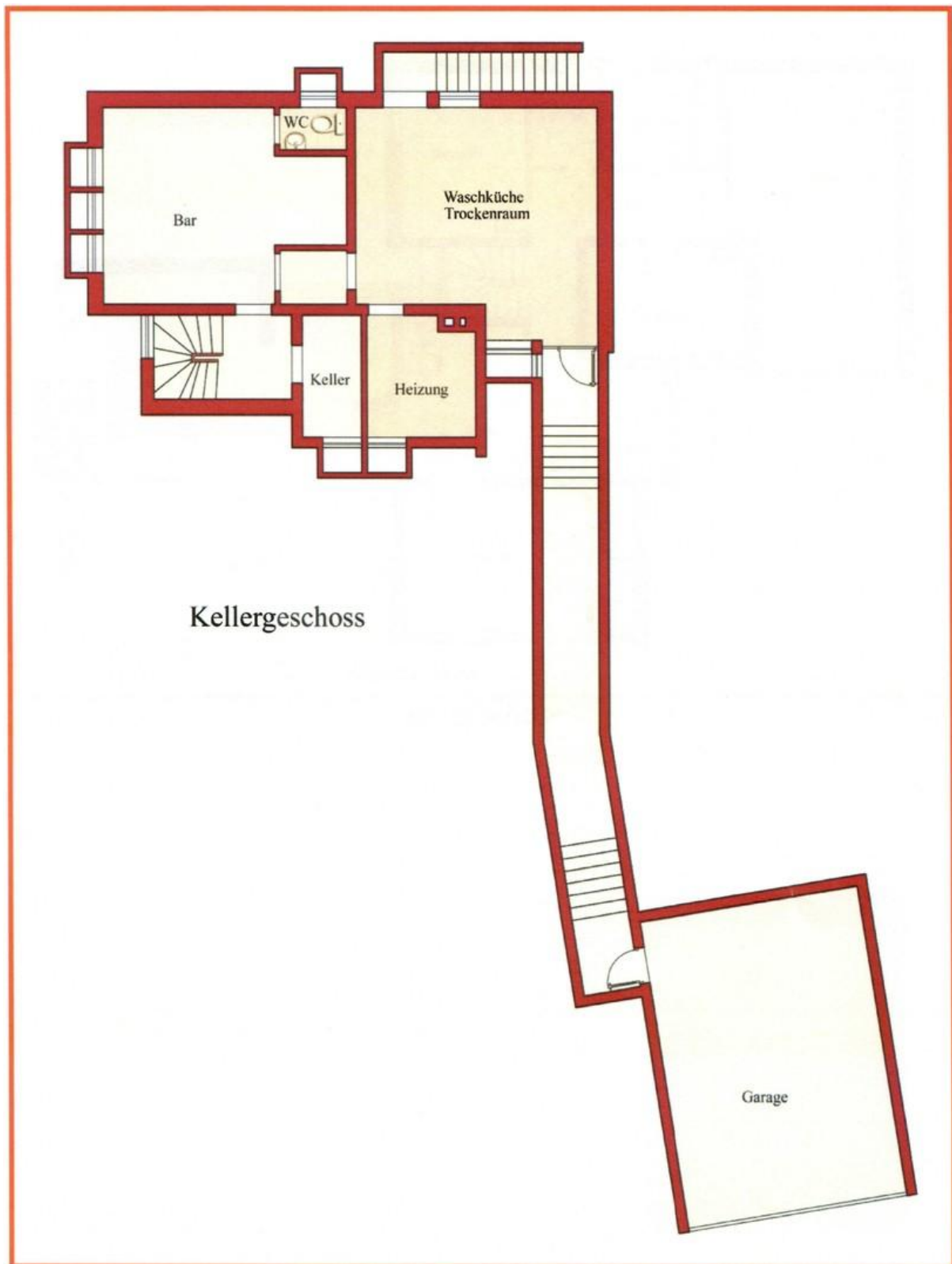
Grundriss Keller mit Garage