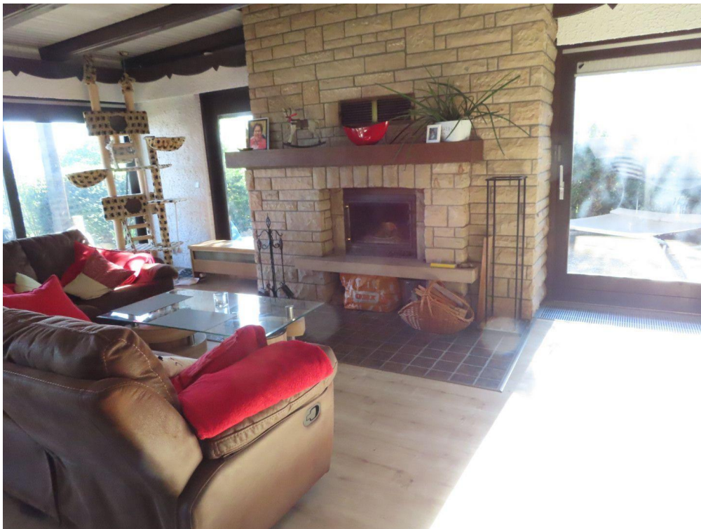
Wohnzimmer mit Kamin EG