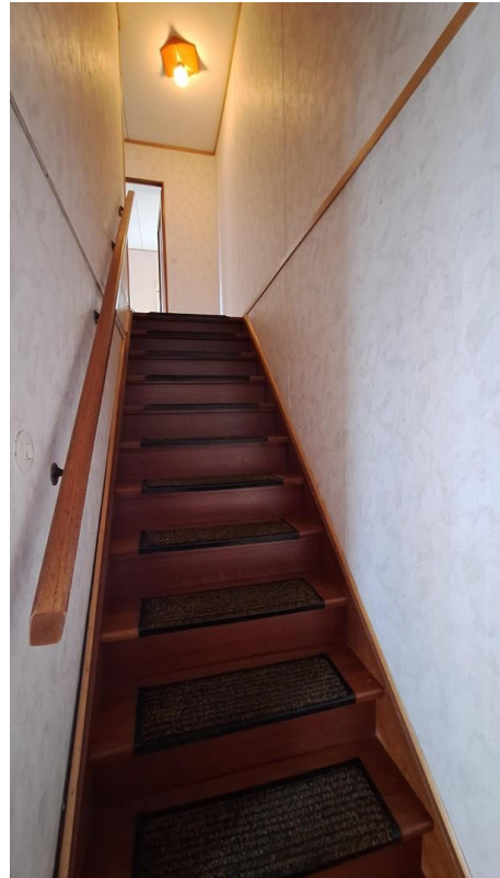
Treppe ins OG