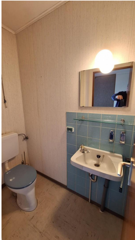
Gäste WC EG