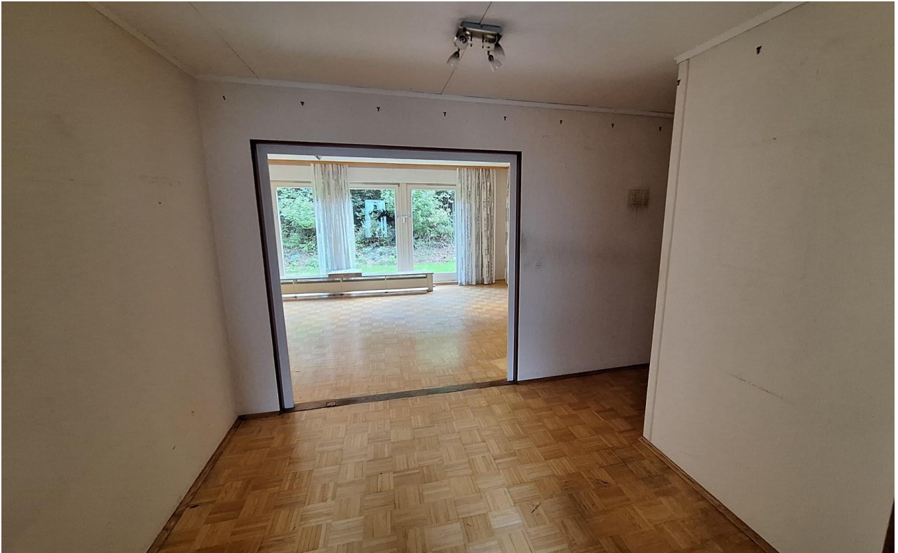
Flur EG Wohnzimmer