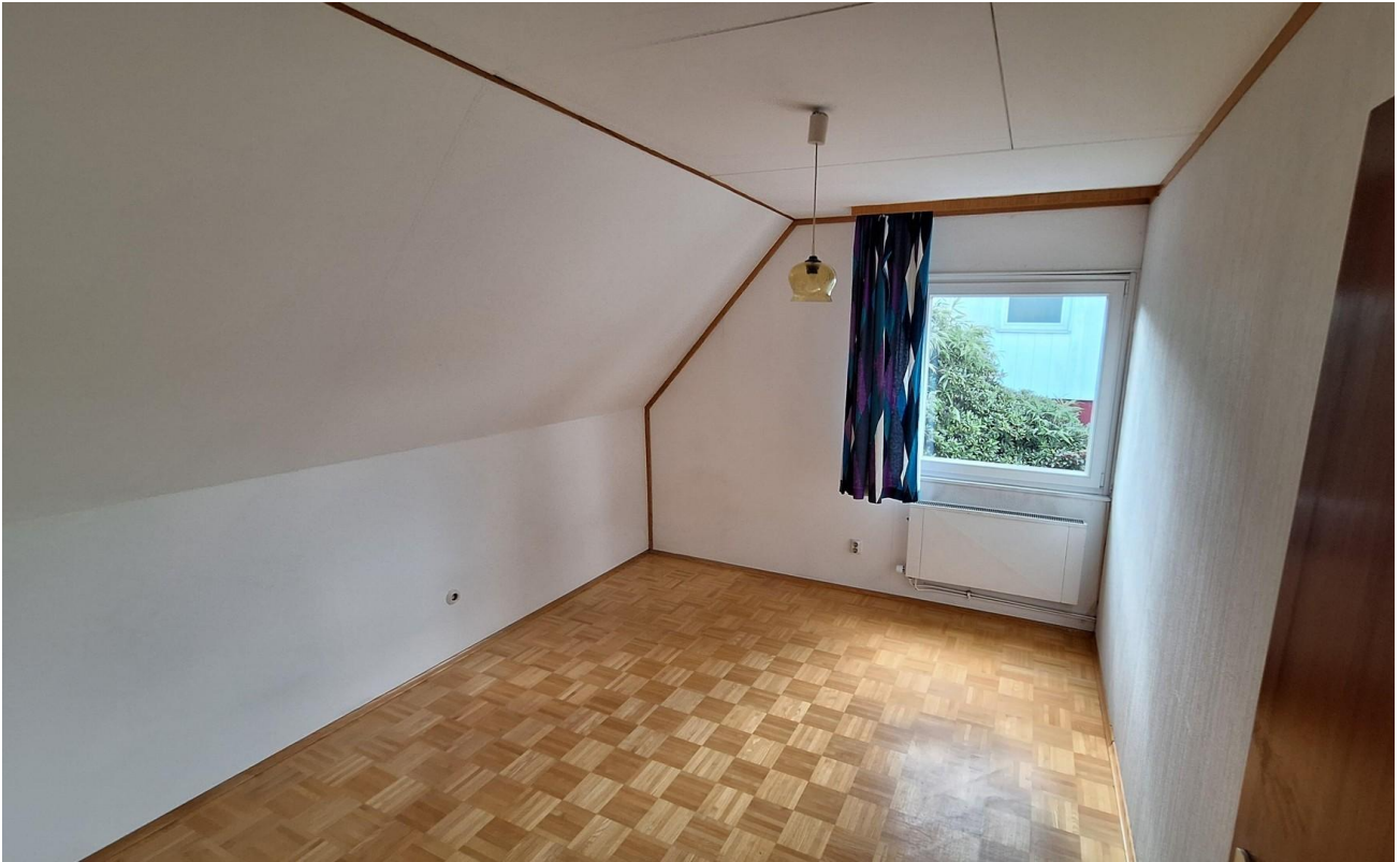
Zimmer 3 OG