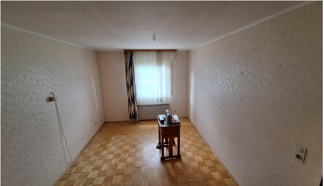
Zimmer 2 EG