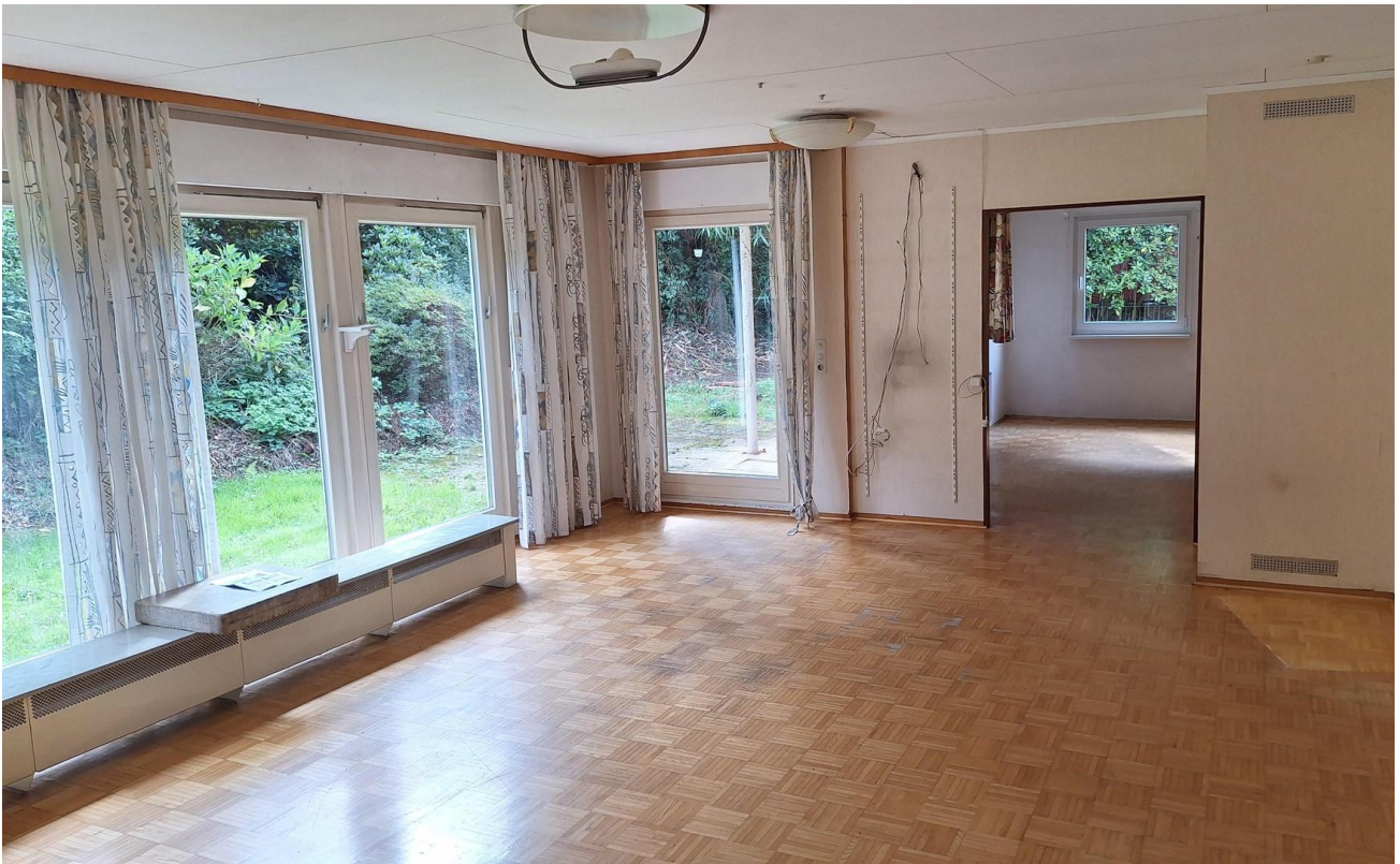
Wohnzimmer EG 2