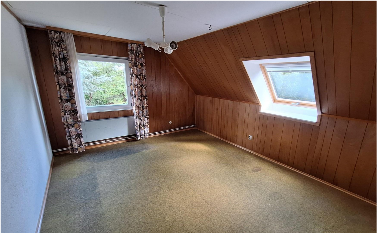
Zimmer 1 OG