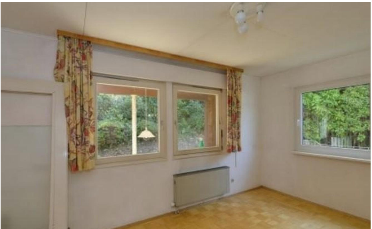
Zimmer 1 EG Terrasse