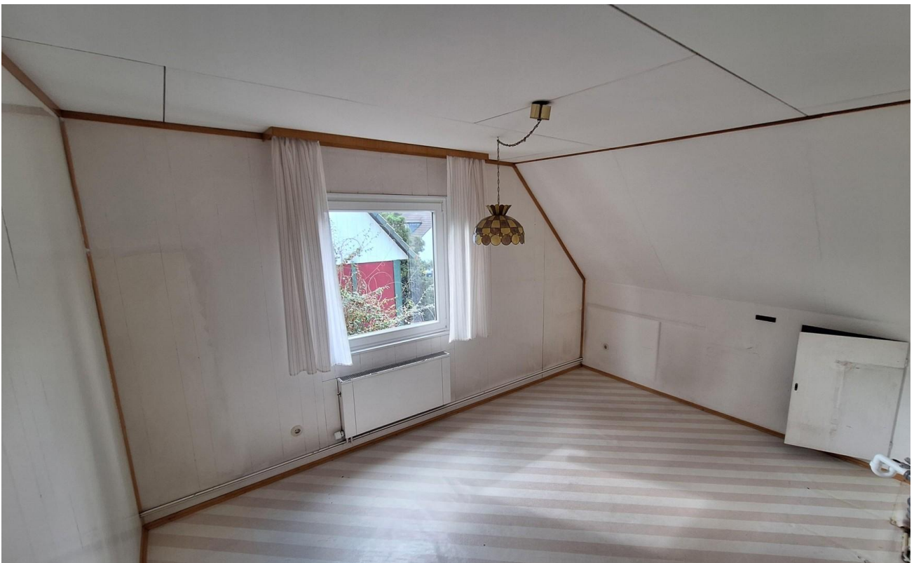
Zimmer 4 OG