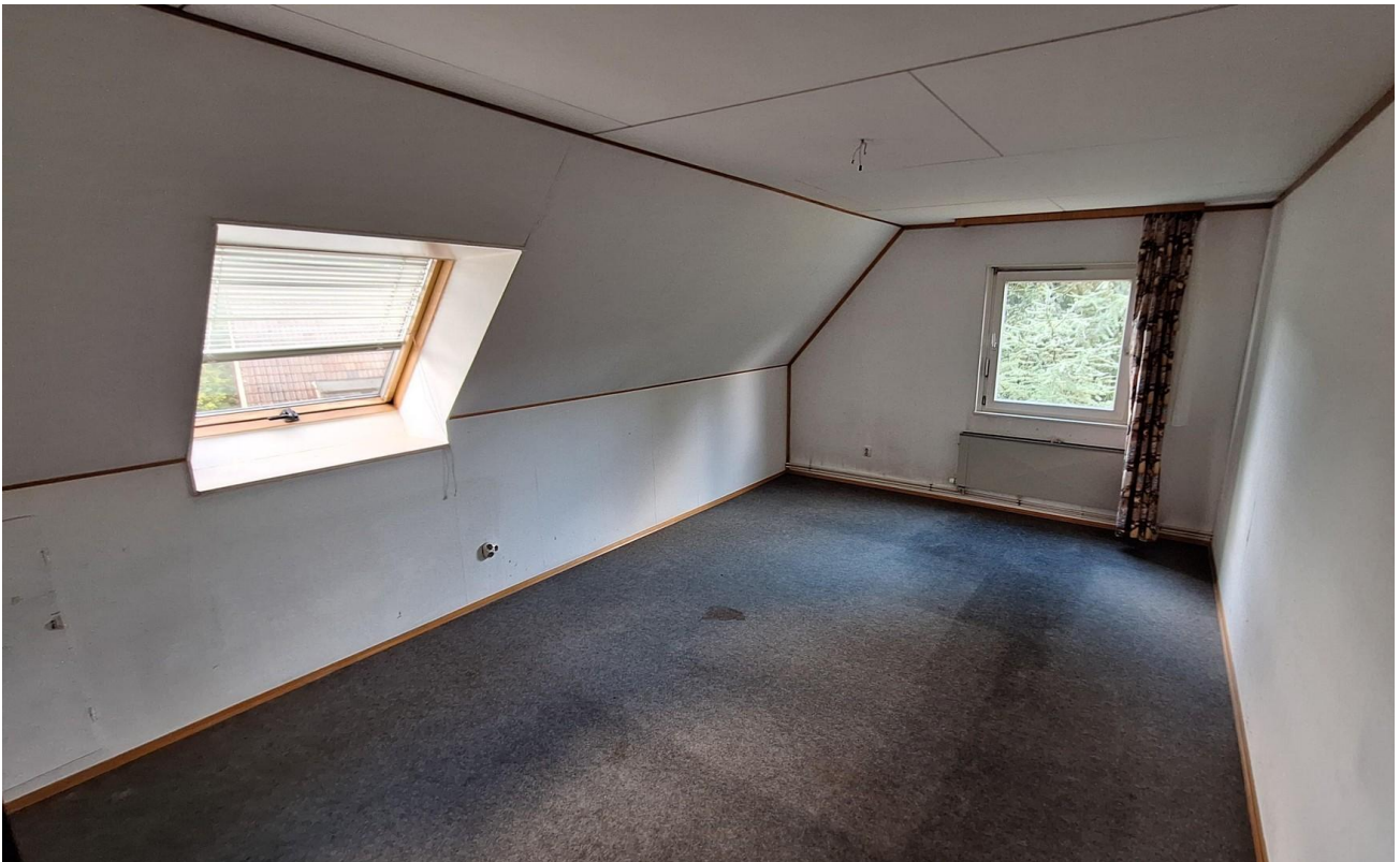
Zimmer 2 OG