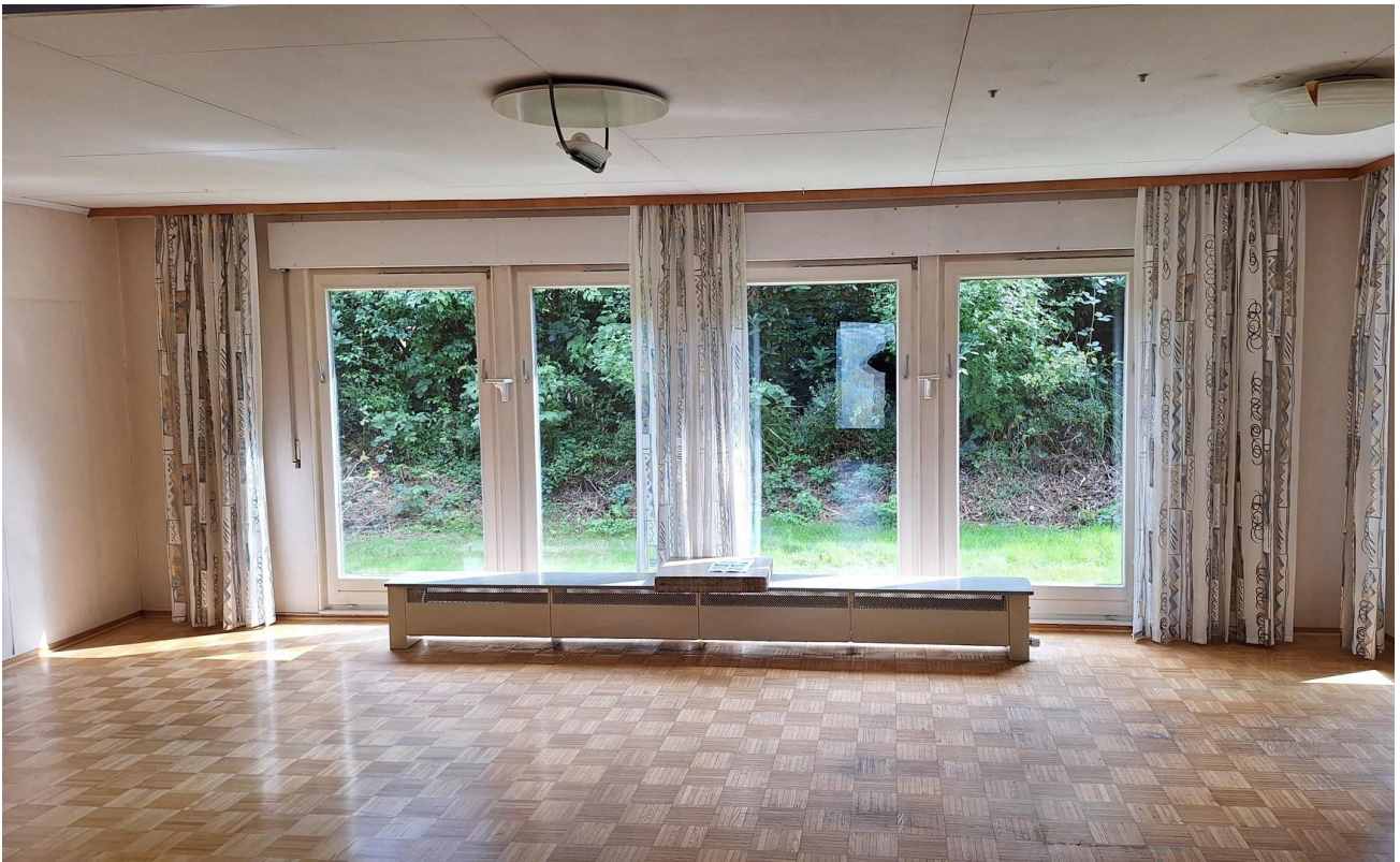
Wohnzimmer EG 1