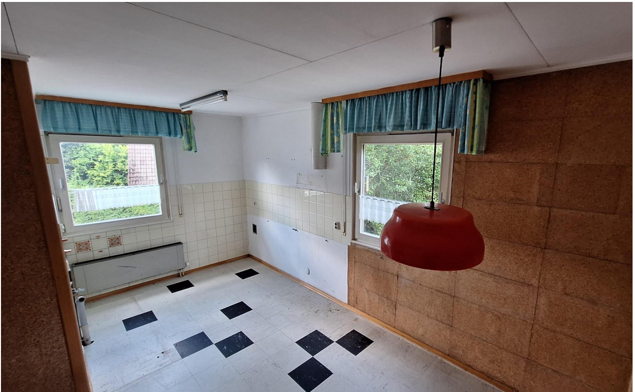
Küche 1 EG